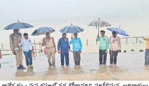
కాశ్యపరం : పుష్కరసూట్ వద్ద గోదావరిని పరిశీలిస్తున్న అధికారులు