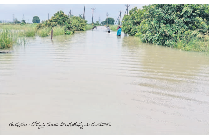
గణపురం : రోడ్డుపై నుంచి పొంగుతున్న మోరంపాగు

వర్ధన్నపేట పీఏసీఎస్ పరిధిలో వర్ధన్నపేట : వర్ధన్నపేట పీఏసీఎస్ నుంచి 925 మంది రూ.లక్షలోపు రుణం తీసుకున్న రైతుల జాబితాను అధికారులు గతనెలలోనే ప్రభుత్వానికి అందించారు. కానీ ఇందులో కేవలం 490 మందికి మాత్రమే రుణమాఫీ జరిగింది. దీంతో మాఫీ జరగని వారు ఆందోళనకు గురవుతున్నారు. డోర్ కల్ నియోజకవర్గం పరిధిలో.. మహబూబాబాద్ జిల్లా డోర్ కల్ నియోజకవర్గంలోని అర్హతల పరిధిలో రూ. లక్షలోపు రుణాలు తీసుకున్న రైతులు 7,345 మంది ఉండగా కేవలం 1,716 మందికి మాత్రమే రుణమాఫీ అయినట్లు అధికారులు చెబుతున్నారు. కురవి, గుండ్రాపేట మండలాల పరిధిలోని ఎస్.వీ.ఎస్(సీనియర్ సాస్టెబిల్) రూ.లక్షలోపు రుణం తీసుకున్న రైతులు 2,037 మందిలో ఒక్కరికి కూడా మాఫీ వర్ధించలేదు. మరిపేడ, చిన్నగూడూరు మండలాలలోని పీఏసీఎస్ పరిధిలో 1,833 మందికి 786, నర్సింహాలపేట, దంతాలపల్లి పరిధిలో 1,543 మందికి 501, డోర్ కల్ పీఏసీఎస్ పరిధిలో 620 మందికి 135, మన్నెగూడెం పరిధిలో 582 మందికి ఉండగా 178 మంది రైతులకు మాత్రమే రుణమాఫీ అయినట్లు అధికారులు ప్రకటించారు. డీసీసీ పరిధిలో కేవలం 30 శాతం రైతులకు మాత్రమే రుణమాఫీ అయినట్లు చెబుతున్నారు.