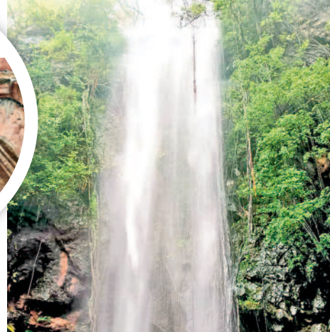
బయ్యారం : పెద్దగుట్టపై జాలువారుతున్న పొండపుల జలపాతం