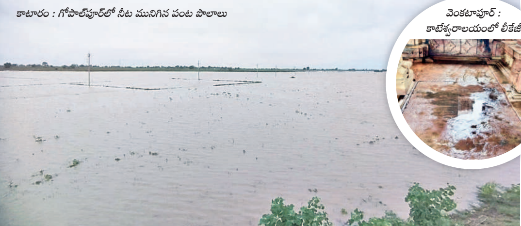
కాటూరు : గోపాలపూర్లో నీటి మునిగిన పంట పొలాలు