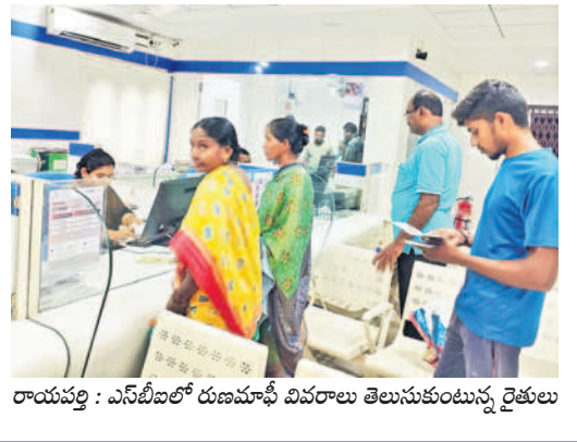
రాయపల్లి : ఎస్.వీ.బి.లో రుణమాఫీ వివరాలు తెలుసుకుంటున్న రైతులు