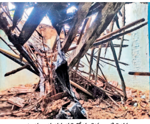
కాటూరు : శంకరవల్లిలో కూలిన ఇంటి పైకప్పు