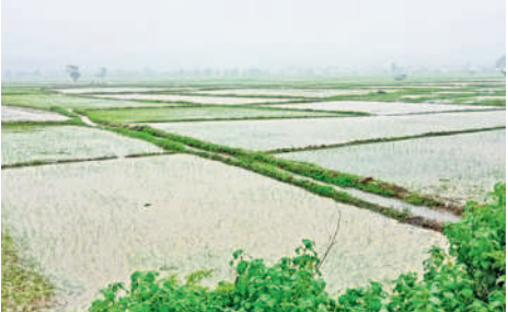
వాజేడు : ప్రగణపల్లి వద్ద పంటపొలాల్లోకి చేరిన వరదనీరు