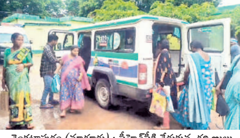
వెంకటాపూరు (నూగూరు) : సీహెచ్.సీ. చేరుకున్న గర్భిణులు