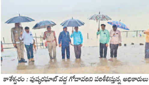
కాశ్యపం : పుష్కరసూట్ వద్ద గోదావరిని పరిశీలిస్తున్న అధికారులు