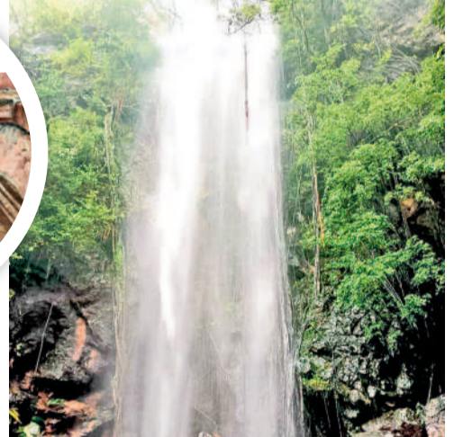
బయ్యారం : పెద్దగుట్టపై జాలువారుతున్న పాండవుల జలపాతం