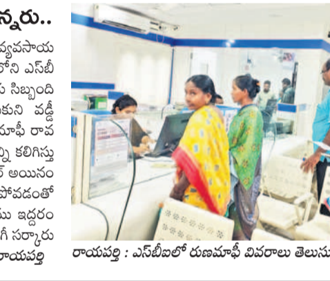
రాయపల్లి : ఎస్.బీ.బి.ల్ రుణమాఫీ వివరాలు తెలుసుకుంటున్న రైతులు