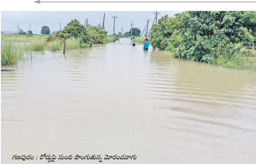
గణపురం : రోడ్డుపై నుంచి పొంగుతున్న మోరంపవూగు