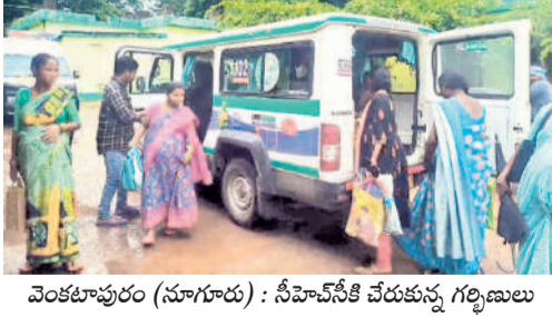
వెంకటాపురం (నూగూరు) : సీహెచ్.ఎస్.సి చేరుకున్న గర్భిణులు