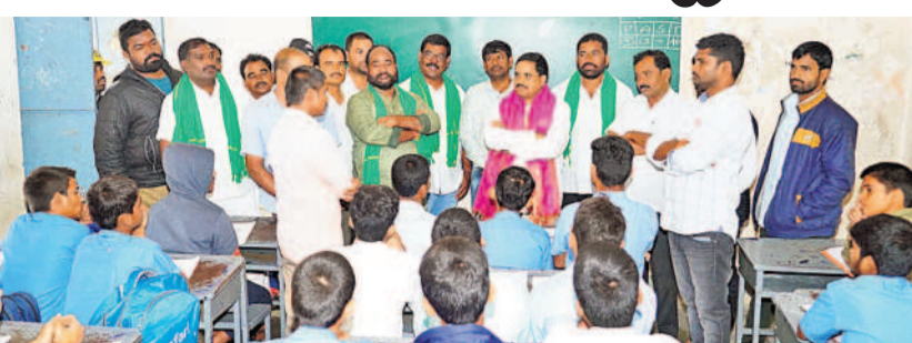
కడ్రాల్: ఆశ్రమ పాఠశాలలో సమస్యలను తెలుసుకుంటున్న ఎమ్మెల్యే కసిరెడ్డి నారాయణరెడ్డి

ఎమ్మెల్యే కసిరెడ్డి నారాయణరెడ్డి మైసినగండ్ల ఆశ్రమ పాఠశాల పరిశీలన