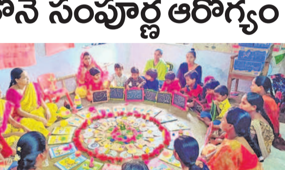
కడ్రాల్: అమ్మమాల-అంగన్ వాడీ బాల కార్యక్రమాన్ని నిర్వహిస్తున్న ఐ.డి.ఎస్ సూర్యవైజ్ఞం మమత

పలు అంగన్ వాడీ కేంద్రాల్లో అమ్మమాల - అంగన్ వాడీ బాల కార్యక్రమం చిన్నారులకు అక్షరాభ్యాసం చేయించిన టీచర్లు