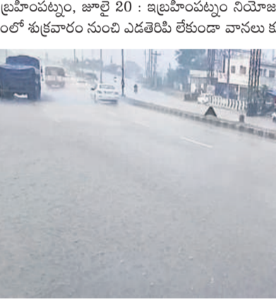
ఇబ్రహీంపట్నంలో కురుస్తున్న వాన

పలు ప్రాంతాల్లో ఎడతెరిపి లేకుండా కురిసిన వానలు