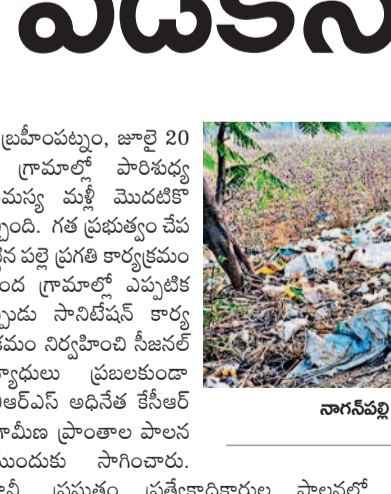
నాగనగర్ రోడ్డులో పేరుకుపోయిన చెత్తాచెదారం