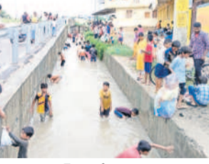
వేములవాడ: అర్ధం కాని కట్టు కాలువ వద్ద వేవలు పడుతున్న చిన్నారులు

వ్యాప్తంగా 9.8 మిల్లీమీటర్ల వర్షపాతం సమాధింది. అత్యధికంగా చంద్రుర్తి మండలంలో 14.6 మిల్లీమీటర్లు సమాధింది. జగిత్యాల జిల్లాలో 70.3 మిల్లీ మీటర్ల వర్షపాతం సమాధింది. అత్యధికంగా ఇల్లూపాంట్టుం, మల్లాపూర్ మండలాల్లో 111.0 మిల్లీమీటర్ల వర్షపాతం రికార్డైంది.