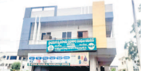
కోర్టులోని ప్రాథమిక సహకార సంఘం భవనం

కోర్టు/ కోర్టుల రూరల్, జూలై 20: కోర్టుల మండలంలోని ఆరు సంఘాల పరిధిలో సగంమందికి రుణమాఫీ అంద లేదు. కోర్టుల ప్రాథమిక సహకార సంఘంలో రూ.లక్షలోపు లోన్లు తీసుకున్నవారు 671 మంది ఉండగా, 250 మందికి మాత్రమే మాఫీ జరిగింది. ఎల్సీపూర్లో 681 మందికిగాను 189 మందికి, మాదాపూర్ సంఘంలో 628 మందికిగాను 137 మందికి, పైడిమడుగులో 849 మందికిగాను 136 మందికి, చిన్నమెట్లపల్లిలో 640 మందికిగాను 269 మందికి, అయిలాపూర్ సంఘంలో 429 మందికిగాను కేవలం 108 మందికి మాత్రమే మాఫీ జరిగింది. మొత్తంగా 3896 మంది లోన్ తీసుకుంటే 1078 మందికే రద్దు కాగా, మిగిలిన 2818 మంది ఆందోళన చెందుతున్నారు.