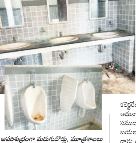
అపరిశుభ్రంగా మరుగుదొడ్లు, మూత్రశాలలు