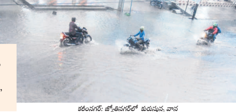
కరీంనగర్: జ్యోతిసగల్లో కురుస్తున్న వాన

ధర్మపురి/ జగిత్యాల టౌన్, జూలై 21: అల్పవీడన ప్రభావంతో కరీంనగర్ ఉమ్మడి జిల్లాలో మూడు రోజులుగా విస్తారంగా వర్షాలు కురుస్తూనే ఉన్నాయి. శనివారం సాయంత్రం నుంచి తెరిపే లేకుండా పడుతుండగా వరకు, వంకల పొంగుతున్నాయి. కుంటలు, చెరువుల్లో వరద నీరు చేరుతుండగా, మత్తళ్ల పడుతున్నాయి. కరీంనగర్ జిల్లా హజారాబాద్ లోని చిలుక వాగు శనివారం రాత్రి నుంచే పొంగి పొర్లుతోంది. వాగు పరిసరాల్లోని కొన్ని గ్రామాల్లో పంటలు నీల మునిగాయి. శంకరవట్టుం మండల కేంద్రం కేకవట్టుంలోని వాగులో వరద ఉధృతంగా వస్తోంది. జగిత్యాల జిల్లాలో వర్షం దంబికోట్లోంది. కొడిమ్యాల మండలం పొతూరు రిజర్వాయర్, కోనాపూర్ లోని బంజరు చెరువు మత్తళ్ల దూకుతున్నాయి. కొడిమ్యాల నుండి సూరంపేట వెళ్లేదారిలో కోనాపూర్ శివారులో మాటుకుంట కట్ట కోతకు గురి కావడంతో కోర్టుల నుంచి కరీంనగర్ వెళ్లే ఆర్టీసీ బస్సును అధికారులు నిలిపివేశారు. వేములవాడ మూలవాగు జలకళ సంకరంబుతుంది. పట్టణంలో బతుకమ్మ తెప్ప వద్ద చెక్ డ్యాము మత్తడి దూకాగా అప్పాపూర్ కు వెళ్లేందుకు మూలవాగులో వేసిన రవాదారి కొట్టుకు పోయింది.