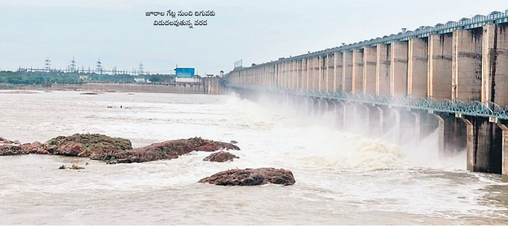
జూరాల గేట్ల సుందరి దిగువకు విడుదలవుతున్న వరద

మిలియన్ యూనిట్ల ఉత్పత్తి ఆత్మకూరు, జూలై 21 : ఎగువ, దిగువ జూరాల జలవిద్యుత్ కేంద్రాల్లో విద్యుదుత్పత్తి నిర్విరామంగా కొనసాగుతున్నది. ఎగువ కురుస్తున్న వర్షాలకు జూరాల రిజర్వాయర్ కు వరకే తాకిడి ప్రారంభమైంది. దీంతో నాలుగోజులుగా ఎగువ, దిగువ జూరాల జలవిద్యుత్ కేంద్రాల్లో విద్యుదుత్పత్తిని నిర్వహిస్తున్నారు. ఆదివారం ఎగువ జూరాలలో 5 యూనిట్లలో విద్యుదుత్పత్తి నిర్వహించగా శనివారం అర్ధరాత్రి నాటికి 8.9920 మిలియన్ యూనిట్ల ఉత్పత్తి చేయగా ఇప్పటివరకు 9.80 మిలియన్ యూనిట్ల ఉత్పత్తి జరిగింది. దిగువ జూరాలలో మొత్తం 6 యూనిట్లలో విద్యుదుత్పత్తి నిర్వహిస్తుండగా శనివారం అర్ధరాత్రికి 4.6837 మిలియన్ యూనిట్ల ఉత్పత్తి చేయగా ఇప్పటివరకు 11.919 మిలియన్ యూనిట్ల ఉత్పత్తి జరిగింది. వరద ఉద్వృత్తి స్థిరంగా కొనసాగుతున్న పరిస్థితుల్లో విద్యుదుత్పత్తి స్థిరంగా కొనసాగుతున్నది.