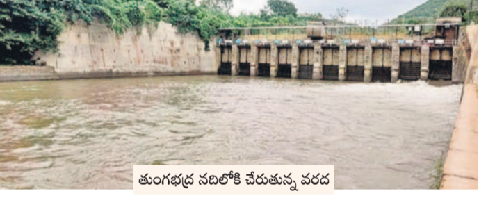
తుంగభద్ర నదిలోకి చేరుతున్న వరద