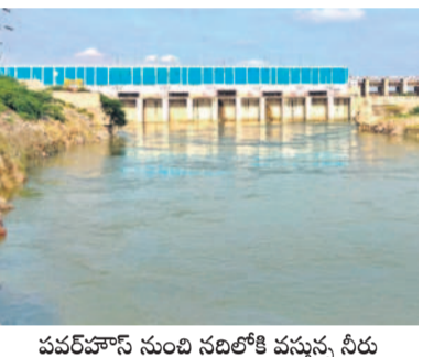
పవనహీన సుందరి నదిలోకి వస్తున్న నీరు

గట్టు, జూలై 21 : నెట్టంపాడు పథకంలో భాగమైన ర్యాలంపాడు బ్యారేజింగ్ రిజర్వాయర్లో ఆదివారం నాటికి 1.30 టీఎంసీల నీటి నిల్వ ఉన్నది. 1,200 క్యూసెక్కుల వరకే ఇన్ ఫ్లోగా ఉంది. ఎడమ కాల్వకు 97 క్యూసెక్కులు, కుడి కాల్వకు 998 క్యూసెక్కుల నీటిని విడుదల చేస్తున్నారు. ర్యాలంపాడు రిజర్వాయర్ నీటి సామర్థ్యం 4 టీఎంసీలు ఉండగా జట్టు బలహీనంగా ఉండడంతో మొత్తంగా 2 టీఎంసీల నీటి నిల్వను మాత్రమే ఉంచుతున్నారు. రిజర్వాయర్ కు నీటిని వదులుకుండడంతో రైతులు ఆనందం వ్యక్తం చేస్తున్నారు. ముండుగా (నారు) తుకం వేసుకున్న రైతులు తమ పొలాల్లో నాట్టు వేసుకోవడానికి సమాయత్తమవుతున్నారు. మరొకవైపు నారు ఎదుగుదల కోసం ఎదురుచూస్తున్నారు. మొత్తమ్మీద నాలుగైదు రోజులుగా కురుస్తున్న వర్షాలతో రైతులు ఆనందంగా ఉన్నారు.