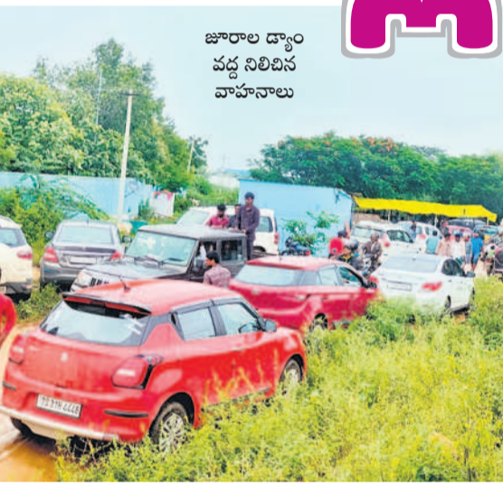
జూరాల డ్యాం వద్ద నిలిచిన వాహనాలు

గద్వాల, జూలై 21 : ఎడతెరిపి లేకుండా కురుస్తున్న వర్షాలతో కర్ణాటకలోని ఆల్పల్లె, నారాయణపూర్ జిల్లాలోని సుందరి వరద నీరు జూరాల ప్రాజెక్టుకు వచ్చి చేరుతుండడంతో కృష్ణమ్మ పరవళ్లు తొక్కుతున్నది. ప్రాజెక్టు అధికారులు జూరాల వద్ద 22 గేట్లు ఎత్తి 84,524 క్యూసెక్కులను దిగువన ఉన్న శ్రీశైల రిజర్వాయర్ కు వదులుతున్నారు. దీంతో మొన్నటివరకు బీమపల్లి వద్ద నీరులేక వెలవెలబోయిన కృష్ణమ్మ నేడు నిండాగా ప్రవహిస్తున్నది. కృష్ణమ్మ పరవళ్లు తిలకించేందుకు ఆదివారం సందర్భంగా జూరాల, బీమపల్లి వద్దకు భారీగా తరలివచ్చారు. ఆదివారం రాత్రి 9 గంటలకు జూరాలలో 1,29,000 క్యూసెక్కుల ఇన్ ఫ్లో నమోదు కాగా, అప్పటివల్ల 1,19,280 క్యూసెక్కులుగా నమోదైంది. జూరాల పూర్తి స్థాయి నీటిమట్టం 318.516 మీటర్లు కాగా ప్రస్తుతం 317.100 మీటర్లుగా ఉన్నది. పూర్తి స్థాయి నీటి నిల్వ 9.657 టీఎంసీలు కాగా.. ప్రస్తుతం 6.914 టీఎంసీలుగా ఉన్నది. ఎగువ, దిగువ జూరాల జలవిద్యుత్ కేంద్రాల్లో విద్యుత్ 11 యూనిట్లలో ఉత్పత్తి కొనసాగుతున్నది. అదేవిధంగా జూరాల ప్రాజెక్టు సుందరి విద్యుత్ ఉత్పత్తికి 30,148, నెట్టంపాడు లిఫ్టుకు 1,500, భీమా లిఫ్ట్-1కు 1,300, భీమా లిఫ్ట్-2కు 750, జూరాల ఎడమ కాల్వకు 870, కుడి కాల్వకు 596, సమాంతర కాల్వకు 300 క్యూసెక్కుల నీటిని విడుదల చేస్తున్నారు. కాగా, నారాయణపూర్ డ్యాం వద్ద 25 గేట్లు ఎత్తి దిగువకు 1,45,750 క్యూసెక్కులు విడుదల చేశారు.