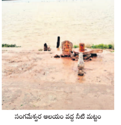
సంగమేశ్వర ఆలయం వద్ద నీటి మట్టం

కొల్లూపూర్, జూలై 21 : కొల్లూపూర్ మండలం సోమశిల వద్ద నవ్వునదుల సంగమముపైన సంగమేశ్వరం వద్ద కృష్ణమ్మ పరవళ్లు తొక్కుతున్నది. తుంగభద్ర, కృష్ణానదికి పెద్ద ఎత్తున వరద వస్తుండడంతో ఆదివారం కృష్ణానది జిల్లా లదితానోమేశ్వర ఆలయం సమీపానికి చేరాయి. అయితే సంగమేశ్వర ఆలయం జలమయం కానుండడంతో ఆరు నెలల వరకు పునఃదర్శనం ఉండదు. ఈ మేరకు శనివారం సాయంత్రం సంగమేశ్వరుడికి ప్రత్యేక పూజలు చేశారు. కృష్ణానదిలో వరద ఉధృతంగా ఉండడంతో సమీప ప్రాంతాల ప్రజలు, మత్స్యగారులు అప్రమత్తంగా ఉండాలని, నదిలోకి వెళ్లొద్దని ఆధికారులు హెచ్చరిస్తున్నారు.