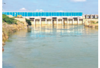
పవనహాసం నుంచి నదిలోకి వస్తున్న నీరు