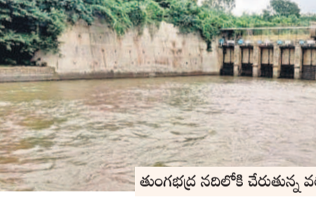
తుంగభద్ర నదిలోకి చేరుతున్న వరద

గద్వాల, జూలై 21 : ఎడతెలిపి లేకుండా కురుస్తున్న వర్షాలతో కర్ణాటకలోని అల్లట్ల, నారాయణపూర్ జిల్లాలోని నుంచి వరద నీరు జూరాల ప్రాజెక్టుకు వచ్చి చేరుతుండడంతో కృష్ణమ్మ పరవళ్లు తొక్కుతున్నది. ప్రాజెక్టు ఆధికారులు జూరాల వద్ద 22 గేట్ల ఎత్తి 84,524 క్యూసెక్కులను దిగువకు ఉన్న శ్రీశైలం రిజర్వాయర్ కు వదులుతున్నారు. దీంతో మొన్నటివరకు బీవీపల్లి వద్ద నీరులేక వెలవెలబోయిన కృష్ణమ్మ నేడు నిండాగా ప్రవహిస్తున్నది. కృష్ణమ్మ పరవళ్లు తిలకించేందుకు ఆదివారం సందర్భకులు జూరాల, బీవీపల్లి వద్దకు భారీగా తరలివచ్చారు. ఆదివారం రాత్రి 9 గంటలకు జూరాలలో 1,29,000 క్యూసెక్కుల ఇన్ఫ్లో నమోదు కాగా, అప్పటివల్ల 1,19,280 క్యూసెక్కులుగా నమోదైంది. జూరాల పూర్తి స్థాయి నీటిమట్టం 318.516 మీటర్లు కాగా ప్రస్తుతం 317.100 మీటర్లుగా ఉన్నది. పూర్తి స్థాయి నీటి నిల్వ 9.657 టీఎంసీలు కాగా.. ప్రస్తుతం 6.914 టీఎంసీలుగా ఉన్నది. ఎగువ, దిగువ జూరాల జలవిద్యుత్ కేంద్రాల్లో విద్యుత్ 11