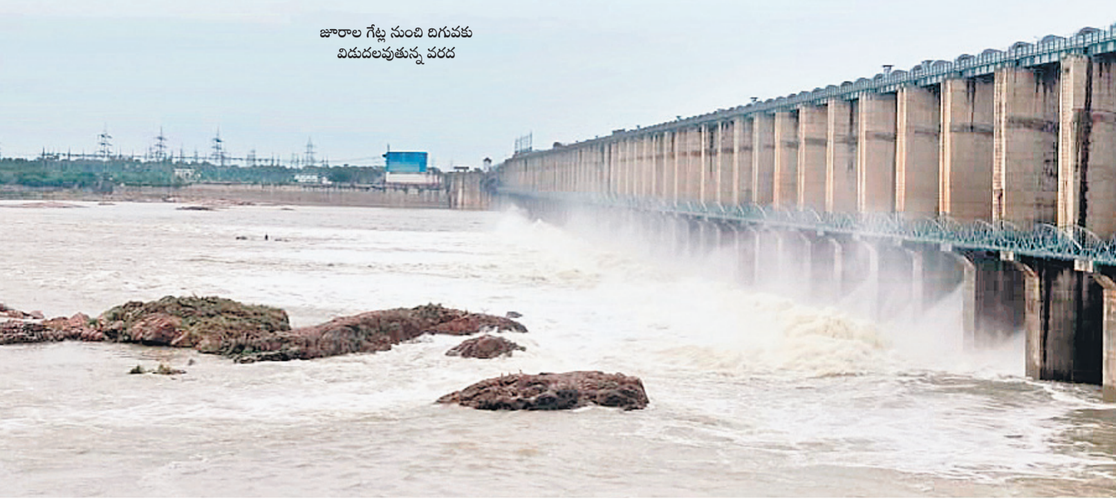
జూరాల గేట్ల నుంచి విడుదలవుతున్న వరద

● 1,200 క్యూసెక్కుల ఇన్ఫ్లో ● కుడి, ఎడమ కాల్వకు కొనసాగుతున్న ప్రవాహం గట్టు, జూలై 21 : నెట్టంపాడు పథకంలో భాగమైన ర్యాలంపాడు బ్యారేజింగ్ రిజర్వాయర్లో ఆదివారం నాటికి 1.30 టీఎంసీల నీటి నిల్వ ఉన్నది. 1,200 క్యూసెక్కుల వరకు ఇన్ఫ్లోగా ఉంది. ఎడమ కాల్వకు 97 క్యూసెక్కులు, కుడి కాల్వకు 998 క్యూసెక్కుల నీటిని విడుదల చేస్తున్నారు. ర్యాలంపాడు రిజర్వాయర్ నీటి సామర్థ్యం 4 టీఎంసీలు ఉండగా జట్టు బలహీనంగా ఉండడంతో మొత్తం 2 టీఎంసీల నీటి నిల్వను మాత్రమే ఉంచవచ్చన్నారు. రిజర్వాయర్ కు నీటిని వదులుకుండడంకోసం రైతులు ఆనందం వ్యక్తం చేస్తున్నారు. ముందుగా (నారు) తుకం వేసుకున్న రైతులు తమ పాలాల్లో నాట్టు వేసుకోవడానికి సమాధివృక్షాలు వేస్తున్నారు. మరొకవంతు మాత్రం నారు ఎదుగుదల కోసం ఎదురుచూస్తున్నారు. మొత్తమ్మీద నాలుగైదు రోజులుగా కురుస్తున్న వర్షాలతో రైతులు ఆనందంగా ఉన్నారు.