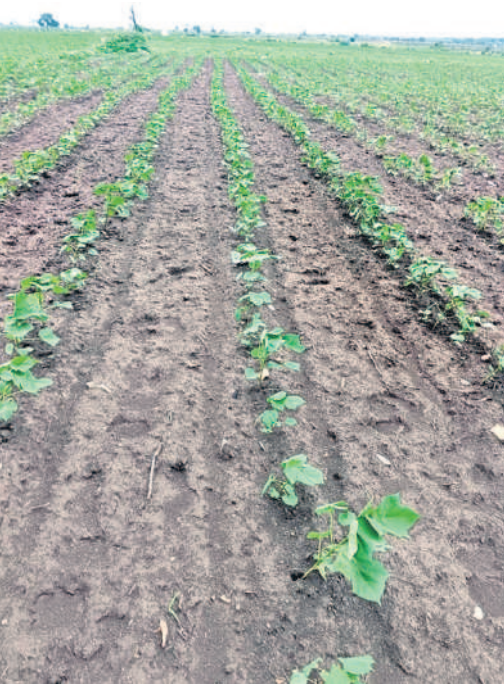
మేళ్లచెర్లులో తోకలూడుతున్న పత్తివేసే

సూర్యాపేట, జూలై 21 (నమస్తే తెలంగాణ) : బంగాళాఖాతంలో ఏర్పడిన వాయుగుండం కారణంగా కురుస్తున్న వర్షానికి ఎండుముఖం పట్టిన పత్తి, వేరు శనగ, కంది తదితర ఆరుతడి పంటలకు ప్రాణం పోసినట్లయ్యింది. వరి వేసే రైతులకు ఊరట కలిగింది. వర్షాభావ పరిస్థితులతో ఇన్నాళ్లు నడుల్లో వీళ్లు లేకపోవడం, బోధ్య, బావులు అడుగంటి పోవడంతో వానల కోసం ఎదురు చూస్తున్న రైతాంగానికి ఈ వర్షం మేలు చేసేలా ఉన్నది. ఇప్పటికే వరి నార్డు పోసిన రైతులు నాట్లు వేసేందుకు సిద్ధమవుతున్నారు. ఈ వానకాలంలో భారీ వర్షాలు లేకపోవడంతో సీజన్ ప్రారంభమై నెల దాటినా జిల్లాలో దాదాపు 80 శాతం చెరువులు, కుంటలు నీళ్లు లేక ఖాళీగానే దర్భ సమిష్టమయ్యాయి. రెండు రోజులుగా కురుస్తున్న వర్షం కూడా ఓ మోస్తరు తప్ప భారీగా లేదు. రానున్న రోజుల్లో భారీ వర్షాలు కురవేనే వరి పంటలు వండే అవకాశాలు ఉన్నాయి. ప్రస్తుత వర్షాలతో సూర్యాపేట జిల్లాలో 82,653 ఆరుతడి పంటలకు ఊతం వచ్చినట్లుయ్యింది.