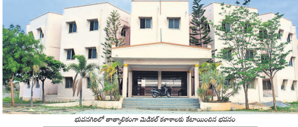
భువనగిరిలో తాత్కాలికంగా మెడికల్ కళాశాలకు తేటాయించిన భవనం

యాదాద్రి భువనగిరి జిల్లాకు మంజూరైన మెడికల్ కాలేజీ ఈ విద్యా సంవత్సరం ప్రారంభమవుతుందా..? వచ్చే క్రాస్సెంగిలో జాబితాలో మన కాలేజీ ఉంటుందా..? అనేది స్పష్టత రావడం లేదు. ఈ ఏడాది కాలేజీ ప్రారంభంపై సందిగ్ధత నెలకొంది. మెడికల్ కాలేజీకి అనుమతి రాకపోవడంతో ఏర్పాటుపై సీనియర్లు కమ్ముకున్నారు. అధికారులు మాత్రం అప్పీలుకు వెళ్లినట్లు చెబుతున్నారు. ఇక ప్రభుత్వ వివే, ఆలేరు ఎమ్మెల్యే బిర్ల బలయ్య మాత్రం కాలేజీ అంతాని పట్టించుకోవడం లేదనే ఆరోపణలు వినిపిస్తున్నాయి.