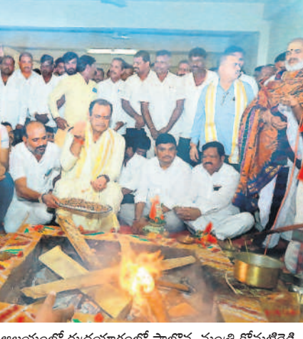
వేలగోపాలస్వామి అలయంలో రుద్రయోగంలో పాల్గొన్న మంత్రి కోమటిరెడ్డి