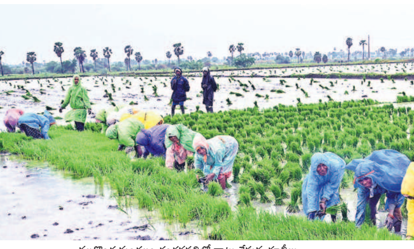
నల్లగొండ మండలం చందనపల్లిలో నాట్లు వేస్తున్న కూలీలు

జూనియర్ కురువార్షిని విజృంభింపజేస్తే.. దాదాపు ఏడేండ్ల తర్వాత రైతులకు కష్టం దాపురించింది. వర్షాలు లేకపోవడంతో జిల్లాకు ఇరు పక్కల గోదావరి, కృష్ణా జిల్లాలు రాకపోవడంతో ఈ ఏడాది వ్యవసాయం సజావుగా సాగడం లేదు. జూన్ మాసంలో చిరుజల్లులు మాత్రమే