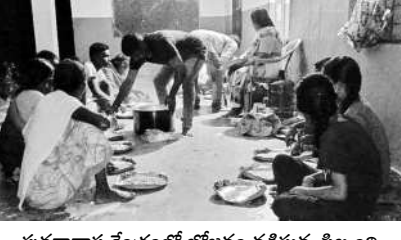
పునరావాస కేంద్రంలో భోజనం వడ్లకొండ నిజాం

ముంగపేట, జూలై 21 : ములుగు జిల్లా మంగపేట మండలం మారుమూల గ్రామాల సర్పంచిసాగర్ లో శిధిలావస్థకు చేరిన ఐదే గిద్దవర గిద్దవర నివసస్థానం 13 కుటుంబాలలోని 21 మందిని ఆదివారం రాత్రి అధికారులు స్థానిక పాఠశాలలో ఏర్పాటు చేసిన పునరావాస కేంద్రానికి తరలింపారు. మూడు రోజులుగా కురుమేపల్లి వరకాల వారు నివసిస్తున్న గదులు దెబ్బతిన్నాయి. ఉన్నతాధికారుల ఆదేశాల మేరకు వారిని పునరావాస కేంద్రానికి తరలించి తగిన ఏర్పాట్లు చేసినట్లు తహసీల్దార్ పేర్కొన్నారు.