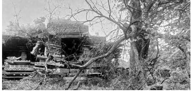
రామప్ప సరస్వతి వద్ద గల ఆలయం ముందు విరిగిపడిన చెట్టు

నారాచమని, దీనితోడూ ప్రభుత్వం మార్కెట్ లేటు కూడా ఇప్పటివరకు సర్కారు నిర్వహించిన ధర చెల్లిస్తామన దాన్ని వ్యతిరేకిస్తున్నారు. ప్రభుత్వం చెల్లిస్తామంటున్న ధర, రైతులు అడుగుతున్న ధర నడుమ వ్యత్యాసం ఎక్కువగా ఉండటం వల్ల జిల్లాలో గ్రీన్ఫీల్డ్ కారిడార్ నిర్మాణం కోసం భూసేకరణ ముందుకు సాగడం లేదు. ఈ రోడ్డు నిర్మాణానికి ఇప్పటివరకు అధికారులు అవార్డు పాస్ చేసిన 154.64 హెక్టార్ల భూముల రైతులకు చెల్లించేందుకు ప్రభుత్వం జిల్లాకు సుమారు రూ.60.15కోట్లకుపైగా నిధులు కేటాయించింది. ప్రభుత్వం నిర్వహించిన ధర ప్రకారం పరిహారం తీసుకోవడానికి సంబంధిత రైతులు ముందుకు రాకపోవడంతో సుమారు రూ.49.81 కోట్లు నిల్వ ఉండిపోయాయి. ముఖ్యమంత్రి ఆదేశాలతో కొద్దిలో జరిగింది అధికారులు గ్రీన్ఫీల్డ్ కారిడార్ నిర్మాణం కోసం ఇప్పటికే సేకరించిన భూముల రైతులకు నష్టజిప్పి వారు పరిహారం తీసుకునేలా ప్రయత్నిస్తున్నారు. భూములను కోల్పోతున్న రైతులలో అత్యధిక మంది మాత్రం తమ భూములను ఎట్టి పరిస్థితుల్లోనూ ఇవ్వబోమని తేల్చి చెబు తున్నట్లు తెలిసింది. దీంతో భూసేకరణ సమస్యను పరిష్కరించడం అధికారులకు ఇప్పుడు పరిష్కార మార్గం. రైతులకు నష్టజిప్పి తప్ప... కష్టమే, ఆర్థివో గ్రీన్ఫీల్డ్ కారిడార్ నిర్మాణంలో భూములు కోల్పోతున్న రైతులకు తోడ్పడటం. భూమి ఇచ్చేలా వారికి నష్ట జిప్పి ప్రయత్నం చేస్తున్నాం. ప్రస్తుతం ప్రభుత్వం నిర్వహించిన ధర ప్రకారం పరిహారం తీసుకున్న రైతులకు తర్వాత నష్ట 64 కింద పరిహారం వచ్చింది అవకాశం ఉంటుంది. పరిహారం తీసుకోవడానికి కొందరు రైతులు ముందుకొస్తున్నారు.