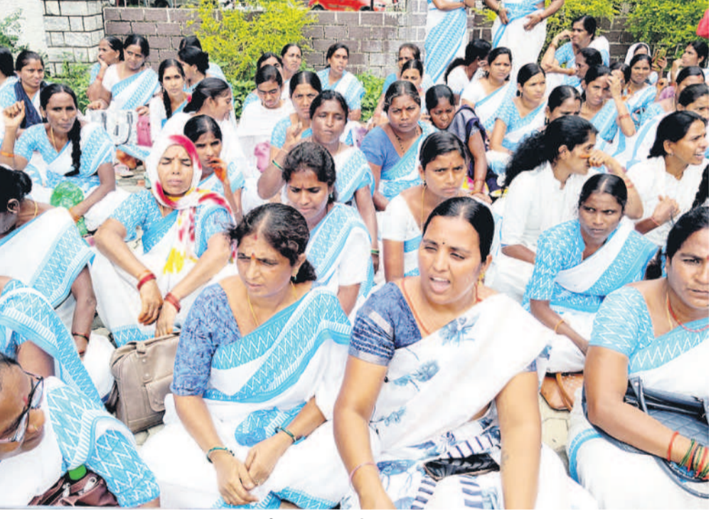
నిర్మల్ కలెక్టర్ కి ఎదుట ధర్మా చేస్తున్న ఆశ కార్యకర్తలు