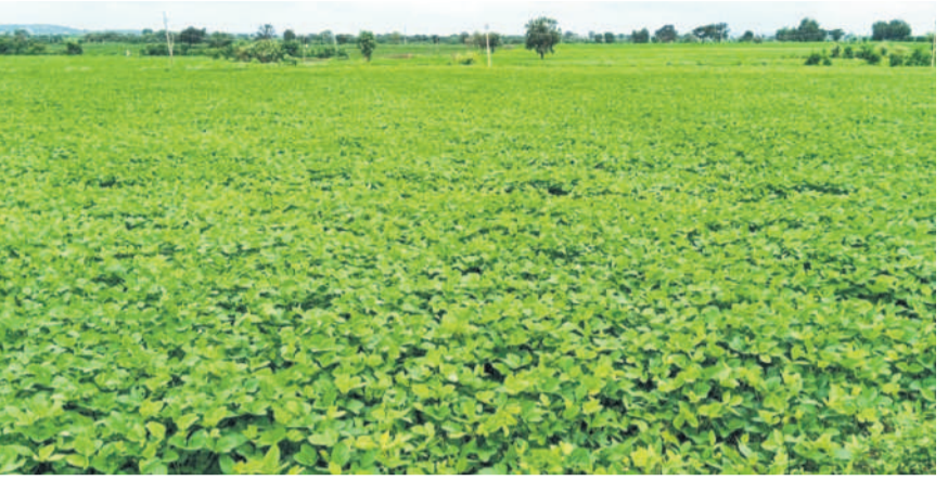
బైంసా మండలం ఖత్ గాం లో పచ్చదనాన్ని పట్టుకున్న సోయా

జిల్లాలో 784 చెరువులు ఉండగా, వీటి పరిధిలో 71,832 ఎకరాల్లో పరి సాగుతున్నది. ఇప్పటి వరకు ఆయా చెరువులు కేవలం 20-30 శాతం మాత్రమే నిండాయిన అధికారులు చెబుతున్నారు. రాబోయే రోజుల్లో భారీ వర్షాలు కురిస్తేనే చెరువుల కింద పరి చందే అవకాశాలు ఉన్నాయి. కడెం, స్వర్ణ ప్రాజెక్టులు నిండడంతో ఆయా ప్రాజెక్టుల కింద పరి సాగుకు ధోకా లేదు.