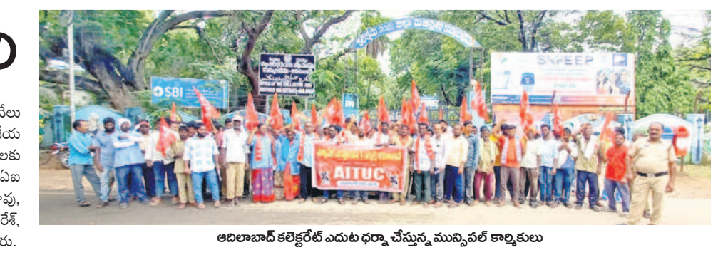
అదిలాబాద్ కలెక్టర్ కి ఎదుట ధర్మా చేస్తున్న మున్సిపల్ కార్మికులు

అదిలాబాద్ కలెక్టర్ కి ఎదుట ఆశ కార్యకర్తల నిరసన ఎదులాపురం, జూలై 22 : ఆశ కార్యకర్తలు దీర్ఘకాలంగా ఎదుర్కొంటున్న సమస్యలపై అసెంబ్లీ బడ్జెట్ సమావేశాల్లో అతిగా ప్రవేశపెట్టి, సమస్యల పరిష్కారం రానికే మార్గం చూపాలని సీనియర్ జిల్లా కార్యదర్శి అన్నమలై కిరణ్ డిమాండ్ చేశారు. సోమవారం రాష్ట్ర కమిటీ వీలువు మేరకు కలెక్టర్ కి ఎదుట ధర్మా చేస్తున్న ఆశ కార్యకర్తలు నిరసన