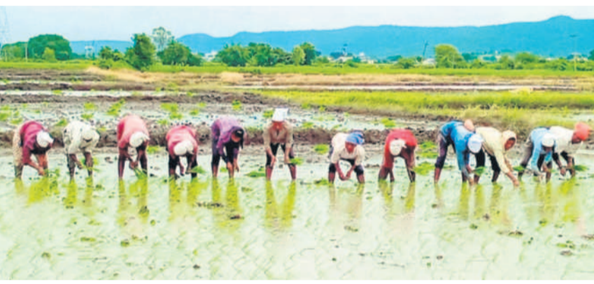
సారంగాపూర్ మండలం జాం గ్రామంలో నాల్గ వేస్తున్న కూలీలు

చేశారు. సీజన్ ప్రారంభంలో కురిసిన వర్షాలకు విత్తనాలు మొలకెత్తగా.. ఆ తర్వాత వానలు ముఖం చాటేయడంతో పత్తి, సోయా, మక్క ఎండిపోయే పరిస్థితి నెలకున్నది. ఈ క్రమంలోనే కురిసిన భారీ వర్షాలు ఆరుతడి పంటలతో పాటు, పరి వేసి రైతులకు ఊరట కలిగించాయి. ఇప్పటికే చాలా చోట్ల నాల్గ పోసిన రైతులు నాల్గ వేసేందుకు సిద్ధమవుతున్నారు. ఈ సీజన్ లో 1.35 లక్షల ఎకరాల్లో పరి సాగుతున్నందున అధికారులు అంచనా వేశారు. ప్రస్తుతం కురిసిన వానలతో చెరువుల్లోకి పెద్దగా వరద నీరు చేరలేదు.