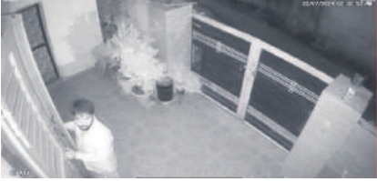
సీసీ కెమెరాలో లాకప్ అయిన దొంగ కదలికలు