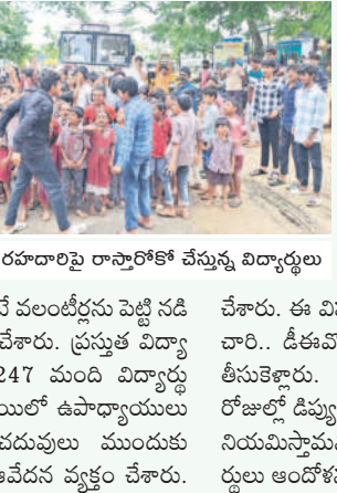
పాఠశాలలో ప్రధాన రహదారిపై రాస్తారోకో చేస్తున్న విద్యార్థులు