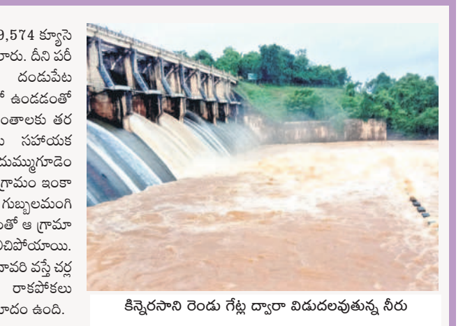
కిన్నెరసాని రెండు గేట్ల ద్వారా విడుదలవుతున్న నీరు

నిండిన ప్రాజెక్టులు.. కిన్నెరసాని పూర్తిస్థాయి నీటిమట్టం 407 అడుగులకు గాను ప్రస్తుతం 402.8 అడుగుల మేర నీటితో నిండి ఉంది. 14 వేల క్యూసెక్కులు ఇన్ ఫో ఉండగా.. రెండు గేట్లు తెరిచి 6 వేల క్యూసెక్కులను దిగువకు వదిలారు. కిన్నెరసాని వాగులోకి కూడా భారీగా వరద రావడంతో లోతట్టు ప్రాంతాలకు నీరు చేరింది. తాలిపేరు ప్రాజెక్టు నుంచి మూడు రోజులుగా మొత్తం 25 గేట్లను ఎత్తి పూర్తి స్థాయి నీటిని కిందకు వదులుతున్నారు. ఈ ప్రాజెక్టు పూర్తిస్థాయి 74 మీటర్ల వద్ద కాగా.. ప్రస్తుతం 70.74 మీటర్ల వద్ద ఉంది. తాలిపేరు నుంచి 49,574 క్యూసెక్కుల నీటిని దిగువకు వదిలారు. దీని పరివాహకంలోని కొత్తపల్లి, దండుపేట గ్రామాలు జలదిగ్బంధంలో ఉండడంతో బాధితులను సురక్షిత ప్రాంతాలకు తరలించేందుకు అధికారులు సహాయక చర్యలు చేపడుతున్నారు. దుమ్ముగూడెం మండలంలో సున్నంబట్టి గ్రామం ఇంకా జలదిగ్బంధంలోనే ఉంది. గుబ్బలమంచి వాగు పొంగి ప్రవహించడంతో ఆ గ్రామానికి రాకపోకలు పూర్తిగా నిలిచిపోయాయి. రాత్రికి 51 అడుగులకు గోదావరి వస్తే చచ్చునుంది భద్రాచలం వైపు రాకపోకలు పూర్తిగా బంద్ అయ్యే ప్రమాదం ఉంది.