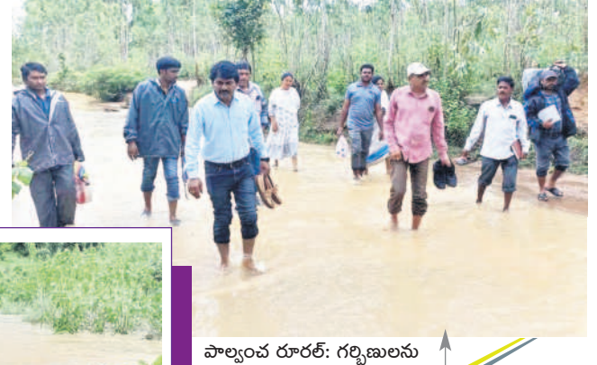
పాల్గొన్న వారు: గల్లిబులను తీసుకొచ్చేందుకు వారు దాటి వెళ్తున్న వైకాపా కార్యకర్తలు