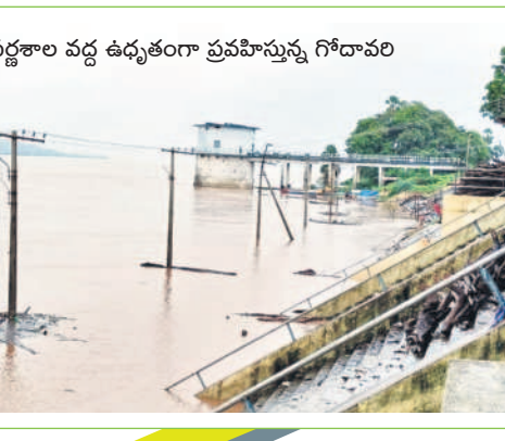
భద్రాచలం వద్ద గోదావరి వరద ప్రవాహం