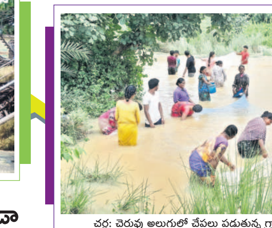
చచ్చ: చెరువు అలుగులో చేపలు పడుతున్న గ్రామస్థులు