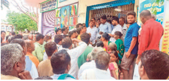
లక్షలోపు రుణమున్నా తమకు మాఫీ జరగలేదని ఆరోపిస్తూ సోమవారం నిర్భర జిల్లా పోస్టల్ బ్యాంక్ ఆఫ్ మహారాష్ట్ర శాఖ ఎదుట ఆందోళనకు దిగిన రైతులు