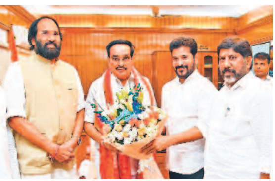
మాన్ ప్రాజెక్టుకు నిధుల కేటాయింపుపై కేంద్ర జిల్లా మంత్రి సీఆర్ పోలిట్ ను కలిసిన సీఎం రేవంత్, డిప్యూటీ సీఎం భట్టి, మంత్రి ఉత్తమ్