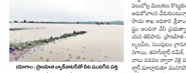
దహాగాం : ప్రాణహిత బ్యాక్ వాటర్లో నీట మునిగిన పత్తి

దహాగాం/నెన్నెల/వేమనపల్లి/కోటపల్లి, జూలై 22 : ఆసిఫాబాద్, మంచీర్యాల జిల్లాల్లో నాలుగు రోజులుగా కురిసిన వర్షాలకు వరద ముంచెత్తుతున్నది. నదులు, ప్రాజెక్టులు, వాగులు.. పంటలు ఉప్పొంగి ప్రవహిస్తుండగా, పరివాహక ప్రాంతాల్లోని పంటలు నీట మునిగాయి. దహాగాం మండలంలో ప్రాణహిత, పెద్దవాగు బ్యాక్ వాటర్లో రావుపల్లి, మొట్టగూడ, రాంపూర్, దిగడ గ్రామాల్లో సుమారు వెయ్యి ఎకరాల పత్తి నీట మునిగి రైతులు తీవ్రంగా నష్టపోతున్నారు. మంచీర్యాల జిల్లా