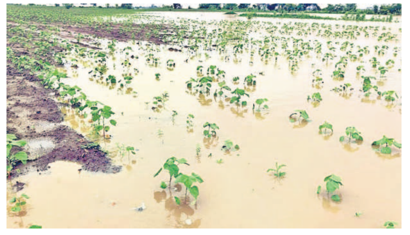
కోటపల్లి : వెంచపల్లి గ్రామం సమీపంలో ప్రాణహిత నది ప్రవాహంతో నీట మునిగిన పత్తి పంట