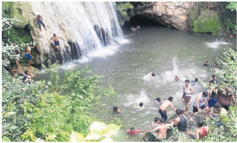
మాదార జలపాతం వద్ద యువకుల సందడి