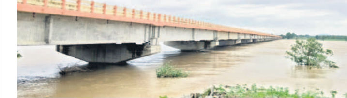
చింతలమానేపల్లి : గూడెం లంతర్వాహి వంతెన వద్ద ప్రమాదకరంగా ప్రాణహిత నది