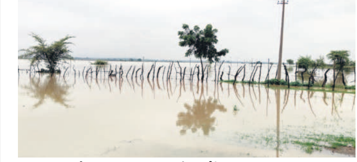
కోటపల్లి : ఆలుగామ గ్రామం సమీపంలోకి వచ్చిన ప్రాణహిత వరద

● వేలాది ఎకరాల్లో నీటమునిగిన పంటలు ● రైతులకు తీరని నష్టం ● పరిశీలించిన అధికారులు