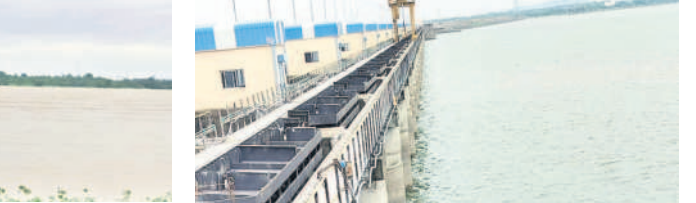
ఎల్లంపల్లి ప్రాజెక్టు నీటి మట్టం