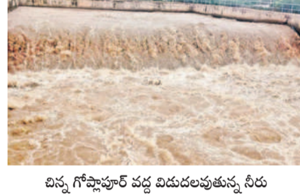
చిన్న గోష్టాపూర్ వద్ద విడుదలవుతున్న నీరు

ట్లు ఎత్తి వరద నీటిని దిగువకు విడుదల చేశారు. టీటీ డ్యాంకు రాత్రి ఇన్ఫ్లో పెరిగితే మర్నె గేట్లు ఎత్తి నీటిని దిగువకు విడుదల చేసే అవకాశం ఉందని చెప్పారు. నడితీర ప్రాంత ప్రజలు అప్రమత్తంగా ఉండాలని టీటీ బోర్డు ప్రమాద హెచ్చరికలు జారీ చేసింది. టీటీ డ్యాం నుంచి ఆర్డీఎస్ ఆన కట్టకు బుడవారం వరద నీరు చేరుకుంటుందని, అక్కడ నుంచి సుంకంపేట మీదుగా, శ్రీశైలం ప్రాజెక్టుకు తుంగభద్ర జలాల చేరుకుంటాయని ఆర్డీఎస్ ఏక రాందాని తెలిపారు. శ్రీశైలానికి తెలివైన డ్యాం ఇన్ఫ్లో. శ్రీశైలం, జూలై 22 : శ్రీశైలం జలాశయానికి వరద క్రమ క్రమాంగా పెరుగుతున్నది. ఎగువన జూలై ప్రాజెక్టు నుంచి నీటి విడుదల జరుగగా.. సోమవారం రాత్రికి శ్రీశైలం డ్యాంకు 1,10,304 క్యూసెక్కుల ఇన్ఫ్లో వస్తున్నట్లు అధికారులు తెలిపారు. ప్రస్తుత నీటినిల్వ 833.60 అడుగులు ఉండగా.. సామర్థ్యం 215 టీఎంసీలుగానూ ప్రాజెక్టులో 53.3713 టీఎంసీలు నిల్వ ఉన్నాయి. ఏపీ, టీఎంసీ పవర్ హోస్టల్లో విద్యుదుత్పత్తి ప్రారంభం కాలేదు. కొనసాగుతున్న వంపి. మళ్ళీ, జూలై 22 : కృష్ణానదికి భారీ వరద వస్తున్న నేపథ్యంలో టీమా ఫేజ్-1లో అంతర్భాగమైన చిల్లం నర్సరెడ్డి (సంగంబండ్), భూత్పూర్ రిజర్వాయర్లకు పంపిణీ కోసం సాగుతున్నది. మళ్ళీ మండలం చిన్నగోష్టాపూర్ వద్ద భీమా ఫేజ్-1 స్టేజీ-1 పంపిణీ నుంచి 1300 క్యూసెక్కుల నీటిని రెండు మోటర్ల ద్వారా పంపించి చేస్తున్నారు. వీటి నుంచి భూత్పూర్ రిజర్వాయర్కు 500 క్యూసెక్కులు, చిల్లం నర్సరెడ్డి బ్యాంకెస్కి రిజర్వాయర్కు 800 క్యూసెక్కుల నీటిని పంపించి చేస్తున్నారు. చిల్లం నర్సరెడ్డి బ్యాంకెస్కి రిజర్వాయర్