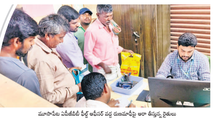
మూసాపేట ఏపీజీవీబీ ఫీల్డ్ ఆఫీసర్ వద్ద రుణమాఫీపై ఆరా తీస్తున్న రైతులు