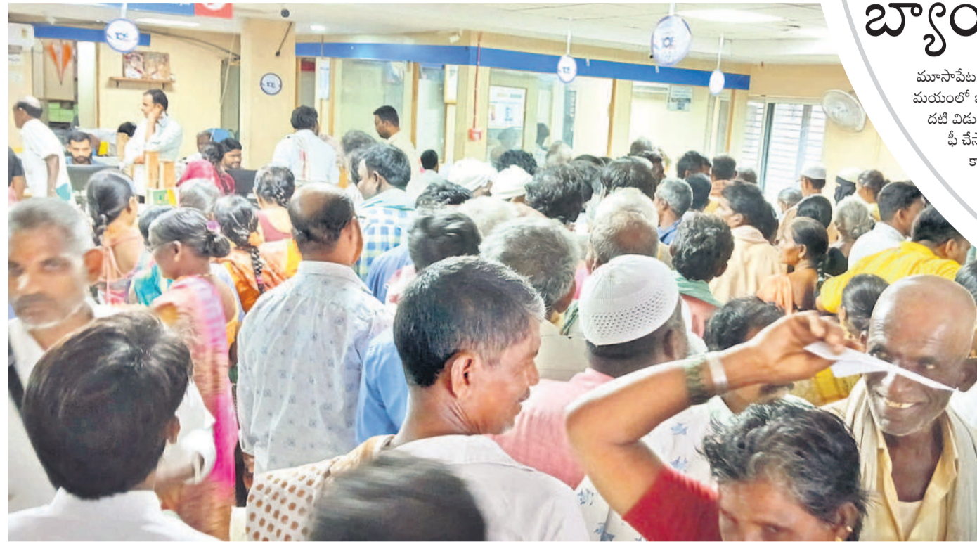
వివరాల కోసం వచ్చిన రైతులతో కిటికీలాడుతున్న గద్దాల యూనియన్ బ్యాంకు