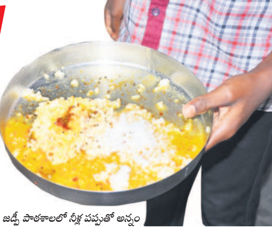
తాటిపల్లి జిల్లా పాఠశాలలో నీళ్ల పప్పుతో అన్నం