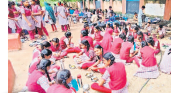
కోర్కూ సూల్లో భోజనం చేస్తున్న పిల్లలు

జగిత్యాల, జూలై 22 (నమస్తే తెలంగాణ) : విద్యా హక్కు చట్టం 2013 ప్రకారం 8వ తరగతి వరకు కేంద్ర ప్రభుత్వం ఉచితంగా బియ్యం పంపిణీ చేస్తుండగా, రాష్ట్ర ప్రభుత్వం పిల్లలకు కూరగాయలు, ఇతర పోషకాహారానికి నిధులు ఇస్తున్నది. ఇక 9,10వ తరగతి గిరిజిల్లాలకు బియ్యంతోపాటు కూరగాయలు, పోషకాహారం అంతా రాష్ట్ర ప్రభుత్వమే అందజేస్తూ వస్తున్నది. రాష్ట్ర ప్రభుత్వం నిర్దేశించిన మెనూ చాలా అద్భుతంగా కనిపిస్తున్నా జగిత్యాల జిల్లాలో ఎక్కడా ఇది అమలు కావడం లేదు. జిల్లాలో 515 ప్రాథమిక పాఠశాలలు, 84 ప్రాథమికోన్నత పాఠశాలలు, 184 ఉన్నత పాఠశాలలో మొత్తం 55,927 మంది విద్యార్థులను చేస్తుండగా, వీరందరికీ ప్రతి రోజూ మధ్యాహ్న భోజనం సిద్ధం చేసి పట్టిస్తున్నారు. అయితే దాదాపుగా ఒక పాఠశాలలో నీళ్ల చారు.. సాంబార్.. ఎప్పుడైనా ఒకసారి కూరగాయల భోజనం అందజేస్తున్నారు. పెరిగిన ధరల నేపథ్యంలో ఎక్కడా కూరగాయలు, ఆకు కూరలు వందడం లేదు. కేవల సారకాయలు, బెండకాయల వంటివి కొన్ని చేసి, కొంత పప్పు వేసి సాంబార్ చేసి పట్టిస్తున్నారు. మెనూ తో సంబంధం లేకుండా ఎక్కడ చూసినా ఇలానే భోజనం అందిస్తున్నారు. ఇక వారానికి మూడు సార్లు కోడిగుడ్డు పెట్టాలి ఉన్నా.. వారానికి ఒక్కరోజే పెడుతున్నారు. మిగిలిన రోజుల్లో పట్టించడం లేదు. వెజిటేబుల్ బిర్యానీ, కూరగాయల కూర, ఆకు కూరలు దాదాపు పట్టించడం లేదు.