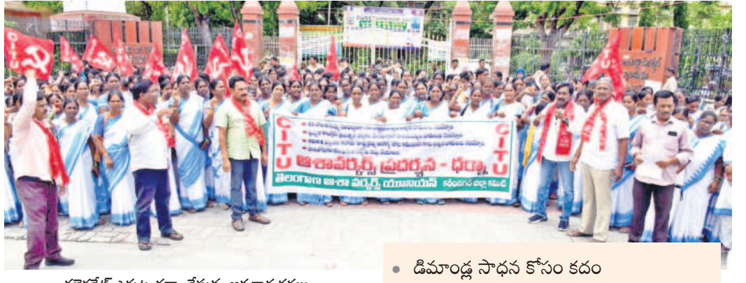
కలెక్టరేట్ ఎదుట ధర్నా చేస్తున్న ఆశ కార్యకర్తలు

మధ్యాహ్న భోజన కార్మికులకు ఏడు నెలలుగా బిల్లులు మంజూరు కాలేదు. ఇటీవలే ప్రభుత్వం జగిత్యాల జిల్లాకు ₹1,48,84,500 మంజూరు చేయగా, 1,475 మంది మధ్యాహ్న భోజన కార్మికులకు కొంత చెల్లింపారు. ఐదో తరగతి వరకు ఉన్న పాఠశాలల్లో వంట చేస్తున్న వారికి భోజన తయారీ ఖర్చులతో పాటు కోడిగుడ్డు బిల్లులను ఈ యేడాది జనవరి వరకు చెల్లింపారు. అలాగే ప్రాథమికోన్నత, ఉన్నత పాఠశాలల్లో వంట తయారీదారులకు బిల్లులు, కోడిగుడ్డు బిల్లులు ఇచ్చారు. అలాగే, గౌరవ వేతనాన్ని సైతం జనవరిలో చెల్లించినట్లు మధ్యాహ్న భోజన కార్మికులు ప్రకటించారు. అయితే ఫిబ్రవరి, మార్చి, ఏప్రిల్, జూన్లకు సంబంధించిన భోజన తయారీ బిల్లులు, గౌరవ వేతనం రాలేదు.