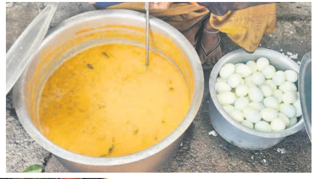
కోడిమ్యాల హైస్కూల్లో పప్పు, కోడిగుడ్డు

'నీళ్లచారు.. ఉడికి ఉడకని అన్నం' ఇది మెజార్లీ సర్కారు పాఠశాలల్లో పెడుతున్న మధ్యాహ్న భోజనం! జగిత్యాల జిల్లాలో క్షేత్రస్థాయిలో చూస్తే.. పోషకాహారం దేవుడెరుగు, కనీసం చిక్కటిపప్పు అన్నం అందడం లేదు. ఇక కూరగాయలు, ఆకుకూరలు, సాంబారుతో రుచికరమైన భోజనం అందిస్తున్నామని గొప్పలు చెబుతున్నా.. ఎక్కడా మెనూ కానరావడం లేదు. వారానికి మూడు గుడ్లు ఇవ్వాలి ఉండగా.. ఒక్కటికి మించి ఇవ్వడం లేదు. ఇదేంటని భోజన కార్మికులను అడిగితే.. సర్కారు ఇచ్చే పైసలతో పప్పు, కూరగాయలు కొనే పరిస్థితి లేదని, బిల్లులు కూడా రావడం లేదని.. ఇలా ఎలా వందలంటున్నా వైఖరిని గుర్తుంచుకున్నా. కనీసం గౌరవ పాలిటోషిక ఇవ్వలేదని.. సిలిండర్లు రావడం లేదని, ఏడు నెలలుగా చెల్లింపులే లేవని.. ఇక తమ బతుకులు ఎలా గడిచేదని అవేదన చెందుతున్నారు.