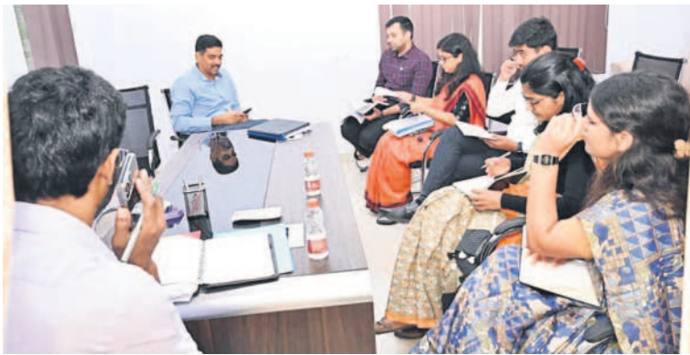
అభివృద్ధి పనులపై కలెక్టర్తో సమీక్షిస్తున్న మజిలీరాజ్