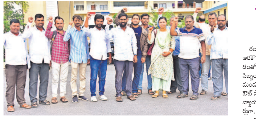
కలెక్టరేట్ ఎదుట నినాదాలు చేస్తున్న మోడల్ సూక్ష్మ ఔట్ సోర్సింగ్ సిబ్బంది

మోడల్ సూక్ష్మ ఔట్ సోర్సింగ్ సిబ్బందికి నెలవారీ తరబడిగా అందని వేతనాలు కలెక్టర్, జాయింట్ కలెక్టర్లకు వినతులు రంగారెడ్డి, జూలై 22(నమస్తే తెలంగాణ) : వచ్చేవి ఆరకొర వేతనాలు.. అదీ నెలవారీ తరబడిగా రాకపోవడంతో మోడల్ సూక్ష్మలో ఓసిసోర్సింగ్ ఔట్ సోర్సింగ్ సిబ్బంది ఆర్థికంగా ఇబ్బందులు పడుతున్నారు. ప్రతి మండలంలో ఒక మోడల్ సూక్ష్మను ఏర్పాటు చేయగా ఔట్ సోర్సింగ్ జిల్లాలో సుమారుగా 64 మంది వ్యాయామ ఉపాధ్యాయులుగా, కంప్యూటర్ ఆపరేటర్లుగా, సూట్ సబాద్దినేటర్లుగా పనిచేస్తున్నారు. వ్యాయామ ఉపాధ్యాయులకు నెలకు రూ.22,750, కంప్యూటర్ ఆపరేటర్లకు రూ.19,500, సూట్ సబాద్దినే