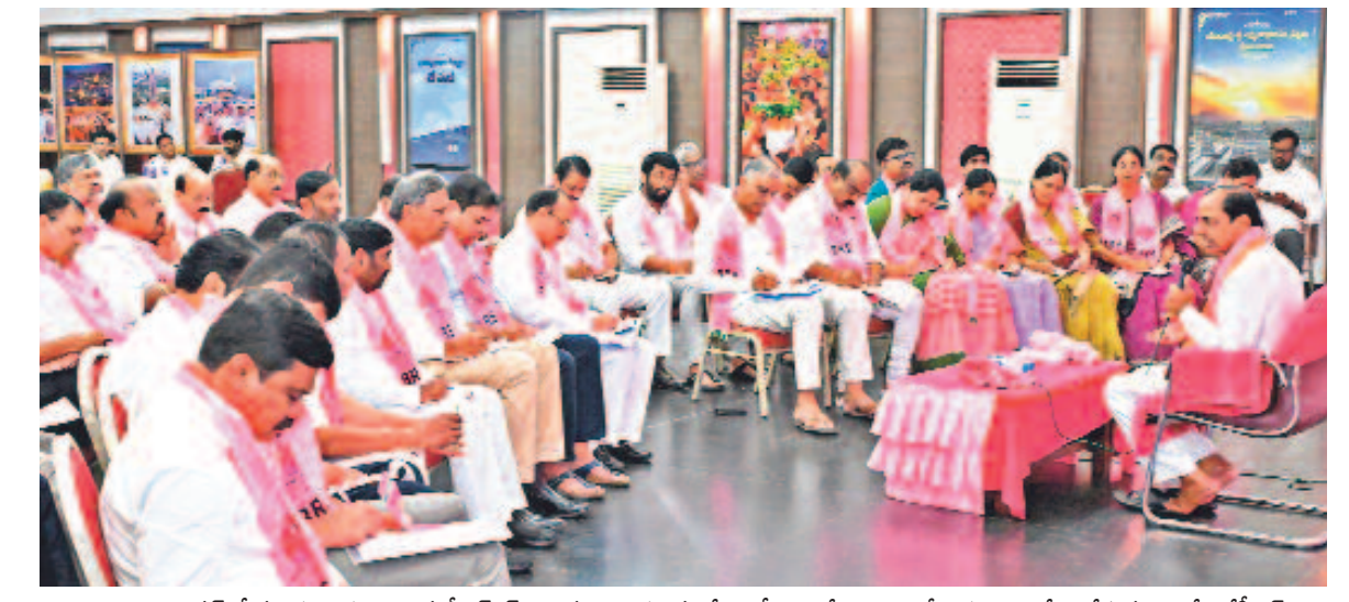
తెలంగాణభవన్ లో మంగళవారం జరిగిన బీఆర్ఎస్ శాసనసభాపక్ష సమావేశంలో ఎమ్మెల్యేలు, ఎమ్మెల్సీలకు దిశానిర్దేశం చేస్తున్న అధినేత కేసీఆర్

సభలో సంతాప తీర్మానం ప్రవేశపెట్టిన సీఎం రేవంత్ లాస్య కుటుంబానికి అండగా ఉంటాం: కేటీఆర్ సభ రేపటికి వాయిదా 31 వరకే అసెంబ్లీ సెషన్ 25న రాష్ట్ర బడ్జెట్.. > 11 నాలుగు రోజులు చర్చ