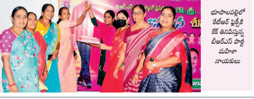
భూపాలపల్లిలో కేటీఆర్ ఫ్లెక్సిటి కేక్ కట్టించుకున్న బీఆర్ఎస్ పార్టీ మహిళా నాయకులు