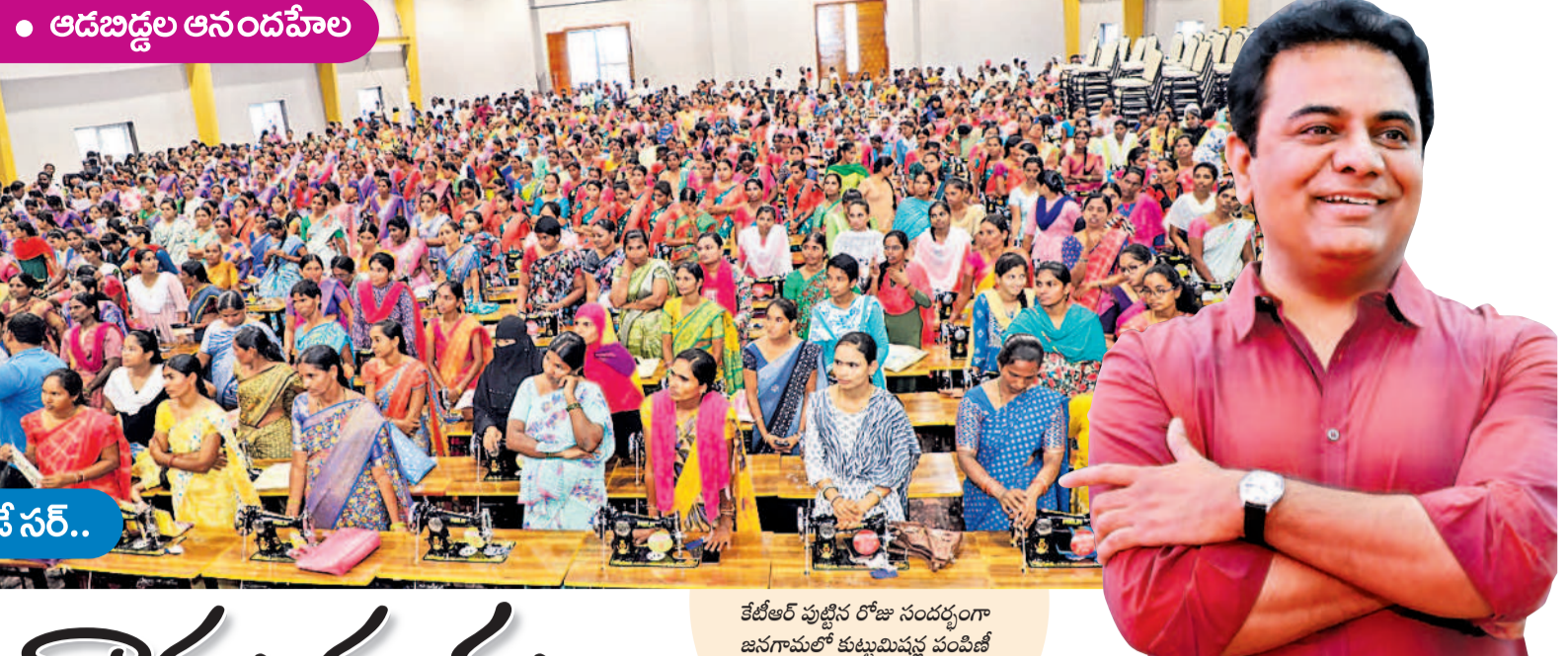
కేటీఆర్ పుట్టిన రోజు సందర్భంగా జనగామలో కుటుంబీకుల పంపిణీ కార్యక్రమానికి భారీగా తరలివచ్చిన మహిళలు