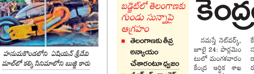
హనుమకొండలోని ఏపీయస్ శ్రీదేవి మాలలో కల్పి సినిమాలోని బుజ్జి కారు

నగరంలో కల్పి బుజ్జి హనుమకొండ చౌరస్తా, జూలై 24: నగరంలో 'కల్పి 2898 ఏడీ' సినిమాలో హిరో ప్రభాస్ వినయించిన బుజ్జి కారు సందడి చేసింది. హనుమకొండలోని శ్రీదేవి ఏపీయస్ మాలలో బుధవారం కారును ప్రదర్శించారు. ప్రభాస్ ఫ్యాన్స్, నగరవాసులు పల్లెలు సహకారును చూసేందుకు ఆసక్తి చూపించారు. ఫోటోలు దిగేందుకు ఎగబడ్డారు. పొన్నగ్రామ నిరుత్సాహంగా బయటి నుంచే ఫోటోలు దిగి వెళ్లిపోయారు. 'కారు ఎందుకు తీసుకువచ్చారు.. పనిలేకనా, మేం డబ్బులు ఖర్చుచేసి సినిమా చూస్తేనే కదా సినిమా హిట్ అయ్యింది.. మమ్మల్ని కారు వద్ద ఫోటోలు దిగనవ్వరా? అంటూ ఫ్యాన్స్, ప్రజలు గొడవలు పెట్టారు.