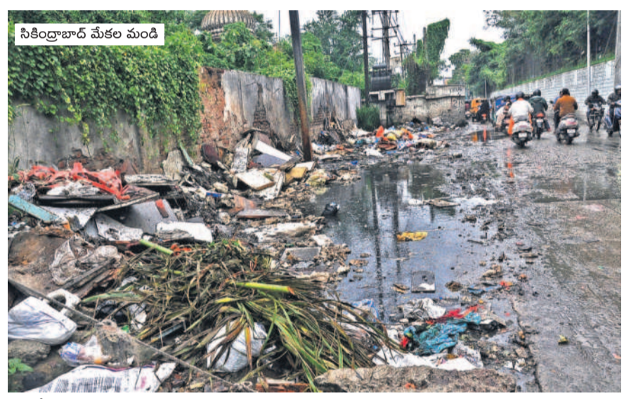
సికింద్రాబాద్ మేకల మండలం

సికింద్రాబాద్, జూలై 24 (నమస్తెలంగాణ) : గ్రేటర్లో పారిశుధ్య నిర్వహణ గాడి తప్పకుండా తరలింపేందుకు వరకాలంలో ప్రత్యేక ఏర్పాట్లు చేయడం లేదు. వరకాలం ప్రాంతం, ఈగలు, శ్రీమతికొండల వద్ద చెంది రోగాలు వ్యాపించే ప్రమాదం పొంది ఉన్నది. ఇప్పటికే మలేరియా, డెంగి కేసులు విజృంభిస్తున్నాయి. ఈ నేపథ్యంలోనే వరకాలంలో పారిశుధ్య నిర్వహణకు మరంత మెరుగైన చర్యలు తీసుకోవాలని ప్రజలు వేడుకుంటున్నారు.