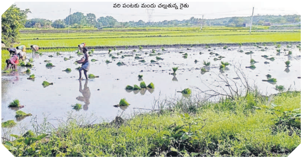
వరి పంటకు మందు చల్లుతున్న రైతు

జిల్లావ్యాప్తంగా పెద్దఎత్తున వరి పంటలను సాగు చేసుకుంటున్నారు. సొంత నిర్ణయాలతో పంటకు ఇంజనీరు సారంగా ఎరువులు చల్లి పంటల పెట్టబడి ఖర్చులు పెంచుకుంటున్నారు. వరిసాగులో సరైన యాజమాన్య చర్యలు పాటించాలి. అధికారుల సూచనల మేరకు పంటలకు ఎరువులను అందజేస్తూ అధిక దిగుబడిని సాధించుకోవచ్చునని వ్యవసాయాధికారులు సూచిస్తున్నారు. భూసార పరీక్షల ఫలితాలను గురించి ఎరువులు వాడినప్పుడే మంచి ఫలితాలు వస్తాయి. రైతులు అధికారుల సూచనల మేరకే పంటలకు మందులు వాడాలని వ్యవసాయాధికారి ఏ.డి.వి. సత్యనారాయణ తెలిపారు.