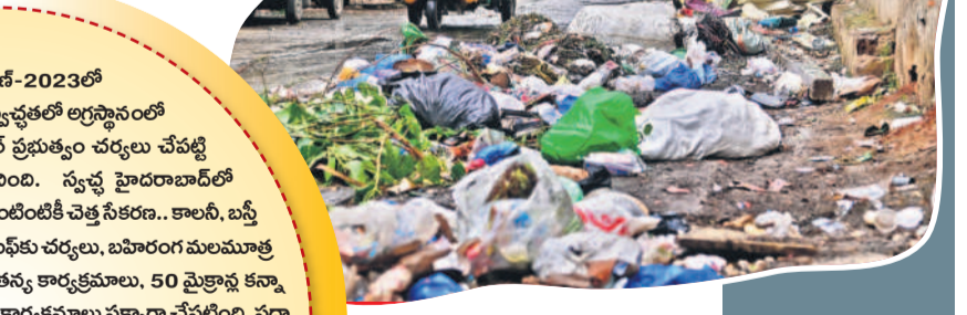
కామిడి గ్రామంలో గోశాల వెనుకవైపు

ఒక్కొక్క అటో కాలనీలవారీగా చూస్తే ఒకటి లేదా రెండు కాలనీలు గృహాల ప్రకారంగా గమనిస్తే ఒక్కొక్క అటోకు సుమారు 500 నుంచి 600 ఇండ్లను కేటాయింది. చెత్త సేకరణ జరపాలి. కానీ గడిచిన కొన్ని రోజులుగా ప్రభుత్వ అటోల పనితీరు కండకం లేదు. చాలా కాలనీలకు రోజూ స్వచ్ఛ అటోలు రావడం లేదు. వందకు వంద శాతం స్వచ్ఛ అటోల అతిండ్లెన్న ఉండడం లేదు. రోజూ 1000 స్వచ్ఛ అటోలు పనిచేయడం లేదని స్వయంగా గత కమిషనర్ రోనాల్డ్ గొల్లపూడి గ్రేటర్లోని పనితీరును ఉన్నతాధికారుల పర్యవేక్షణ లోపించింది. దీంతో ఎక్కడి చెత్త అక్కడే చెత్త కనబడుతున్నది. సమస్యలను పట్టించుకోవడం, చెత్త సేకరణలో అధిక వసూళ్లకు తెరలేపడం, సీటీలో ఉంచాల్సిన స్వచ్ఛ అటోలు గ్రేటర్ సరిపెద్దులు దాటుకుండడం గమనార్హం. ఇదే విషయంపై ఇటీవల కొత్త కమిషనర్ ఇల్లహంపట్లం ప్రభుత్వ అటోల పని తీరు మెరుగుపర్చాలని, లేదంటే చర్యలు తీసుకోవాలని అధికారులకు ఆదేశాలు జారీ చేశారు.