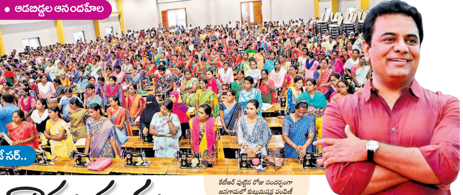
కేటీఆర్ పుట్టిన రోజు సందర్భంగా జనగామలో కుటుంబవృద్ధి పంపిణీ కార్యక్రమానికి భారీగా తరలివచ్చిన మహిళలు