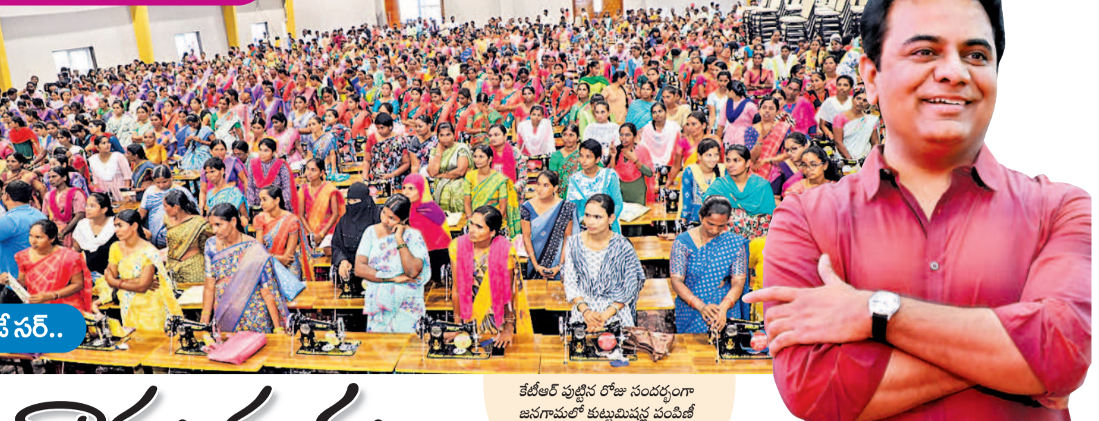
కేటీఆర్ పుట్టిన రోజు సందర్భంగా జనగామలో కుటుంబవృద్ధి పంపిణీ కార్యక్రమానికి భారీగా తరలివచ్చిన మహిళలు