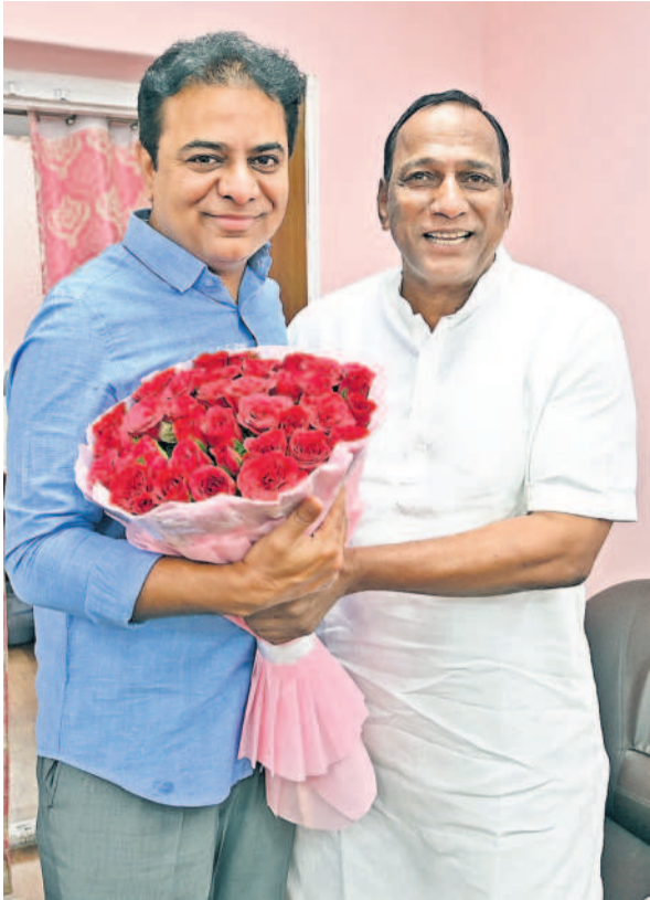
బర్డ్ నందర్ల గా మాజీ మంత్రి ఎమ్మెల్యే కేటీఆర్ కు పూలబాజీ అందజేస్తున్న మాజీ మంత్రి ఎమ్మెల్యే మల్లాది