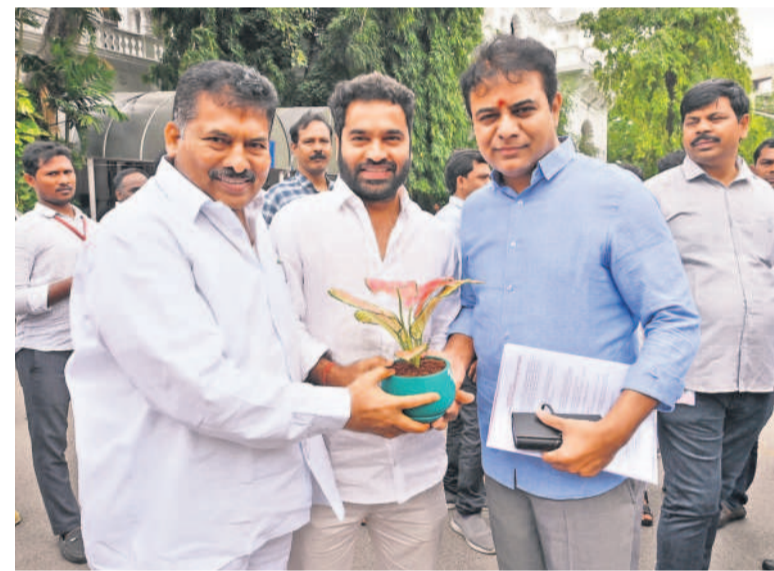
ఎమ్మెల్యే కేటీఆర్ కు మొక్కలు అందజేస్తున్న ఎమ్మెల్యే ముగా గోపాల్, జిఆర్ఎస్ నేత ముగా జైసింహ