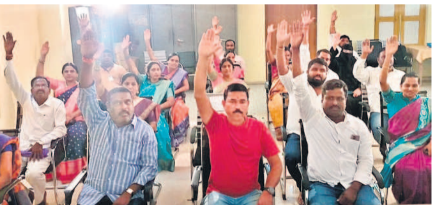
అవిశ్వాసానికి మద్దతుగా చేతులెత్తిన కౌన్సిలర్లు

రాష్ట్ర బడ్జెట్ అంకెల్లో భాగం. కానీ ప్రజలకు ఉపయోగపడేలా లేదు. ఎన్నికల సమయంలో ఇచ్చిన హామీల్లో ఏ ఒక్క హామీ పూర్తిస్థాయిలో అమలు చేయడానికి బడ్జెట్లో నిధుల రూపొందించలేదు. ఈ బడ్జెట్ పూర్తిగా రైతు, బడుగు, బలహీన వర్గాలకు వ్యతిరేకంగా ఉంది. గత ప్రభుత్వం రెండు విడుదలలో రైతులకు రైతు బంధు ఇస్తే ఈ ప్రభుత్వం వ్యవసాయ అనుబంధ రంగాలకు నిధులు కేటాయింపింది తప్పా ఈ పథకానికి ఇన్ని నిధులు కేటాయిస్తున్నామని ఎక్కడా వివరాలు పేర్కొనలేదు. రైతుబంధు ఎక్కణ్ణి ప్రయత్నం చేస్తున్నది. రోడ్ అభివృద్ధికి అనుకున్న సమయంలో నిధులు విడుదల చేయలేదు. ప్రభుత్వం ప్రవేశపెట్టిన బడ్జెట్ ఒక పాలనీ లేదు. ఇది పూర్తిగా తెలంగాణ ప్రజలను మరిచిపో బడ్జెట్ తప్పా మరోకటి కాదు. ఇక్కడి ప్రజాప్రతినిధి అభివృద్ధి కోసం పార్టీ మారానని చెబుతున్నాడని, అయితే ఈ బడ్జెట్లో నిర్బంధం పరిధిలో వెండిగో పనులకు ఎన్ని నిధులు కేటాయింపారో చెప్పాలి.