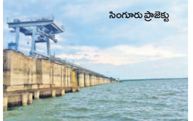
వరద రావడం లేదని అధికారులు అంటున్నారు. ఈ సీజన్లో జూన్ నుంచి అక్టోబర్ వరకు ప్రాజెక్టు ఏకా మహాలాల్లో అధిచిన స్థాయిలో లేకపోవడంతోనే ప్రాజెక్టులోకి అంతగా

పుల్వే, జూలై 25: ఎగువ ప్రాంతాల్లో కురుస్తున్న వర్షాలకు సంగారెడ్డి జిల్లా సింగూరు ప్రాజెక్టులోకి వరద వస్తున్నది. గతేడాది ఇదే సమయంలో ప్రాజెక్టులో 21.272 టీఎంసీల నీరు నిల్వ ఉండగా, ప్రస్తుతం ప్రాజెక్టులో 18.899 టీఎంసీల నీరు మాత్రమే ఉంది. ప్రాజెక్టు వ్యూహ సామర్థ్యం 29.917 టీఎంసీలు కాగా ప్రాజెక్టులోకి 1444 క్యూసెక్కులు ఇన్ఫోర్స్ చేస్తున్నది ప్రాజెక్టు అధికారులు తెలిపారు. ఎగువ ప్రాంతాలైన కర్ణాటక, మహారాష్ట్ర, సాంగావేల్ భారీ వర్షాలకు బలీస్తే ప్రాజెక్టులోకి వరద బారీగా చేరుతుందని, ఈసారి వర్షాలు అధిచిన స్థాయిలో లేకపోవడంతోనే ప్రాజెక్టులోకి అంతగా