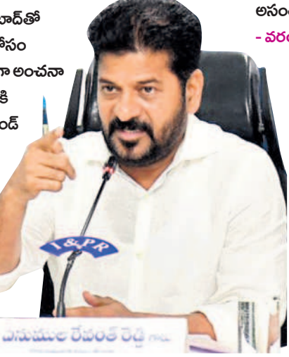
- గత నెల 29న వరంగల్ సమీక్షలో ముఖ్యమంత్రి రేవంత్ రెడ్డి