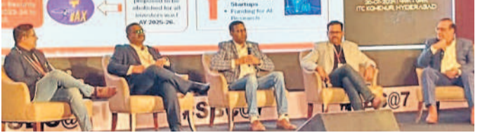
సమావేశంలో పాల్గొన్న అధికారి నుపుణులు

కొండాపూర్, జూలై 26: ట్యాక్స్ నీతిని అర్థం చేసుకోవడానికి ప్రజలకు అవగాహన కల్పించే లక్ష్యంతో ఏర్పడిన సమావేశానికి ఆల్టిన్ కాలనీ ప్రజలకు డ్యాన్స్ పాడుతూ వినోదం కల్పించారు.