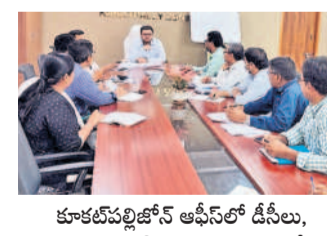
కూకట్‌పల్లిలో జేపీ ఉపేందర్ డి.సి.లు, అధికారులతో మాట్లాడుతున్న జడ్పీ

కేటీపిఎల్ కాలనీ, జూలై 26: కూకట్‌పల్లి జోన్ పరిధిలో ఆస్తిపన్ను వసూళ్లు వేగవంతం చేయాలని ఆదేశాలు జారీ చేసారు.