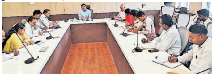
ఇంజనీరింగ్, బయోటెక్నాలజీ అధికారులు సమావేశంలో జడ్పీ ఉపేందర్‌రెడ్డి

మియాపూర్, జూలై 26: ప్రధాన రహదారులతోపాటు కాలనీలో అంతర్గత రహదారులను పరిశుభ్రం చేయాలని ఆదేశాలు జారీ చేసారు.