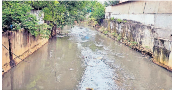
ప్రజలు వ్యర్థ రసాయనాల డంపింగ్ చేస్తున్న జీడిమెట్ల-బాలానగర్ నాలాల

బాలానగర్, జూలై 26 : జీడిమెట్ల-బాలానగర్ గడ్డ నాలాలలో వ్యర్థ రసాయనాల డంపింగ్ మొదలైంది. ఇన్సెక్టు కనిపించకుండా పోయిన రసాయనాల డంపింగ్ కాంగ్రెస్ ప్రభుత్వం రావడం వలన తిరిగి ప్రారంభమైందని పలు కాలనీల ప్రజలు ఆవేదన వ్యక్తం చేస్తున్నారు.