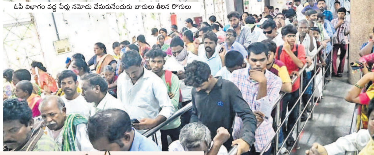
ఓపీ విభాగం వద్ద పేర్లు నమోదు చేసుకునేందుకు భారలు తీరని రోగులు