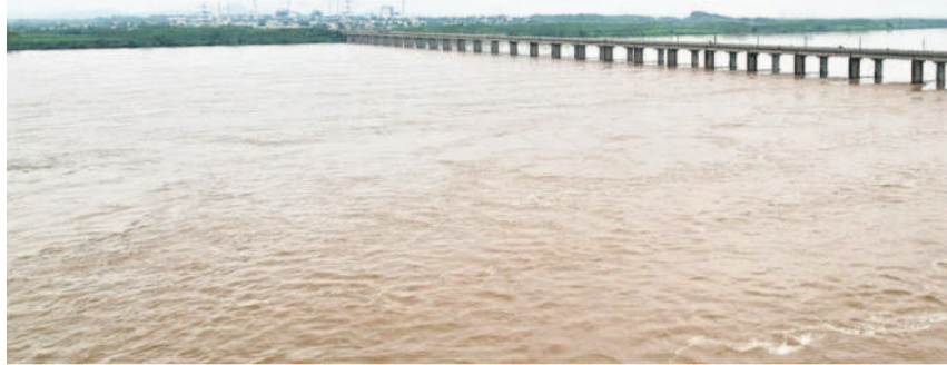
భద్రాచలం వద్ద మళ్ళీ పెరుగుతున్న గోదావరి నీటిమట్టం