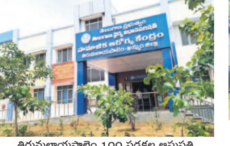
తిరుమలాయపాలెం 100 పడకల ఆసుపత్రి

తిరుమలాయపాలెం, జూలై 26 : తిరుమలాయపాలెం మండల కేంద్రంలోని వంద పడకల ప్రభుత్వ ఆసుపత్రి కొనసాగుతున్న సందిగ్ధత నెలకొంది. ఆసుపత్రి స్థాయిని తగ్గించి కాసుమంచికి బదిలీచేసి అక్కడ వంద పడకల ఆసుపత్రి చేపడతారని గత కొన్నిరోజులుగా పుకార్లు షికార్లు చేస్తున్నాయి. ఈ నేపథ్యంలో తిరుమలాయపాలెం 100 పడకల ఆసుపత్రిని తరలించడానికి వీలు లేదంటూ ఈ ప్రాంత అఖిలపక్ష పార్టీలు పోరుబాట పట్టాయి. మండలంలోని అన్ని రాజకీయ పార్టీలు ధర్మాలు, ప్రదర్శనలు నిర్వహిస్తున్నాయి. గత నాలుగరోజులుగా ఆసుపత్రి ఎదుట రిలే నిరాహార దీక్షలు కొనసాగు