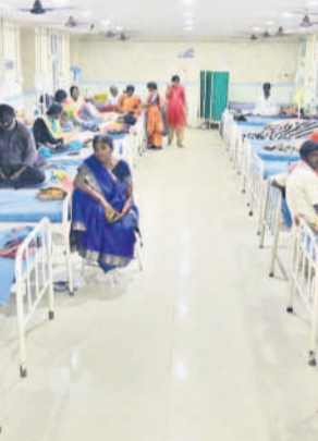
కొత్తగూడెం ప్రభుత్వ జనరల్ ఆసుపత్రిలో మందుల రూం వద్ద రోగుల క్యూ

ఖమ్మం జిల్లాలో ఖమ్మం మున్సిపల్ కార్పొరేషన్లో పాటు మదీర, వైరా, సత్తుపల్లి మున్సిపాలిటీలు, మరో 589 గ్రామ పంచాయతీలు ఉన్నాయి. కొత్తగా కొంగ్రెస్ ప్రభుత్వం వచ్చినప్పటి నుంచి వాటిపై పెద్దగా శ్రద్ధ పెట్టిన దాఖలాలు లేవు. పంచాయతీలకు ఎప్పుడూ గడువు తీరిపోవడం, ఇప్పటికీ పాలకర్షాలు లేకపోవడం, ప్రత్యేక