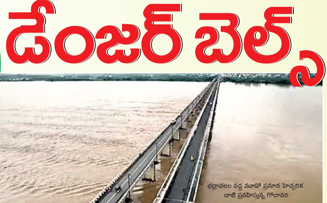
భద్రాచలం వద్ద మూడో ప్రమాద హెచ్చరిక దాటి ప్రవహిస్తున్న గోదావరి

జలదిగ్బంధంలో గోదావరి తీరం 53 అడుగులు దాటి ప్రవహిస్తున్న వరద చర్ల, దుమ్ముగూడెం మండలాలకు భద్రాచలంతో కటిఫ్ అటు శబరి.. ఇటు గోదావరితో ఆంధ్రా-తెలంగాణకు రాకపోకలు బండ్ తాలిపేరు నుంచి 1.20 లక్షల క్యూసెక్కుల నీరు విడుదల