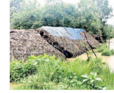
వర్షాల : పూర్తిగా నీటి మునిగిన నాదేరెల ప్రాంతం