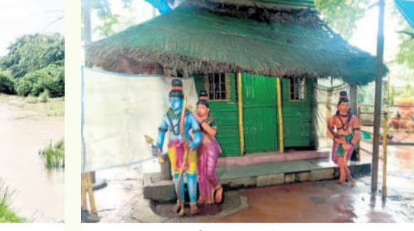
భక్తులు లేక వెలవెలయిన వర్షాల