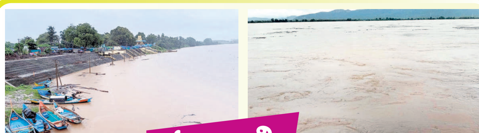
వర్షాల వద్ద ఉధృతంగా ప్రవహిస్తున్న గోదావరి

ఎకరాలలోపు రైతులు 3,751 మంది, కాగా ఆపైన భూమి కలిగిన వారు 15,075 మంది ఉన్నట్లు ఆమె పేర్కొన్నారు. ఇప్పటివరకు 4,062 మంది మాత్రమే దరఖాస్తులు చేసుకోవడం జరిగిందన్నారు. మిగిలిన 11,013 మంది రైతులు పేర్లు నమోదు చేసుకోవాల్సి ఉందన్నారు. అర్హత కలిగిన రైతులు ఆధార్, పట్టాదారు పాసుపుస్తకం, నామినీ ఆధార్ లతో జిరాఫ్ లో సామిక ఏకవోల వద్ద దరఖాస్తు చేసుకోవాలని రైతులకు సూచించారు.