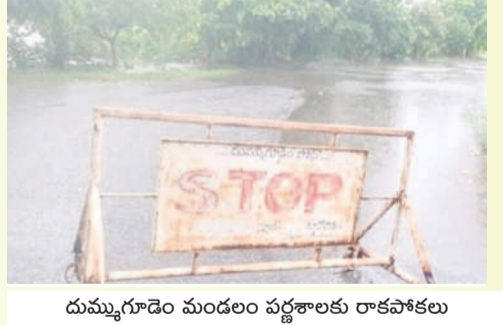
దుమ్ముగూడెం మండలం వర్షాలకు రాకపోకలు లేకపోవడంతో హెచ్చరిక బోర్డును ఏర్పాటు చేసిన పోలీసులు