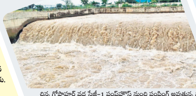
చిట్టెం గోష్టాపూర్ వద్ద స్టేజీ-1 పంపింగ్ నుంచి పంపింగ్ అవుతున్న నీరు

ముక్త, జూలై 27 : ముక్త మండలం సంగంబండ పెద్దవారుపై నిర్మించిన చిట్టెం నర్సిరెడ్డి బ్యారేజీని రిజర్వాయర్, ముక్త మండలం భూత్పూర్ వద్ద నిర్మించిన భూత్పూర్ రిజర్వాయర్కు పంపింగ్ కొనసాగుతున్నది. టీమా ఫేజ్-1లోని చిట్టెం గోష్టా పూర్ వద్ద స్టేజీ-1 పంపింగ్ నుంచి 1,300 క్యూసెక్కుల నీటిని కృష్ణానది నుంచి ఎత్తిపోస్తున్నారు. సమాంతర కాల్య ద్వారా భూత్పూర్ రిజర్వాయర్కు 500 క్యూసెక్కులు, ముక్త తిరుమలాయ చెరువు కట్ట వద్ద ఉన్న స్టేజీ-2 పంపింగ్ నుంచి 800 క్యూసెక్కుల వరద నీరు చిట్టెం నర్సిరెడ్డి బ్యారేజీని రిజర్వాయర్కు అధికారులు పంపింగ్ చేస్తున్నారు. రిజర్వాయర్లో 1.92 టీఎంసీల నీరు వచ్చి చేరినట్లు వెల్లడించారు. రైట్, లెఫ్ట్ కెనాల ద్వారా సాగుకు 50 క్యూసెక్కుల నీటిని దిగువకు విడుదల చేస్తున్నట్లు అధికారులు తెలిపారు.