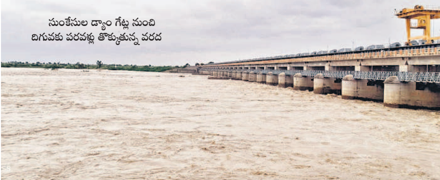
సుంకేసుల డ్యాం గేట్ల నుంచి దిగువకు వరద కృష్ణానది వరద

మహబూబ్‌నగర్, జూలై 27 : వ్యాధుల కాలం ఆరంభమైంది. దీంతో డెంగి, మలేరియా, చికున్‌గున్యా, డయెరియా, టైఫాయిడ్ రోగులు దవాఖానకు క్యూ కడుతున్నారు. ముందస్తుగా పాఠశాల వరకు చేపట్టబోవడంతో గ్రామాలు, పట్టణాల్లో పరిస్థితి మరి అధ్యాసంగా తయారైంది. సర్పంచుల పదవీకాలం ముగిసి ప్రత్యేకాధికారుల పాలనలో గ్రామాలలో పాఠశాలలను అత్యధికంగా ఏర్పాటు చేస్తున్నారని తెలిపారు. కొన్ని రోజులుగా వాతావరణంలో వస్తున్న మార్పులతో చిన్నా, పెద్దా తేడా లేకుండా మంచానడంతున్నారు. ఫలితంగా ప్రభుత్వ, ప్రైవేట్ ఆస్పత్రులకు వచ్చి చికిత్స పొందుతున్న రోగుల సంఖ్య పెరుగుతోంది. వారం రోజులుగా జనరల్ దవాఖానకు వచ్చే రోగుల సంఖ్య 1,400 నుంచి 2వేల వరకు పెరిగింది. ప్రైవేట్ దవాఖానల్లో కూడా భారీగానే కేసులు నమోదవుతున్నాయి. మెయిన్ వైద్యం అందక జనరల్ దవాఖానను ఆశ్రయిస్తున్న రోగుల సంఖ్య క్రమంగా పెరుగుతున్నది. ఇక్కడ సాధారణ జ్వరాలు, ఒంటినొప్పులు, ఇతర సమస్యలకు వైద్యం అందిస్తున్నారు. అయితే నీళ్లు ఎక్కువ మంది రోగులు వస్తుండడంతో వైద్యులు హడావుడిగా చికిత్స చేస్తూ చేతులు దులుపుకొంటున్నారని రోగులు వాపోతున్నారు. నాడిపట్టి పరిస్థితి రోగితో సమస్య తెలుసుకునే పరిస్థితి లేదని, సాధారణ పరీక్షలు నిర్వహించి మందులు ఇచ్చి పంపుతున్నారని ఆరోపిస్తున్నారు. ముఖ్యమంత్రి ఆదేశాలతో.. మహబూబ్‌నగర్ జిల్లా కేంద్రంలో వర్షకాలం పక్కా ప్రణాళిక కొరవడుతోంది. పట్టణ ఆరోగ్య కేంద్రాల పరిధిలో రోగుల తాకిడికి అనుగుణంగా సేవలందించడం లేదు. వాన నీరు నిలిచి పొంగిపొరకుండా చూడాలని మున్సిపాలిటీ వారు మొక్కుబడి చర్యలతో సరిపెడుతున్నారు. పాఠశాల, డోమల నివారణకు ఏటా సీజన్‌లో రూ.3కోట్ల మేర ఖర్చు పెడుతున్నా ఫలితం లేకుండాపోతున్నది. జిల్లా కేంద్రంలో కనీసం ఫాంగింగ్