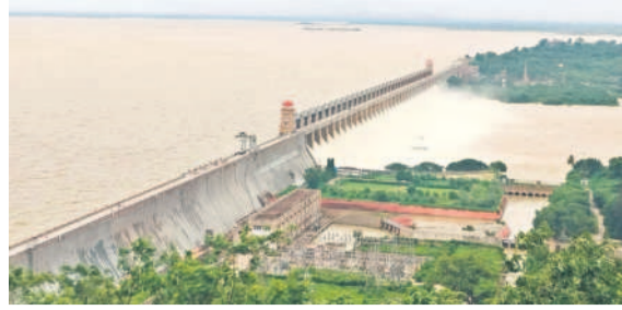
తుంగభద్ర జలాశయం క్రమ గేట్ల ద్వారా దిగువకు పారుతున్న వరద