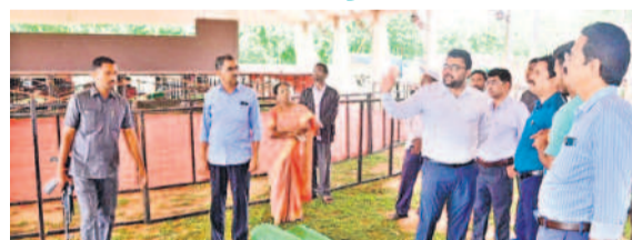
బహిరంగ సభాస్థలిని పరిశీలిస్తున్న నాగరకర్నూల్ కలెక్టర్

ఎగువ జూరాలలో ఐదు యూనిట్లలో కొనసాగింపు అత్యుత్తమం, జూలై 27 : ఎగువ నుంచి వస్తున్న భారీ వరదల కారణంగా దిగువ జూరాల జలవిద్యుత్ కేంద్రంలో విద్యుదుత్పత్తిని నిలిపివేశారు. 2.50 లక్షల క్యూసెక్కులకు పైగా అవుట్‌ఫ్లో ఉండడంతో యంత్రాలు వైబ్రేషన్లు వస్తున్నాయని, దీంతో విద్యుదుత్పత్తిని నిలిపివేస్తున్నట్లు అధికారులు వెల్లడించారు. ఎగువ జూరాలలో 5 యూనిట్లలో విద్యుదుత్పత్తి చేపడుతున్నట్లు ఎన్‌ఈ సర్కిల్‌మిర్రెడ్డి తెలిపారు. ఎగువ జూరాలలో శుభ్రవారం అర్ధరాత్రి వరకు 2.272 మిలియన్ యూనిట్లు జరుగగా, మొత్తంగా 27.123 మి.యూ ఉత్పత్తి అయ్యింది. దిగువ జూరాలలో 1.975 మి.యూ మాత్రమే ఉత్పత్తి జరుగగా, మొత్తంగా 32.995 మిలియన్ యూనిట్ల ఉత్పత్తి జరిగింది.