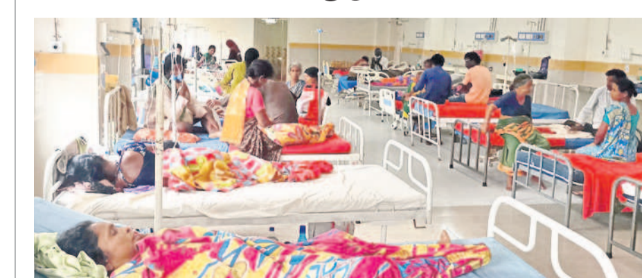
మహబూబ్‌నగర్ ప్రభుత్వ జనరల్ దవాఖానలో చికిత్స పొందుతున్న రోగులు

మహబూబ్‌నగర్, జూలై 27 : వ్యాధుల కాలం ఆరంభమైంది. దీంతో డెంగి, మలేరియా, చికున్‌గున్యా, డయెరియా, టైఫాయిడ్ రోగులు దవాఖానకు క్యూ కడుతున్నారు. ముందస్తుగా పాఠశాల వరకు చేపట్టబోవడంతో గ్రామాలు, పట్టణాల్లో పరిస్థితి మరి అధ్యాసంగా తయారైంది. సర్పంచుల పదవీకాలం ముగిసి ప్రత్యేకాధికారుల పాలనలో గ్రామాలలో పాఠశాలలను అత్యధికంగా ఏర్పాటు చేస్తున్నారని తెలిపారు. కొన్ని రోజులుగా వాతావరణంలో వస్తున్న మార్పులతో చిన్నా, పెద్దా తేడా లేకుండా మంచానడంతున్నారు. ఫలితంగా ప్రభుత్వ, ప్రైవేట్ ఆస్పత్రులకు వచ్చి చికిత్స పొందుతున్న రోగుల సంఖ్య పెరుగుతోంది. వారం రోజులుగా జనరల్ దవాఖానకు వచ్చే రోగుల సంఖ్య 1,400 నుంచి 2వేల వరకు పెరిగింది. ప్రైవేట్ దవాఖానల్లో కూడా భారీగానే కేసులు నమోదవుతున్నాయి. మెయిన్ వైద్యం అందక జనరల్ దవాఖానను ఆశ్రయిస్తున్న రోగుల సంఖ్య క్రమంగా పెరుగుతున్నది. ఇక్కడ సాధారణ జ్వరాలు, ఒంటినొప్పులు, ఇతర సమస్యలకు వైద్యం అందిస్తున్నారు. అయితే నీళ్లు ఎక్కువ మంది రోగులు వస్తుండడంతో వైద్యులు హడావుడిగా చికిత్స చేస్తూ చేతులు దులుపుకొంటున్నారని రోగులు వాపోతున్నారు. నాడిపట్టి పరిస్థితి రోగితో సమస్య తెలుసుకునే పరిస్థితి లేదని, సాధారణ పరీక్షలు నిర్వహించి మందులు ఇచ్చి పంపుతున్నారని ఆరోపిస్తున్నారు. ముఖ్యమంత్రి ఆదేశాలతో.. మహబూబ్‌నగర్ జిల్లా కేంద్రంలో వర్షకాలం పక్కా ప్రణాళిక కొరవడుతోంది. పట్టణ ఆరోగ్య కేంద్రాల పరిధిలో రోగుల తాకిడికి అనుగుణంగా సేవలందించడం లేదు. వాన నీరు నిలిచి పొంగిపొరకుండా చూడాలని మున్సిపాలిటీ వారు మొక్కుబడి చర్యలతో సరిపెడుతున్నారు. పాఠశాల, డోమల నివారణకు ఏటా సీజన్‌లో రూ.3కోట్ల మేర ఖర్చు పెడుతున్నా ఫలితం లేకుండాపోతున్నది. జిల్లా కేంద్రంలో కనీసం ఫాంగింగ్