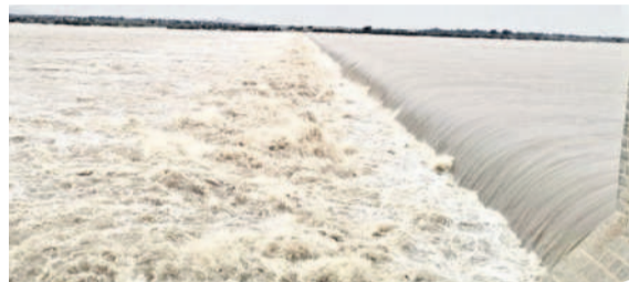
ఆర్డీఎస్ అయకట్టుపై నుంచి పారుతున్న వరద

మహారాష్ట్రలో కురుస్తున్న భారీ వరదలకు కర్ణాటకలోని అల్పజీ, నారాయణపూర్ ప్రాంతాలకు వరద చేరుతున్నది. అల్పజీ ప్రాంతాల్లోకి 2,96,794 క్యూసెక్కుల ఇన్‌ఫ్లో, 3 లక్షల క్యూసెక్కుల అవుట్ ఫ్లో ఉన్నది. ప్రాంతీయ గరిష్ఠస్థాయి నీటిమట్టం 1,705 అడుగులకు గానూ 1,687.69 అడుగులు ఉంది. పూర్తి స్థాయి నీటి నిల్వ 113.69 టీఎంసీలకుగానూ ప్రస్తుతం 76.698 టీఎంసీలుగా ఉన్నది. నారాయణపూర్ ప్రాంతాల్లోకి 3 లక్షల క్యూసెక్కుల ఇన్‌ఫ్లో ఉండగా, 3,00,064 క్యూసెక్కుల అవుట్ ఫ్లో నమోదైంది. గరిష్ఠస్థాయి నీటిమట్టం 1,615 అడుగులకుగానూ ప్రస్తుతం 1,609.12 అడుగులుగా ఉన్నది. పూర్తి స్థాయి నీటి నిల్వ 37.64 టీఎంసీలకు గానూ 25.164 టీఎంసీలు ఉన్నది.