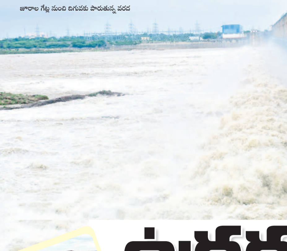
జూరాల గేట్ల నుంచి దిగువకు పారుతున్న వరద