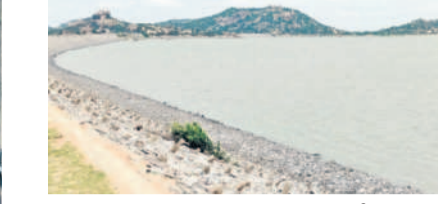
ర్యాలపాడు బ్యారేజీలోని రిజర్వాయర్లో శనివారం నాటికి 1.67 టీఎంసీల నీటి నిల్వ ఉంది. ఎడమ కాల్య (104మైళ్లకు 257 క్యూసెక్కులు, కుడి కాల్యకు 697 క్యూసెక్కుల నీటిని విడుదల చేస్తున్నారు. - గట్టు, జూలై 27

డ్యాంకు తరలిస్తున్నట్లు డ్యాంకు ఏకా రాజు తెలిపారు. డ్యాంకు పూర్తి స్థాయి నీటి నిల్వ 1.23 టీఎంసీలు కాగా, ప్రస్తుతం 0.438 టీఎంసీలు ఉన్నది. కనీసం కనీసం 1,540 క్యూసెక్కులను విడుదల చేస్తున్నారు.