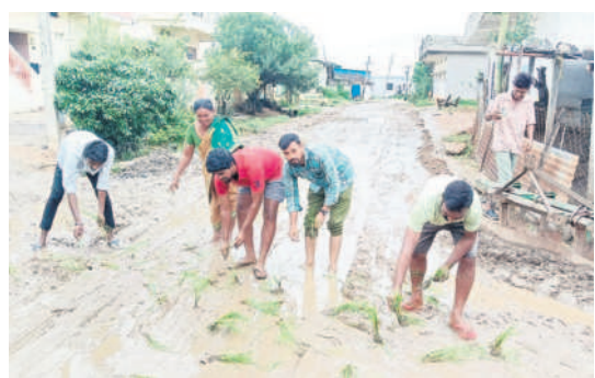
రోడ్డుపై నాట్లు వేస్తూ నిరసన తెలుపుతున్న రింజా(టీ) గ్రామస్థులు