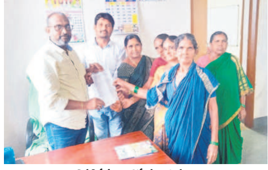
వినతిపత్రం అందిస్తున్న కార్మికులు

కుంటూ, జూలై 27 : లింజా (టీ) గ్రామంలోని ఊరి మధ్యలో గల రోడ్డు వల్లాలతో బురదమయం అయింది. దీంతో నడవడానికి ఇబ్బందులు పడుతున్నామని గ్రామస్థులు అందోళన నిర్వహించారు. శనివారం రోడ్డుపై బురదలో నాట్లు వేసి నిరసన తెలిపారు. అధికారులు సమస్యను పరిష్కరించాలని గ్రామస్థులు కోరుతున్నారు.