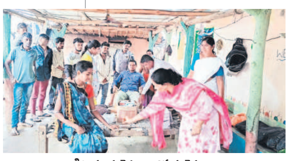
గిరిజనులకు వైద్యం అందిస్తున్న వైద్యులు

'వైద్య నారాయణి హాల్' అన్నారు పేర్లు. ఈ వ్యాఖ్యాన్ని అక్షరాల నిరూపిస్తున్నారు ఆదిలాబాద్ ప్రభుత్వ వైద్యులు. వారు, వంకలు దాటి మోకాలు లోతు బురదలో నుంచి వెళ్లి తండాలు, గూడలు, మారుమూల ప్రాంతాల్లో వైద్య శిబిరాలు నిర్వహిస్తున్నారు. రాజ్, రవ్వలు, గుట్టల నుంచి వెళ్లి వైద్యం అందిస్తున్నారు. రోగులను పరిశీలించి మందులు అందిస్తున్నారు. తాజాగా శనివారం ఇంద్రవెల్లి, ఆదిలాబాద్ దూరల్, ఇంద్రవెల్లి మండలాల్లో వైద్యులు శిబిరాలు నిర్వహించారు.