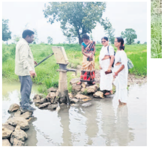
మురికి నీటిలో ఉన్న చేతివంపును పరిశీలిస్తున్న వైద్య సిబ్బంది

మురికి నీటిలో ఉన్న చేతివంపు నుంచి నీటిని తెచ్చుకుంటున్న, కొలాం ఆదివాసి గిరిజన మహిళలు బొడ్డిగూడ గ్రామంలోని కొలాం ఆదివాసి గిరిజనుల కలుషిత నీటిని తాగుతూ రోగాల పాలవుతున్నారు. గ్రామానికి మిషన్ భగీరథ నీరు రావడం లేదని, చేతి వంపు కూడా పని చేయడం లేదని గ్రామస్థులు తెలిపారు. దీంతో గ్రామానికి కొద్ది దూరంలో వ్యవసాయ బావికి అనుకుని, మురికినీటిలో ఉన్న చేతి వంపు ద్వారా నీటిని తీసుకొచ్చుకుంటున్నామని అవేదన చెందారు. ఆ నీరు వాసన, వ్యాధులు కూడా వస్తున్నాయని మండిపడుతున్నారు. గ్రామానికి కొద్ది దూరంలో చేతి వంపు ఉందని, రాత్రిపూట తాగునీటిని తీసుకురావాలని పరిస్థితి ఉందన్నారు. మధ్యలో చిన్న వాగు ఉండడంతో వర్షాలు కురిస్తే వరద నీటితో చేతి వంపుకు పోవాలని పరిస్థితి ఉందన్నారు. ఒక్కసారి నీటిని తీసుకొచ్చుకుంటే ఆ నీటిని రెండు, మూడు రోజులు తాగొచ్చిన దుస్థితి ఏర్పడిందని అవేదన వ్యక్తం చేస్తున్నారు. తాగునీటి సౌకర్యం కల్పించాలని గ్రామస్థులు కోరుతున్నారు. - ఇంద్రవెల్లి, జూలై 27