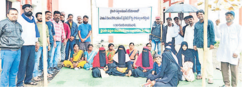
డబుల్ బెడ్రూంల వద్ద నిరసన చేపడుతున్న లబ్ధిదారులు