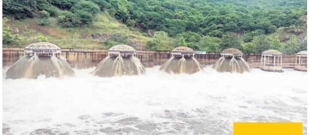
ధర్మారం: నంది పంచవహాస్ డెలివర సిస్టమ్ నుంచి ఎగిసే పడుతున్న గోదావరి జలాలు