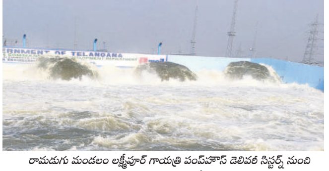
రామడుగు మండలం లక్ష్మీపూర్ గాయత్రీ పంచవహాస్ డెలివర సిస్టమ్ నుంచి ఉప్పొంగుతున్న కాళేశ్వరం జలాలు

కేటీఆర్ సవాలీకు కాంగ్రెస్ సర్కారు దిగివచ్చింది. కాళేశ్వరం పంపులను ఆగిస్తే 2 లోగా ఆన్ చేయకుంటే 50 వేల మంది రైతులతో వచ్చి తామే ఆన్ చేస్తామని ఇచ్చిన అల్లిమేటానికే తలోగ్గింది. 24 గంటల్లోనే మధ్యమానేరు (శ్రీ రాజరాజేశ్వర్ల) ప్రాజెక్టుకు ఎత్తిపోతలను ప్రారంభించింది. శనివారం ధర్మారం మండలం నంది పంచవహాస్ లో 4, రామడుగు మండలం గాయత్రీ పంచవహాస్ లో 4 బాహుబలి మోటార్లను ఆన్ చేసింది. మొత్తంగా 12,600 క్యూసెక్కులను ఎత్తిపోస్తుండగా, రైతాంగం ఆనందపడుతున్నది. అల్లి మందిగానే ఉన్నాయని, కాంగ్రెస్ కావాలనే స్వీకృత్యం కూడా తమ పాలాలు ఎండబెట్టిందని ఆగ్రహం వ్యక్తం చేస్తున్నది.