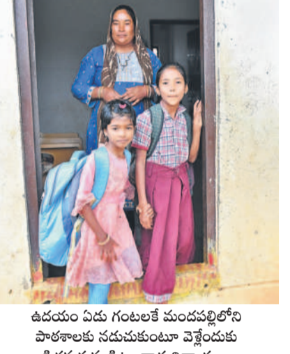
ఉదయం ఏడు గంటలకే మందపల్లిలోని పాఠశాలకు నడుచుకుంటూ వెళ్తున్న పిట్టలవాడ విద్యార్థులు

బోధన చేయించారు. మాజీ మంత్రి హరిశ్చంద్ర, స్థానిక ప్రజాప్రతినిధులు, అధికారుల చొరవతో గత సంవత్సరం వరకు తాత్కాలిక పాఠశాలలో తరగతులు నడిచాయి. కానీ ఈ విద్యాసంవత్సరం నుంచి అక్కడ పాఠశాలను తీసివేశారు. దీంతో ఆ గ్రామ విద్యార్థులు చాలా ఇబ్బందులు ఎదుర్కొంటున్నారు. రోజూ పిట్టల వాడ నుంచి సమీపంలో ఉన్న మందపల్లికి వెళ్లాలంటే సుమారు 4 కి.మీలు నడవాల్సిన పరిస్థితి ఏర్పడింది. రోజూ ఉదయం ఏడు గంటలకు బయల్పడి.. తిరిగి పాఠశాల ముగిశాక రాత్రి ఏడు గంటల వరకు పిల్లలు ఇంటికి చేరుకుంటున్నట్లు వారి తల్లిదండ్రులు ఆవేదన వ్యక్తం చేశారు. పిట్టలవాడలో ఒక్కడే తరగతి నుంచి ఐదో వరకు చదువుకునే విద్యార్థులు సుమారు 40 నుంచి 50 మంది వరకు ఉన్నారు. జిల్లా పరిషత్ పాఠశాలలో చదువుకునే వారు 20 మంది ఉండగా.. మిగతా వారంతా ప్రాథమిక పాఠశాలలో చదువుకుంటున్నారు.