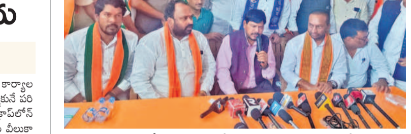
మెదకలో మాట్లాడుతున్న కేంద్ర మంత్రి రామదాస్ అథావలే