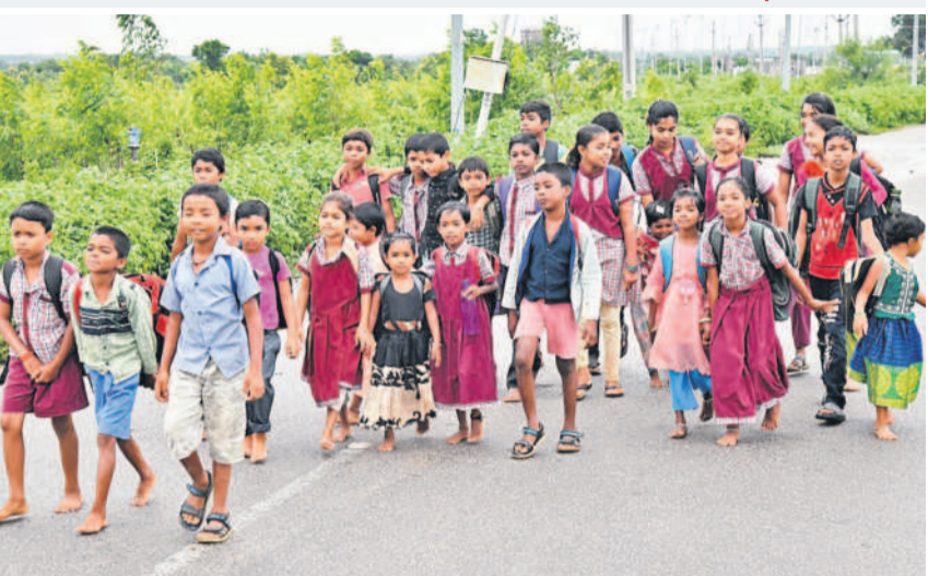
సిద్దిపేట అర్బన్ మండలం మందపల్లిలోని పాఠశాలకు నడుచుకుంటూ వెళ్తున్న పిట్టలవాడ విద్యార్థులు

ఆ గ్రామంలోని పిల్లలు బడికి వెళ్లి చదువుకోవాలంటే 4 కిలోమీటర్ల దూరమిస్తుంది. గ్రామంలో పాఠశాల లేక వేరే పాఠశాలకు వెళ్లాలంటే రవాణా సౌకర్యం లేక అనేక ఇబ్బందులు పడుతున్నాయి. సమీప గ్రామంలోని పాఠశాలకు వెళ్లాలంటే ఎండకు, వానకు సంబంధం లేకుండా రోజూ (రానుపోనూ కలిపి మొత్తం 8 కి.మీటర్లు) నడిస్తే వ్యర్థ వేసరిస్తుంది.