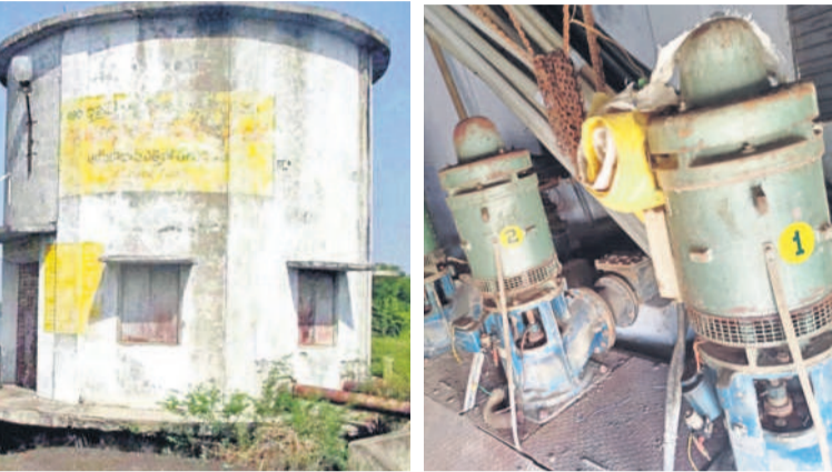
సంగారెడ్డి జిల్లా న్యూలీకల్ మండలంలో నిరుపయోగంగా ఉన్న అమీరాబాద్ ఎత్తిపోతల పథకం, తుప్పుపడుతున్న పరికరాలు