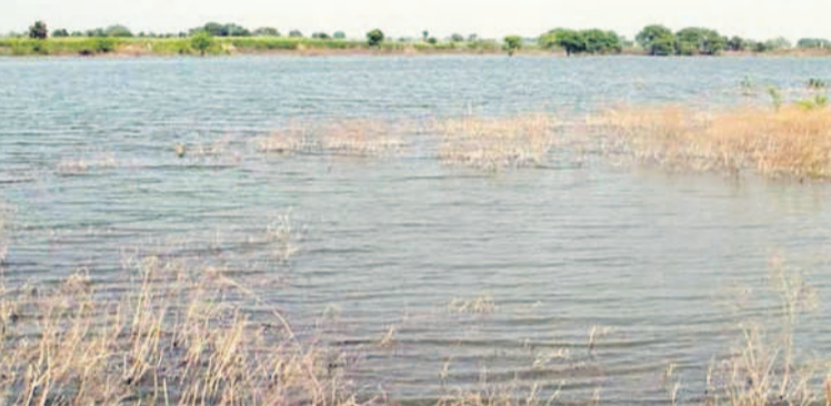
సంగారెడ్డి జిల్లా న్యూలీకల్ మండలంలో ఎత్తిపోతల పథకం పక్కనే ప్రవహిస్తున్న మంజీరానది