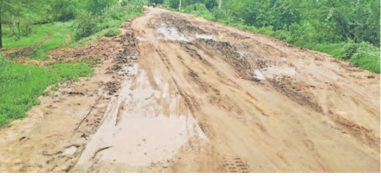
సిర్కారులో వాగు వంతెన సమీపంలో మురదమయ్యమైన రోడ్డు