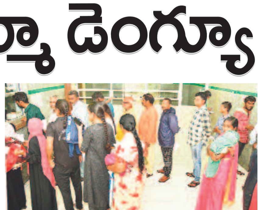
మందులు తీసుకునేందుకు క్యూ కట్టిన ఔట్ పేషెంట్లు

కరీంనగర్, జూలై 28 (నమస్తే తెలంగాణ)/విద్యార్థిని గర్వ : ప్రతి వర్షాకాలంలో వచ్చే వ్యాధులతో జిల్లా ప్రజలు ఆందోళన చెందుతున్నారు. ముందు జాగ్రత్త చర్యలు తీసుకోకపోవడంతో వ్యాధులు విజృంభిస్తుండగా, ముఖ్యంగా డెంగ్యూ తీవ్ర ఆందోళనకు గురిచేస్తోంది. అతిసార, మలేరియా, చికున్ గున్యా, మెడలు వాపు వంటి వ్యాధులతో ప్రజలు సతమతమవుతున్నారు. దీనికి తోడు సైవేట్ దవాఖానలు రోగులను భయపెట్టే గురిచేయడం జిల్లాలో పరిపాటిగా మారింది. తక్కువ ఖర్చుతో నయమయ్యే వ్యాధులకు రూ. లక్షలకు లక్షలు గుంజి వైద్యం చేస్తున్నారనే ఆరోపణలు వినిపిస్తున్నాయి. సైవేట్ దవాఖానల నుంచి వైద్య, ఆరోగ్య శాఖ ఎప్పుడుకీ అది ఆకరణలో మాత్రం నామ మాత్రంగా కొనసాగుతున్నట్లు తెలుస్తోంది. మరో పక్క డెంగ్యూతో ఉమ్మడి జిల్లాతోపాటు ఇతర రాష్ట్రాల నుంచి వచ్చే రోగులతో కరీంనగర్ ప్రభుత్వ ప్రధాన దవాఖాన నిండిపోతున్నది. సాధారణంగా ఈ దవాఖానల ప్రతి రోజూ వెయ్యి మంది ఔట్ పేషెంట్లుగా వస్తారు. కానీ, ఇప్పుడు ఈ సంఖ్య మరింత పెరిగింది. జ్వరంతో వచ్చిన వారికి వివిధ వైద్య పరీక్షలు చేస్తే ఇందులో పెద్ద సంఖ్యలో డెంగ్యూ కేసులు బయటపడడం ఆందోళన కలిగిస్తోంది. గత మూడు నెలల్లో డెంగ్యూ కేసులను పరిశీలిస్తే ఈ