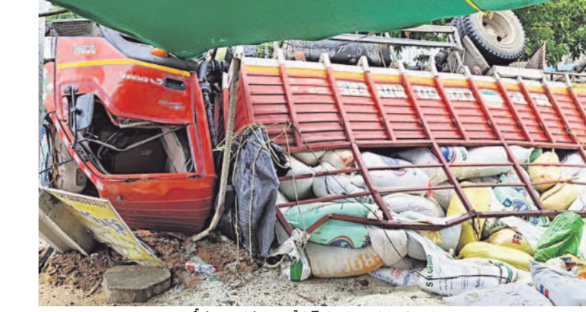
ఇటీవల అక్రమంగా రేషన్ బియ్యం తరలిస్తుండగా సిద్ధిపేట జిల్లా దుద్దెడ వద్ద దోచాడైన డీసీఎం, అందులోని రేషన్ బియ్యం బస్సులు

ప్రజాపంపిణీ వ్యవస్థ ద్వారా ఒక వ్యక్తికి ఆరు కిలోల బియ్యం ప్రభుత్వం ఉచితంగా బియ్యం అందజేస్తున్నది. సిద్ధిపేట జిల్లాలో ప్రతి నెలా 2,91,400 కుటుంబాలకు 884 రేషన్ పావుల ద్వారా నిత్యావసర సరుకులు పంపిణీ చేస్తున్నారు. ఆహార భద్రత కార్య ద్వారా కుటుంబంలోని సభ్యుల సంఖ్యల సంబంధం లేకుం