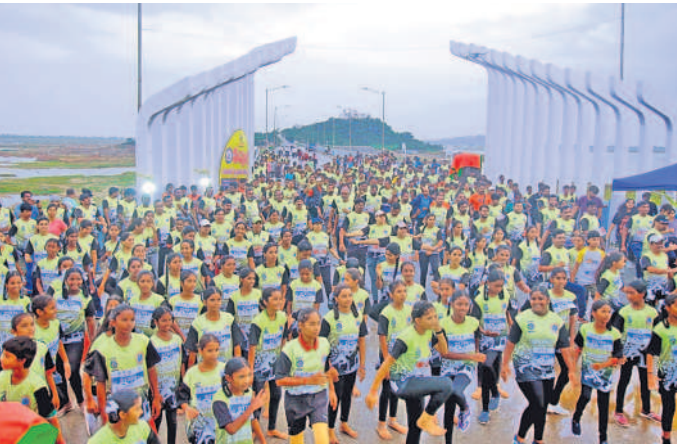
సిద్ధిపేట హాఫ్ మారథాన్ లో పాల్గొన్న రన్నర్స్