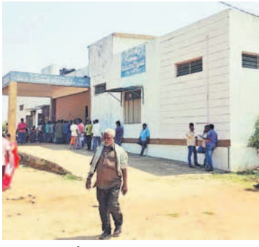
గజ్వేల్ లోని తాత్కాలిక ఆర్టీసీ కార్యాలయం

గజ్వేల్, జూలై 28: గజ్వేల్ లో వాహనదారులకు ఆర్టీసీ అధికారుల సేవలు రెండు రోజులకే పరిమితమయ్యాయి. వారంలో మంగళ, శుక్రవారాల్లో గజ్వేల్ లో ఎంబీఎ అందుబాటులో ఉంటున్నాడు. మిగతా రోజుల్లో వాహనదారులకు ఎలాంటి సేవలున్నా సిద్ధిపేటలోని జిల్లా రవాణా శాఖ కార్యాలయానికి వెళ్లాల్సి వస్తున్నది. డివిజన్ కేంద్రాల్లో ఏర్పాటు చేసిన ఎంబీఎ కార్యాలయాల్లో పూర్తిస్థాయి సేవలు అందుబాటులోకి రాకపోవడంతో వాహనదారులు, ప్రజలు ఇబ్బందులు ఎదుర్కొంటున్నారు. రెండు రోజులే ఎంబీఎలు అందుబాటులో ఉండడంతో వాహనాల రిజిస్ట్రేషన్, డ్రైవింగ్ లైసెన్సులు, మిగతా సేవలకు సిద్ధిపేటకు వెళ్లాల్సి వస్తుండడం వాహనదారులకు ఇబ్బందిగా మారింది. సిద్ధిపేటలోని ఆర్టీసీ కార్యాలయానికి వెళ్లే రోజుంతా ఆక్రమణ నడిచిపోతున్నదని ప్రజలు ఆవేదన వ్యక్తం చేస్తున్నారు. గజ్వేల్ లో