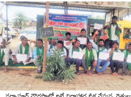
నర్సాపూర్ షాంపూర్ లో లై సెలక్షన్ డీక్ష చేస్తున్న రైతులు