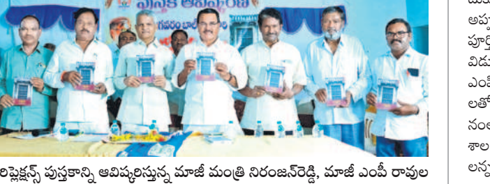
రిఫ్లెక్షన్స్ పుస్తకాన్ని ఆవిష్కరిస్తున్న మాజీ మంత్రి నిరంజన్ రెడ్డి, మాజీ ఎంపీ రావుల