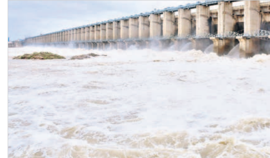
జారాల గేట్ల నుంచి దిగువకు పారుతున్న వరద