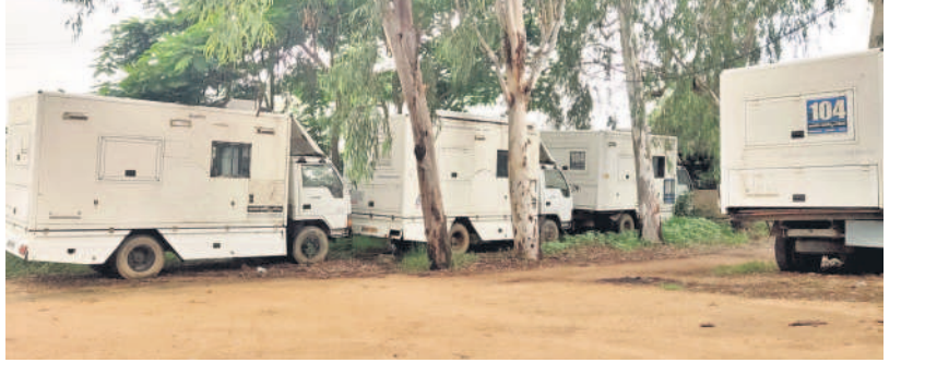
నిరుపయోగంగా 104 వాహనాలు

విద్యుత్ స్తంభం, వైద్యుల చుట్టేసిన తీగచెట్టు నాగర్ కర్నూల్, జూలై 28 : విద్యుత్ అధికారుల నిర్లక్ష్యం కొద్దొచ్చినట్లు కనిపిస్తున్నది. నాగర్ కర్నూల్ జిల్లా కేంద్రం వడిబొడ్డున ఉన్న విద్యుత్ స్తంభాన్ని ఓ చెట్టు తీగ చుట్టేసింది. రాను వేసే ప్రకారంలోనే మంగళ్య షాపింగ్ మార్కెట్ సమీపంలో ప్రధాన రహదారి పక్కనున్న కరెంటు స్తంభంపైకి తీగ అల్లుకున్నది. మెల్లమెల్లా పెరుగుతున్న తీగ అల్లుకున్నది. మెల్లమెల్లా పెరుగుతున్న తీగ అల్లుకున్నది. దీంతో ప్రమాదం పొంది ఉన్నా.. అధికారులు మాత్రం స్పందించడం లేదని స్థానికులు ఆరోపిస్తున్నారు.