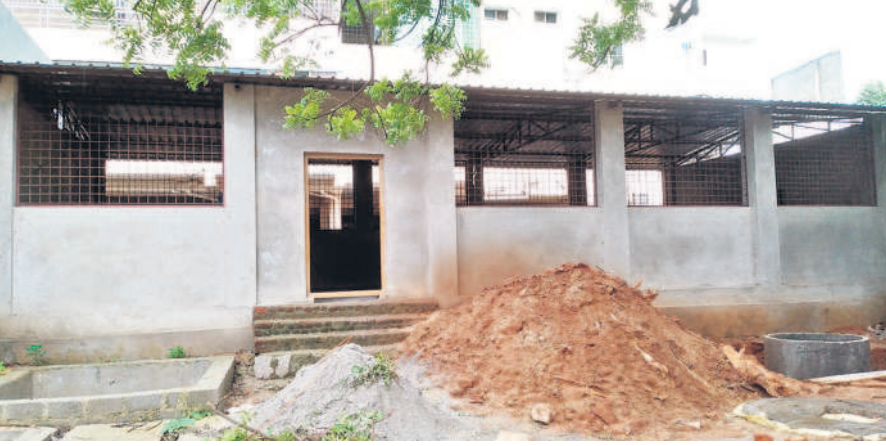
మహబూబ్ నగర్ జిల్లా కేంద్రంలోని టేసిక్ ప్రాజెక్టులో ఉన్నత పాఠశాలలో తుది దశలో ఉన్న డైనింగ్ హాలు

కాంగ్రెస్ ప్రభుత్వం బిల్లుల విడుదలలో జాప్యం చేయడంతో పనులు ముందుకు సాగక పరిణితిలబడ్డాయి. చాలా చోట్ల ఎక్కడి పనులు అక్కడి నిలిచిపోయాయి. కొన్నిచోట్ల తరగతి గదులు కూల్చినేయడం.. కొత్తవి పూర్తి కాకపోవడంతో విద్యార్థులు ఇబ్బందులు ఎదురవుతున్నాయి