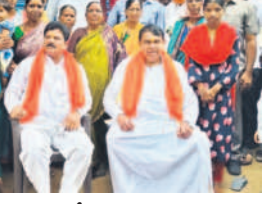
అవసరల్లి 1వ వార్డులో గౌడ కులస్తుల ఆధ్వర్యంలో..