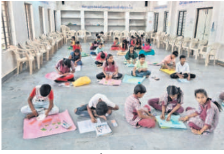
చిత్రలేఖనం పోటీలో పాల్గొన్న విద్యార్థులు