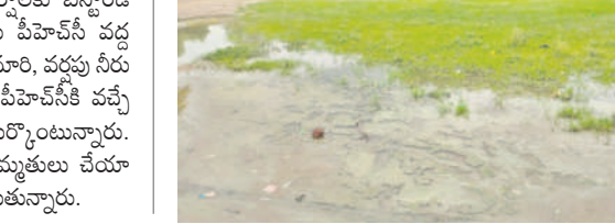
రెంజల్ మండలంలోని కంబకల్లి జిల్లా పరిషత్ ఉర్దూ మీడియం ప్రాథమిక పాఠశాల ఆవరణలో గుంతలు ఏర్పడి, అందులో వర్షపు నీరు నిలిచింది. పిల్లల గడ్డ పెరగడం తోపాటు దోమలు స్త్రోమహారం చేస్తున్నాయి. విద్యార్థులు అనారోగ్యం బారిన పడకముందే సమస్యను పరిష్కరించాలని విద్యార్థుల తల్లిదండ్రులు కోరుతున్నారు.