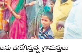
ఎత్తొండలో బోనాలను ఊరేగిస్తున్న గ్రామస్థులు