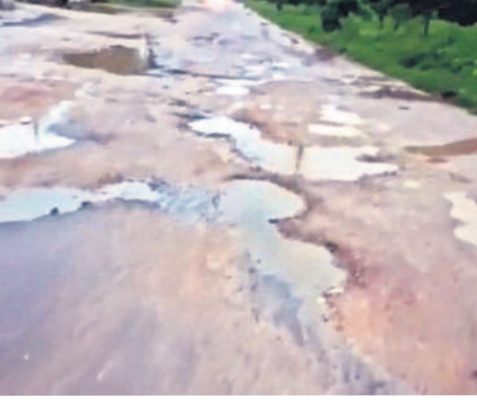
గుంతలమయంగా మారిన చందూర్ - లక్ష్మపూర్ రోడ్డు

పోయింది గ్రామస్థులు వాపోతున్నారు. గత ప్రభుత్వం రోడ్డు మంజూరుకు గ్రీన్ సిగ్నల్ ఇచ్చింది. అప్పట్లో బాన్సువాడ ఎమ్మెల్యే పోచారం శ్రీనివాసరెడ్డి చందూర్ నుంచి జిల్లాలో పరకు రూ. 16 కోట్లతో డబుల్ రోడ్డు నిర్మాణానికి శంకుస్థాపన కూడా చేశారు. అధికారులు కొలతలు చేపట్టడంతో గ్రామస్థులు సంబురపడ్డారు. కానీ ఎన్నికలు రావడంతో రోడ్డు పనులు నిలిచిపోయాయి. ఎన్నికలు ముగిసి నెలలు గడస్తున్నా నేటికీ రోడ్డు పనులు ప్రారంభం కాలేదు. వర్షాకాలంలో ఇబ్బందులు ఎదుర్కొంటున్నామని త్వరగా రోడ్డు పనులు చేపట్టాలని గ్రామస్థులు కోరుతున్నారు.