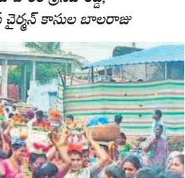
అవసరల్లి 1వ వార్డులో గౌడ కులస్తుల ఆధ్వర్యంలో..