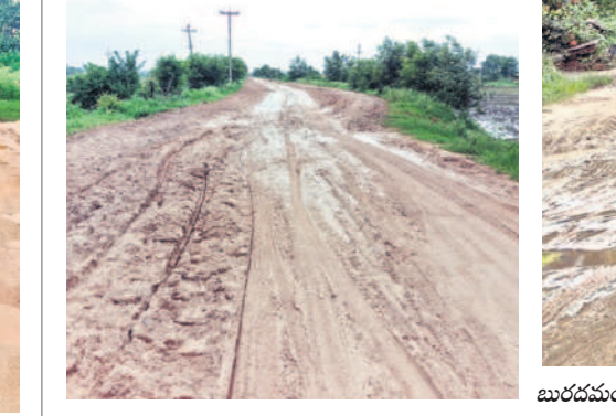
చిత్రేడ్ గా మారిన చినునపల్లి - తాటిపల్లి రోడ్డు

సిరికొండ / రుద్రూర్, జూలై 28 : సిరికొండ మండలంలోని చినునపల్లి - తాటిపల్లి వెళ్లే దారిలో గుడిపేట నుంచి తాటిపల్లి వరకు రోడ్డు చిత్రేడ్ గా మారింది. సిరికొండ నుంచి మేమువాడ, సిరికొండ, శరీరనగర్ కు వెళ్లడంపై వాహనాలు వెళ్తాయి. సిరికొండ నుంచి తాటిపల్లి వరకు డబుల్ లైన్ రోడ్డుచేశారు. మధ్యలో రెండు కిలోమీటర్ల మేర నిలిపివేయడంతో చిన్నపాటి వర్షాలతో రోడ్డు బురద మయంగా మారి, ప్రయాణం కొనసాగించకుండా తయారైంది. దీంతో వనపల్లి మీదుగా రావాల్సి వస్తుందని ప్రయాణికులు అనేకమన్నారు. త్వరగా డిటీ రోడ్డు నిర్మించాలని కోరుతున్నారు.