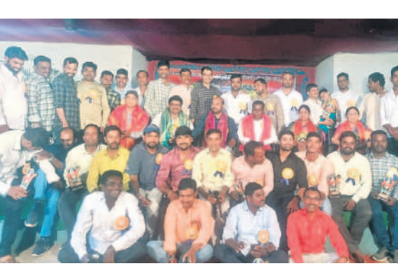
మోసాలోని ప్రభుత్వ పాఠశాలలో 2003-2