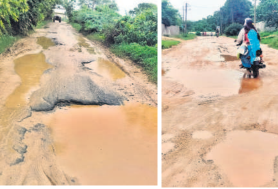
గుంతలమయంగా మారిన ఎత్తొండ - పెంటాకుర్లు రోడ్డు, చిత్రాడిగా మారిన కోటిగిరి ప్రభుత్వ దవాఖాన వెనుక వైపు నుంచి కొత్తపల్లికి వెళ్లే రోడ్డు

కోటిగిరి, జూలై 28 : కోటిగిరి మండలంలోని ఎత్తొండ నుంచి పెంటాకుర్లు ఎక్స్ రోడ్డు గుంతలమయంగా మారింది. ఈ రోడ్డు మీదుగా రోజూ వందలాది మంది ఎత్తొండ, బోధన్, వల్లభాపూర్ కు వెళ్తారు. మోకాటిలోకు గుంతలు పడి, వర్షపు నీరు నిండడంతో ప్రయాణం ప్రమాదకరంగా మారింది. రోడ్డుపై గుంతలు పడి నెలలు గడస్తున్నా అది కారులు పట్టించుకోవడం లేదని వాహనదారులు మండిపడుతున్నారు. అధికారులు మరమ్మతులు చేపట్టాలని కోరుతున్నారు. కోటిగిరి మండలకేంద్రంలోని ప్రభుత్వ దవాఖాన వెనుకవైపు నుంచి కొత్తపల్లికి వెళ్లే రోడ్డు విస్తృతంగా పనిచేయడం మరమ్మతులు చేయాలని మండల ప్రజలు కోరుతున్నారు.