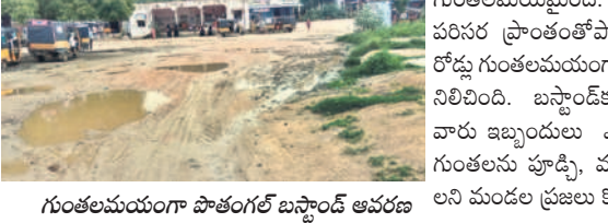
గుంతలమయంగా పాతబస్టాండ్ ఆవరణ

పాతగంట్ల, జూలై 28 : పాతగంట్లలోని బస్టాండ్ ప్రాంగణం వద్ద ఉన్న రోడ్డు పూర్తిగా గుంతలమయమైంది. వర్షాలకు బస్టాండ్ పరిసర ప్రాంతంలోపాటు పీహెచ్ సి వద్ద రోడ్డు గుంతలమయంగా మారి, వర్షపు నీరు నిలిచింది. బస్టాండ్ కు, పీహెచ్ సి వచ్చే వారు ఇబ్బందులు ఎదుర్కొంటున్నారు. గుంతలను పూడ్చి, మరమ్మతులు చేయాలని మండల ప్రజలు కోరుతున్నారు.