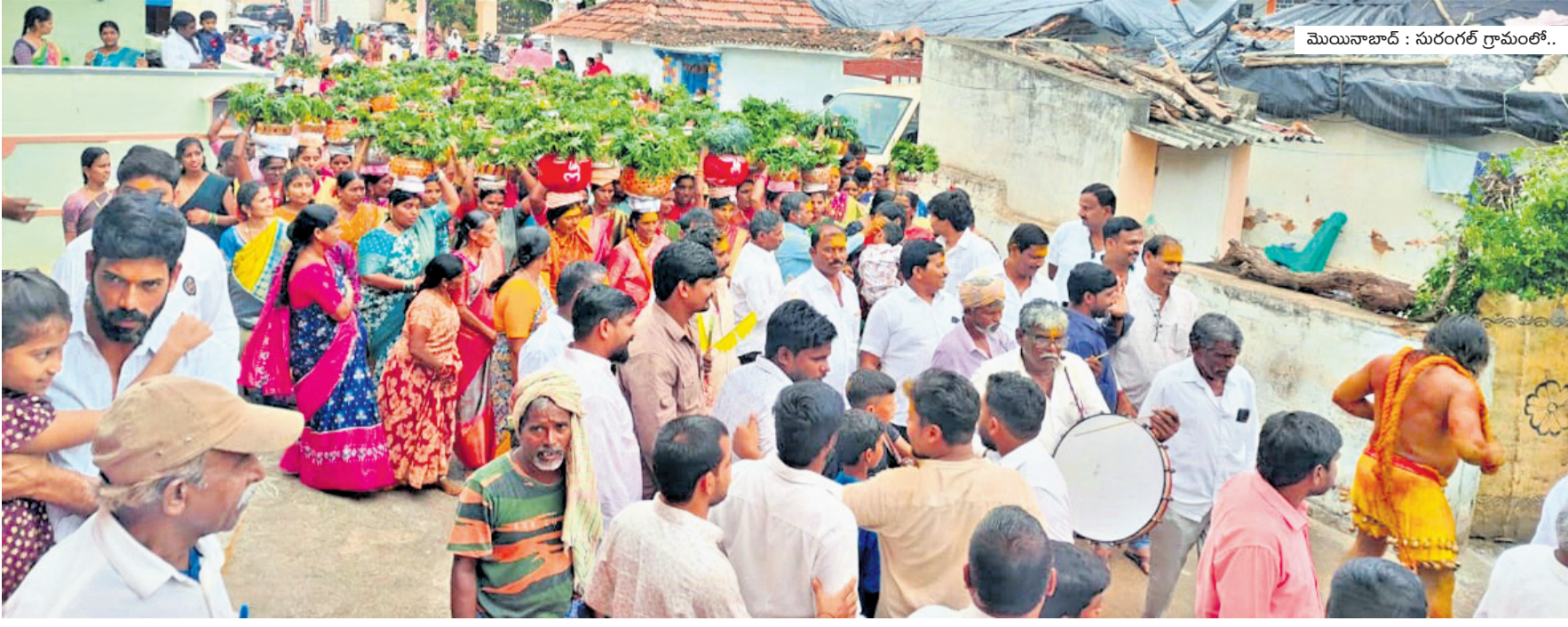
మొయినాబాద్ : సురంగల్ గ్రామంలో..