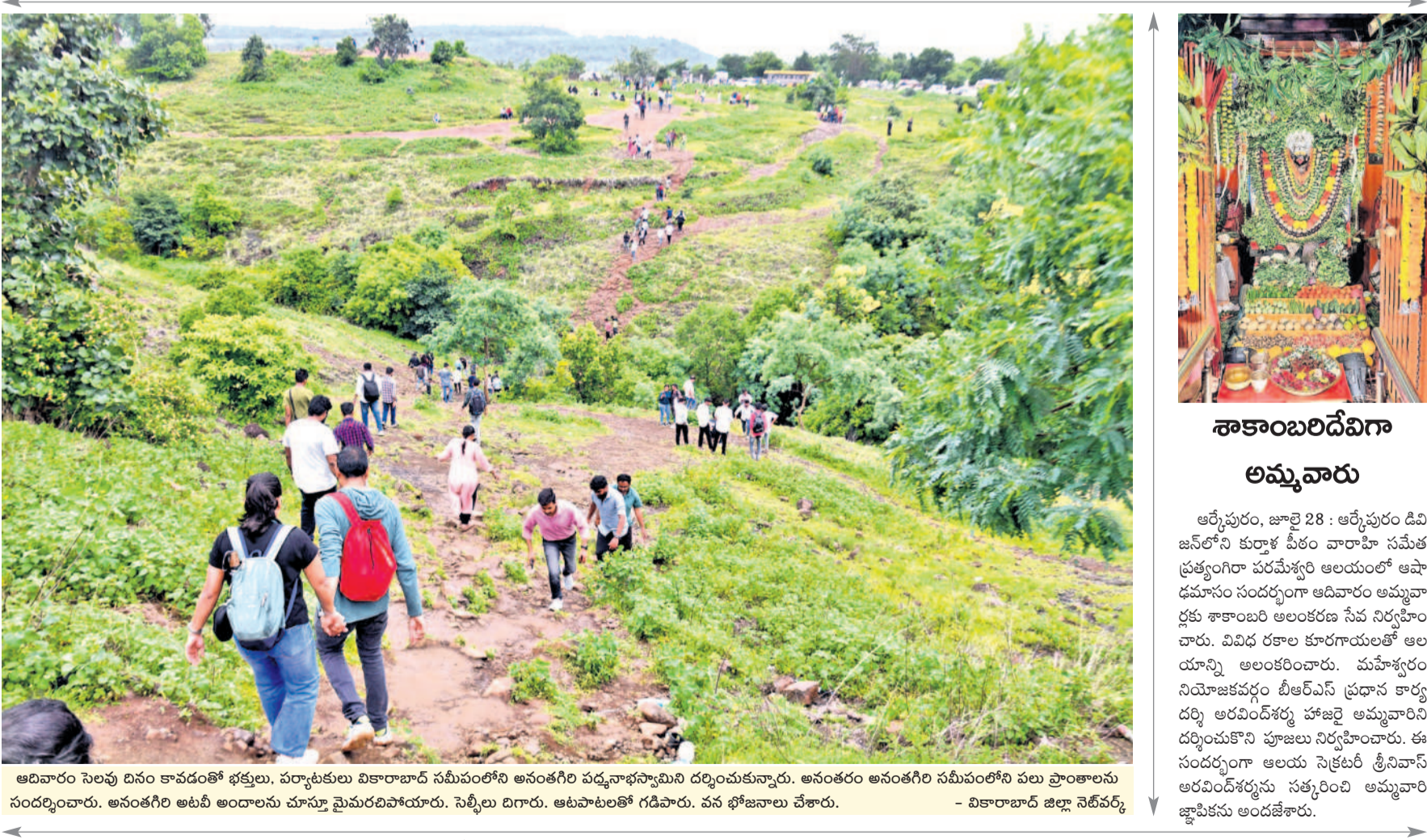
ఆదివారం సెలవు దినం కావడంతో భక్తులు, పర్యాటకులు వికారాబాద్ సమీపంలోని అనంతగిరి పద్మాభయస్వామి దర్శించుకున్నారు. అనంతరం అనంతగిరి సమీపంలోని వలు ప్రాంతాలను సందర్శించారు. అనంతగిరి అటవీ అంధారల మార్పు మైమరచిపోయారు. సెల్ఫీలు దిగారు. అటవీలతో గడిచారు. వన భోజనాలు చేశారు. - వికారాబాద్ జిల్లా నెట్వర్క్