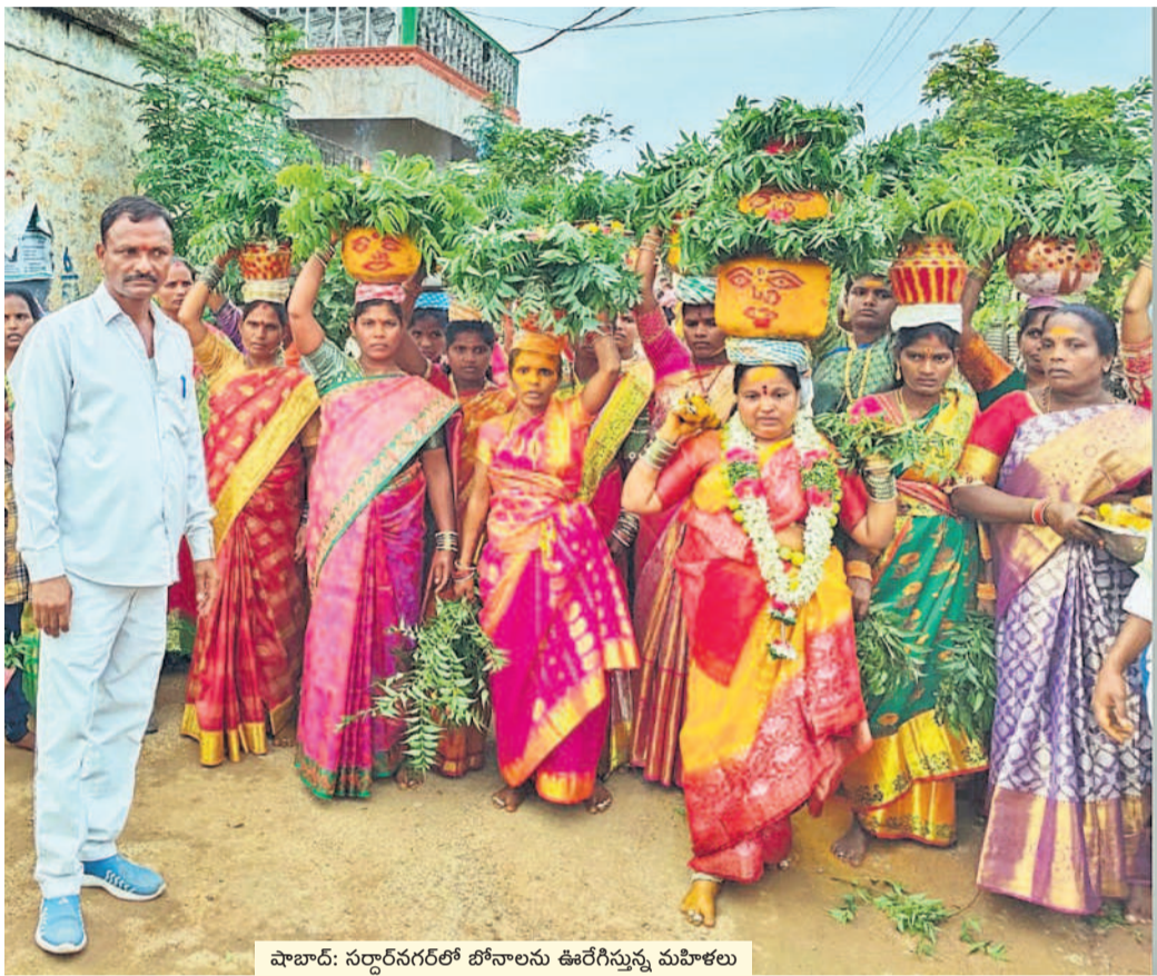
షాద్ నగర్లో : సర్దార్ నగర్లో బోనాలను ఊరేగిస్తున్న మహిళలు