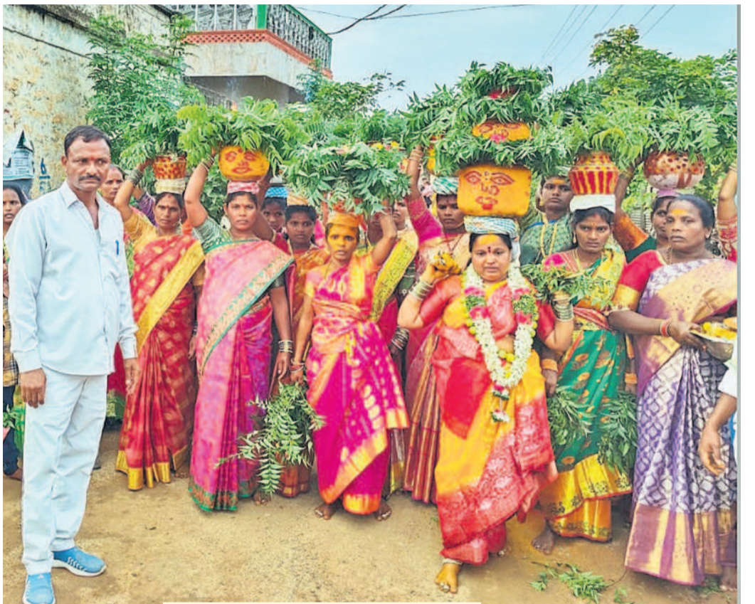
షాద్ నగర్లో : సర్దార్ నగర్లో బోనాలను ఊరేగిస్తున్న మహిళలు