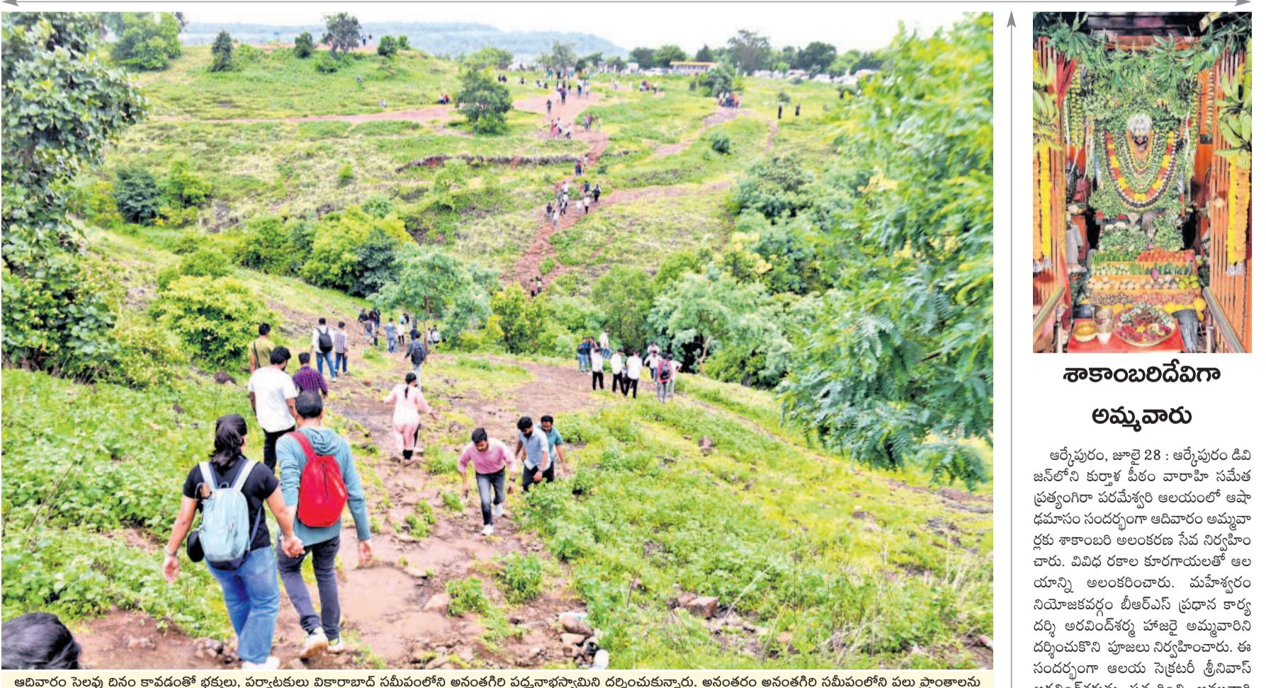
ఆదివారం సెలవు దినం కావడంతో భక్తులు, పర్యాటకులు వికారాబాద్ సమీపంలోని అనంతగిరి పద్మాభస్మామిని దర్శించుకున్నారు. అనంతరం అనంతగిరి సమీపంలోని వలు ప్రాంతాలను సందర్శించారు. అనంతగిరి అటవీ అంధారాలను చూస్తూ మైమరచిపోయారు. సెల్ఫీలు దిగారు. అటవీలతో గడిచారు. వన భోజనాలు చేశారు.