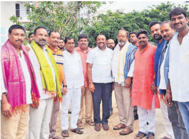
షాద్ నగర్లో : పట్టణంలో నిర్వహించిన బోనాల ఉత్సవాల్లో ఎమ్మెల్యే నవీన్ కుమార్ రెడ్డి, మాజీ ఎమ్మెల్యే అంజయ్యయ్యదవ్, మున్సిపల్ చైర్మన్ కొండూరి సరేందర్ తదితరులు