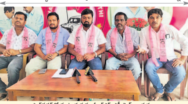
షాద్ నగర్లో మాట్లాడుతున్న బీఆర్ఎస్ ఎస్సీ సెల్ నాయకులు