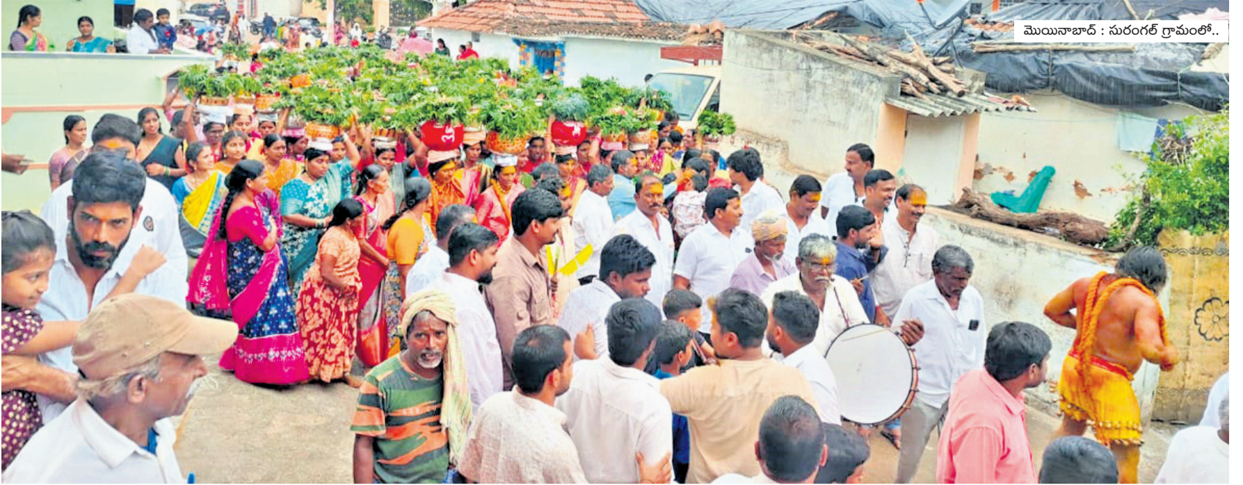
మొయినాబాద్ : సురంగల్ గ్రామంలో..

సిటీబ్యూరో, జూలై 28 (నమస్తె తెలంగాణ): పెండింగ్లో ఉన్న ల్యాండ్ పూలింగ్ను వేగవంతం చేసేలా కార్యాచరణ రూపొందించాలని రాష్ట్ర సర్కారు హెచ్చింపింది. భూ సేకరణ ప్రక్రియలో ఉన్న పురోగతి, భూముల అభివృద్ధి అంశాల్లో ప్రత్యేక నివేదికను హెచ్చింపింది తయారు చేయనుంది. రైతుల నుంచి భూములను సేకరించి డివైలప్ చేయడం ద్వారా తన వాటాగా వచ్చిన భూములను విక్రయించేలా హెచ్చింపింది ప్రభాకర్ తండ్రి అయి చేయనుంది. ఆధారంగా హెచ్చింపింది పరిధిలో ల్యాండ్ పూలింగ్ వేగవంతం చేయడం వలన మార్కెట్లో ప్రభావం చూపేలా కార్యాచరణకు ప్రభుత్వం సిద్ధమైంది. ఇటీవల తెలంగాణ