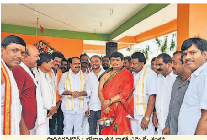
షాద్ నగర్లో : బోనాల ఉత్సవాల్లో ఎమ్మెల్యే శంకర్