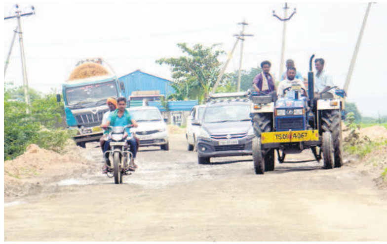
గుంతల రోడ్డుపై వెళ్తున్న వాహనాలు