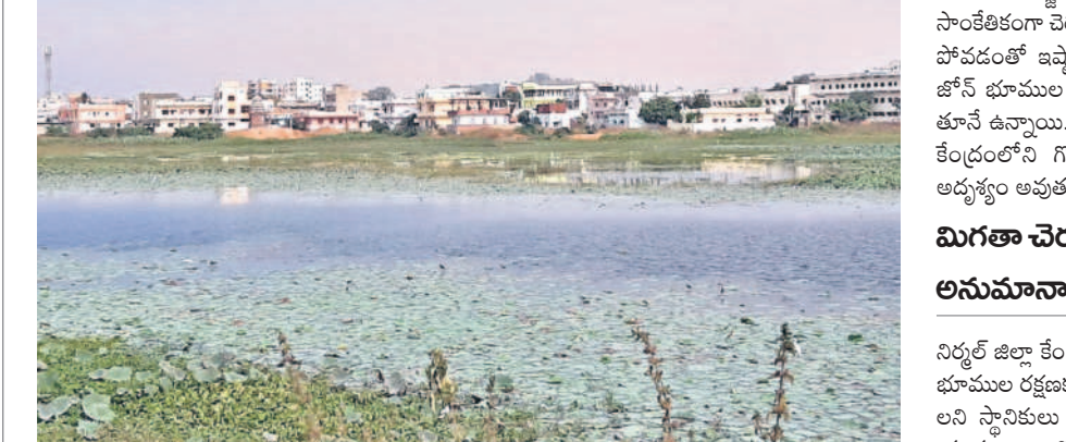
నిర్మల్లోని ధర్మసాగర్ చెరువు

నిర్మల్, జూలై 29 (నమస్తే తెలంగాణ) : నిర్మల్ జిల్లా కేంద్రంలోని చారిత్రక గొలుసుకట్టు చెరువుల రక్షణ కోసం సంబంధిత అధికారులు కొద్ది రోజుల క్రితం డీజీపీఎస్ (డిజిపిఎస్) గోపల్ పాణిగ్రాహిని నిర్మల్ సర్వేను తెరవేసి తెచ్చారు. ఈ డీజీపీఎస్ పరికరం శాలి లైట్తో అనుసంధానమై భూముల హద్దులను చూపగూగూ నిర్ధారిస్తున్నది. ముఖ్యంగా చెరువు భూముల విస్తీర్ణాన్ని కచ్చితత్వంతో కొలిచేందుకు ఈ పరికరం ఉపయోగకరంగా ఉంటుందని అధికారులు వెల్లడించారు. దీని సర్వే ఆధారంగా చెరువుల శిఖం, ఎక్స్ఎల్, బఫర్ జోన్ భూములకు రక్షణ ఏర్పడుతుందని అధికారులు ప్రకటించారు. ఇటీవలే ఈ డీజీపీఎస్ పరికరాన్ని శాలిలైట్తో అనుసంధానం చేసి ఇక్కడే రెండు చెరువు భూముల సర్వే పూర్తి చేశారు. ప్రస్తుతం ఉన్న రికార్డులకు అనుగుణంగా భూములను అప్పటి జిల్లా కలెక్టర్ నేతృత్వంలో సంయుక్తంగా చేపట్టారు. అయితే ఈ పద్ధతిలో సర్వేను కేవలం రెండు చెరువులకు మాత్రమే పరిమితం చేసి, మిగతా పది చెరువుల సర్వే చేపట్టక