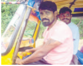
కూలీలు రాజకీయంగా అనాదిగా అణగారిన బడుతున్నారు. పదవుల కేటాయింపుల్లో తీరని అన్యాయానికి గురవుతున్నారు. ఇప్పటికైనా న్యాయం చేయాలి. ఈ విషయంలో ఎల్లీ పరిస్థితుల్లో వెనక్కి తగ్గేది లేదు. ఆవసరమైన ఉద్యమాలు చేసేందుకు బీసీలు సిద్ధంగా ఉన్నారు.

జైన్ మండలంలోని తర్లం బ్రిడ్జి పాడయినప్పటి నుంచి బేల, జైన్ మండలాల నుంచి ఆర్డీ, లాండ సాగ్స్ మీదుగా ఆటోలు నడుస్తున్నాయి. సీసీబి క్రాస్ రోడ్డు ఆదిలాబాద్ వరకు రోడ్డుపై వెళ్లి, వెళ్లి గుంతల్లో నీరు నిలుస్తున్నది. ఆటోలో ప్రయాణికులను ఇదే పరిస్థితి ఉంటే ఎప్పుడూ ఏమీ జరుగుతుందో అని భయపడుతున్నారు. ఏడాది నుంచి ఇదే పరిస్థితి ఉంది. గుంతల నుంచి ఆటో పోతుండడంతో రోజూ రివేల్ చేయాల్సి వస్తుంది. దీంతో మూడు ఉపాధి లేకుండా పోతుంది.