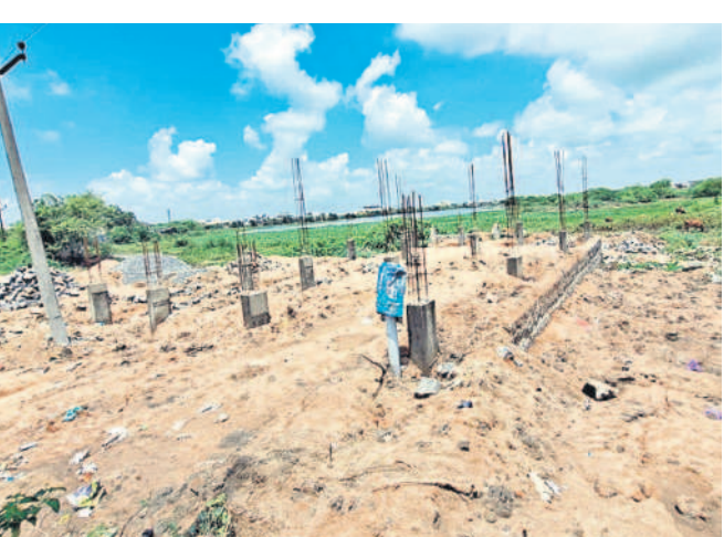
భాగ్యనగర్ చెరువు శిఖంలో ఇంటి నిర్మాణం కోసం పెట్టిన పేసిన ఆక్రమణలు

నిర్మల్, జూలై 29 (నమస్తే తెలంగాణ) : నిర్మల్ జిల్లా కేంద్రంలోని చారిత్రక గొలుసుకట్టు చెరువుల రక్షణ కోసం సంబంధిత అధికారులు కొద్ది రోజుల క్రితం డీజీపీఎస్ (డిజిపిఎస్) గోపల్ పాణిగ్రాహిని నిర్మల్ సర్వేను తెరవేసి తెచ్చారు. ఈ డీజీపీఎస్ పరికరం శాలి లైట్తో అనుసంధానమై భూముల హద్దులను చూపగూగూ నిర్ధారిస్తున్నది. ముఖ్యంగా చెరువు భూముల విస్తీర్ణాన్ని కచ్చితత్వంతో కొలిచేందుకు ఈ పరికరం ఉపయోగకరంగా ఉంటుందని అధికారులు వెల్లడించారు. దీని సర్వే ఆధారంగా చెరువుల శిఖం, ఎక్స్ఎల్, బఫర్ జోన్ భూములకు రక్షణ ఏర్పడుతుందని అధికారులు ప్రకటించారు. ఇటీవలే ఈ డీజీపీఎస్ పరికరాన్ని శాలిలైట్తో అనుసంధానం చేసి ఇక్కడే రెండు చెరువు భూముల సర్వే పూర్తి చేశారు. ప్రస్తుతం ఉన్న రికార్డులకు అనుగుణంగా భూములను అప్పటి జిల్లా కలెక్టర్ నేతృత్వంలో సంయుక్తంగా చేపట్టారు. అయితే ఈ పద్ధతిలో సర్వేను కేవలం రెండు చెరువులకు మాత్రమే పరిమితం చేసి, మిగతా పది చెరువుల సర్వే చేపట్టక