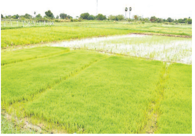
సీద్దిపేట జిల్లా మల్లన్నసాగర్ రిజర్వాయర్ కింద ముదిరిన నారుమట్ల. కాంగ్రెస్ ప్రభుత్వం రిజర్వాయర్ నింపక పోవడంతో నీళ్లు లేక రైతులు వలసలు వెయ్యలేదు. దీంతో ముదిరిపోయిన వలసలు.

కూడవెల్లి, హల్దివాగుకు ఒక్కో టీఎంసీ విడుదల చేయకపోతే రైతులతో ముట్టడి వంటేరు హెచ్చరిక