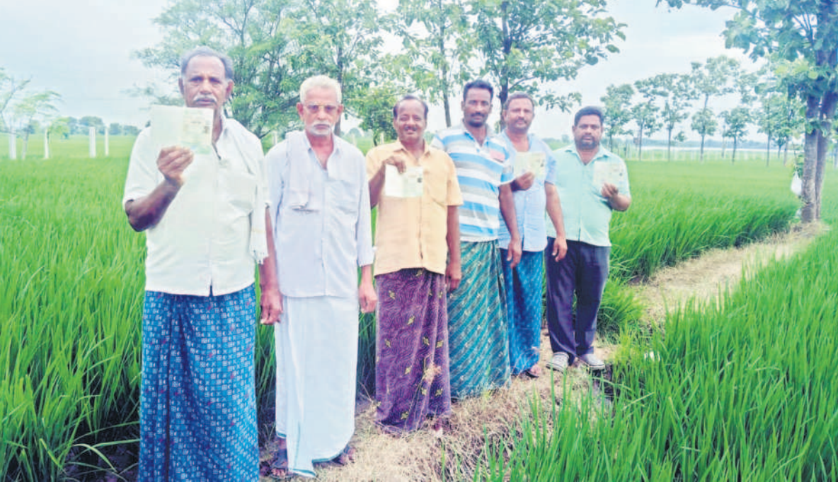
దండీగుట్టలో రుణమాఫీ కాలేదని పానెలుకుట్లు మాఫీస్తున్న రైతులు