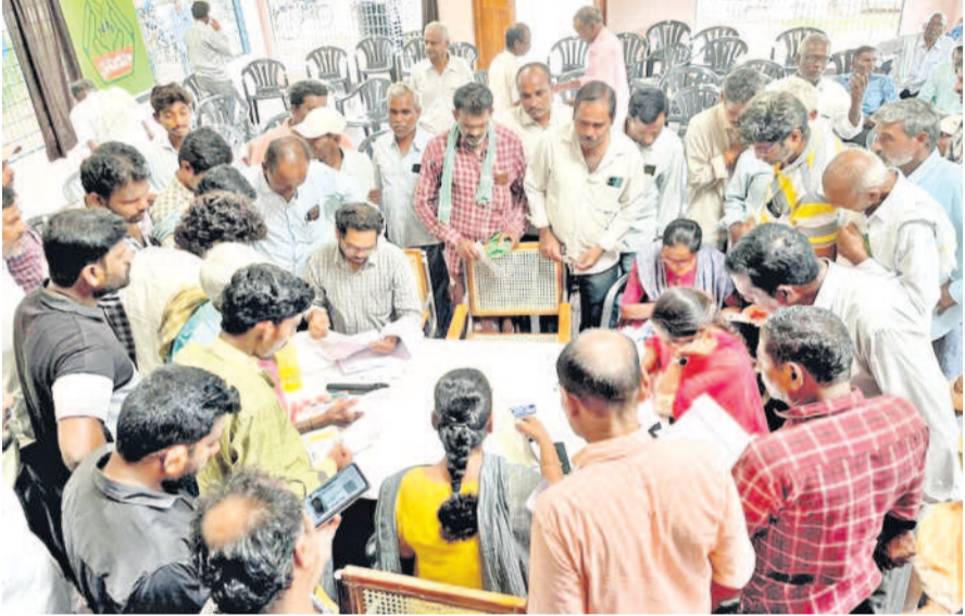
తిమ్మాపూర్: రెండో విడుదలలోనూ మాఫీ కాకపోవడంతో రైతులు ఆందోళన చెందుతున్నారు. మంగళవారం శంకరపట్నం రైతు వేదికలో వ్యవసాయ శాఖ అధికారులను కలిసి విన్నవించుకున్నారు. తమకు ఎందుకు మాఫీ కాలేదని అడిగి ప్రయత్నం చేశారు. అధికారులు జాబితాను పరిశీలించి, రైతుల నుంచి దరఖాస్తులు స్వీకరించారు.

• రెండు విడుదలలోనూ మెజార్టీ రైతులకు నిరాశే • బ్యాంకు, వ్యవసాయ అధికారుల చుట్టూ ప్రదర్శనలు • మండిపడుతున్న కర్షకులు