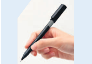
సామాన్య (వ్యాసభర్త: సినియర్ జర్నలిస్టు)

జెందా రంగు మానీ, నమ్మకం పెంచుకొని అంగుటితో మీకు నోకొత్తి గెలుపులో తేలిపోతేవి మూసాచ్చి కాకపోయే కందువా రంగు మాలినివి ముందు చెప్పాలి గదనే నా ముఖం ముందు వచ్చే పని లేకపోవచ్చు, రాకపోవచ్చు నీ ముఖం లోమ్ము ఎక్కడ పెట్టాలో నాకు తెలుసన్నా!