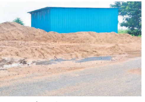
షెట్ల గ్రామంలో డంపి చేసిన ఇసుక

పుల్లూర్, బీర్కూర్ మండలంలోని చించెల్లి, డోంగి మండలంలోని ఖుర్లా, మల్లపూర్ వెమ్మి గ్రామాల్లో కొంతకాలం క్రితం టిప్పర్లను కొంతమంది ట్రాక్టర్లలో తరలింపి దగ్ధంగా విక్రయిస్తున్నారు. హాస్పల్ సమీపంలోని మంజీర్ నుంచి తరలిస్తున్న ఇసుకను పార్లండా మెయిన్ రోడ్డుపై డంపింగ్ చేసి రాత్రివేళల్లో టిప్పర్లు, లారీల్లో రవాణా చేస్తున్నారు. 5వ నంబర్ క్వారీ నుంచి తరలివచ్చిన ఇసుకను బిమ్మంపడ మండలం కేంద్రంలోని జ్యోతిషా పూల్ సూల్ వెనుక భాగం గట్టు ప్రాంతంలో డంపి చేస్తూ అక్కడ వేళ్లతో కట్టటం, మహారాష్ట్ర హైదరాబాద్ లాంటి ప్రాంతాలకు టిప్పర్లలో సాగంపుతున్నారు. ఒక్కో టిప్పర్ ఇసుక రూ. 50 వేల చొప్పున వసూలు చేస్తూ లక్షలు అక్రమంగా సంపాదించుతున్నారు.