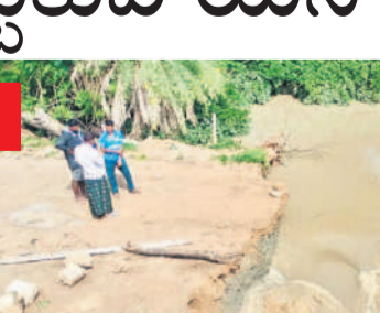
షెట్ల గ్రామంలో డంపి చేసిన ఇసుక