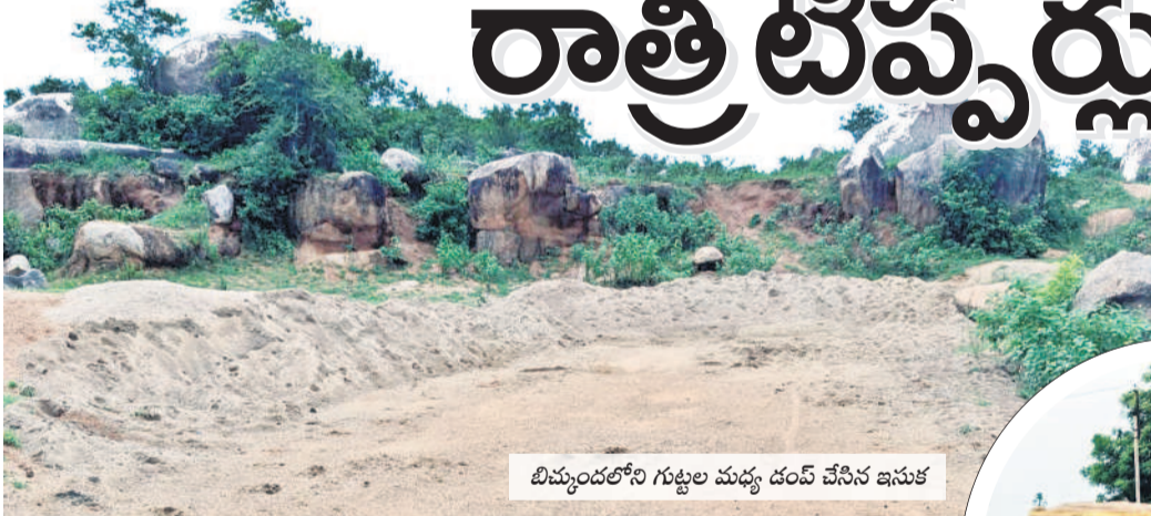
బిమ్మంపడలోని గుట్టల మధ్య డంపి చేసిన ఇసుక

బాసవూడ, జూలై 31: ప్రజలకు ఇసుక అందుబాటులో లేకపోవడంతో నిర్మాణ రంగం దెబ్బతింటుందనే ఉద్దేశంతో ప్రభుత్వం ఇసుక లభ్యత ఉన్న చోట రీవేలను ఏర్పాటు చేసి రవాణాకు అనుమతులు ఇచ్చింది. పేద ప్రజల ఇంట్లకు పనులు మద్దల్లో ఆగిపోకుండా ఉచితంగా ఇసుక అందిస్తామని ఉద్దేశంతో కొన్ని క్వారీలకు అనుమతి ఇవ్వగా.. ఇదే ఆసరాగా చేసుకొని కొంతమంది అక్రమార్కులు ఇసుక దోపిడీకి తెరలేపారు. డివిజన్లోని డోంగి, బీర్కూర్, బిమ్మంపడ తదితర మండలాలలోని సమీప