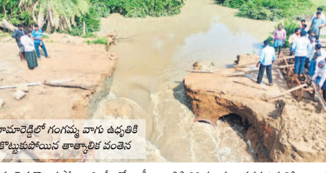
రామాంబెల్లో గంగమ్మ వాగు ఉద్ధృతికి కొట్టుకుపోయిన తాత్కాలిక వంతెన

ధర్మల్ గ్రామం, జూలై 31: వాగులపై వంతెనల నిర్మాణంలో జాప్యం ఏర్పడడంతో వాగులపై ప్రజలకు ఇబ్బందులు తప్పడం లేదు. వాగులు పారి వంతెనల వద్ద నిర్మించిన తాత్కాలిక రోడ్లు కొట్టుకుపోతున్నాయి. దీంతో గ్రామాల మధ్య రాకపోకలకు నిలిచి ప్రజలు అవ్వలను పడుతున్నారు. నిజామాబాద్ జిల్లా ధర్మల్ మండలంలోని వాడీ-హాన్సాజీపేట్ గ్రామాలకు బుద్ధవారం తెల్లవారుజాము నుంచి రాకపోకలు నిలిచిపోయాయి. వాడీ సమీపంలో ప్రధాన వాగుపై బ్రిడ్జి నిర్మాణ పనులు చేపట్టారు. అందుకోసం పక్కనే సిమెంట్ బ్లాక్లను వేసి తాత్కాలిక వంతెనను ఏర్పాటు చేశారు. గత రెండు రోజులుగా కురిసిన భారీ వర్షంతో వాగులో ప్రవాహం ఎక్కువై తాత్కాలిక