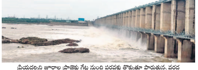
ప్రియదర్శిని జూరాల ప్రాజెక్టు గేట్ల నుంచి పరవళ్లు తొక్కుతూ పారుతున్న చరద

అవుట్ ఫ్లో 1,58,040 క్యూసెక్కులు నమోదైంది. 105.788 టీఎంసీల సామర్థ్యం కలిగిన డ్యాంంలో ప్రస్తుతం 97.945 టీఎంసీల నీటిని నిల్వ ఉన్నది. 1,633 అడుగుల నీటిమట్టానికి గానూ ప్రస్తుతం 1,631.02 అడుగులు ఉన్నది. ఆర్డీఎస్ ఆనకట్టకు 48,370 క్యూసెక్కులు ఇన్ ఫ్లో ఉండగా, 47,800 క్యూసెక్కుల వరకు నీరు సుంకేసుల బ్యారేజీకి చేరుతున్నది. ఆర్డీఎస్ ఆయకట్టుకు 570 క్యూసెక్కులు విడుదల చేస్తుండగా ప్రస్తుతం ఆనకట్టలో 11 అడుగుల మేరకు నీటిమట్టం ఉన్నది. కర్ణాటకలోని ఆల్టర్నేట్ ప్రాజెక్టులోకి ఇన్ ఫ్లో 3,50,000 క్యూసెక్కులు చేరుతుండగా, అవుట్ ఫ్లో 3,50,000 నమోదైంది. నారాయణపూర్ ప్రాజెక్టుకు ఇన్ ఫ్లో 3,35,000 క్యూసెక్కులు ఉండగా, అవుట్ ఫ్లో 3,33,740 క్యూసెక్కులు నమోదైనట్లు ప్రాజెక్టు అధికారులు తెలిపారు.