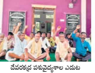
దేవరకల్లు పశువైద్యశాల ఎదుట నిరసన తెలుపుతున్న గోరెల కాపరులు

పశువైద్యశాల ఎదుట గోరెల కాపరుల ఆందోళన దేవరకల్లు, జూలై 31 : పశువైద్యశాలలో మందులు అందుబాటులో ఉంచాలని గోరెల కాపరులు డిమాండ్ చేశారు. బుధవారం దేవరకల్లు పశువైద్యశాల ఎదుట గోరెల కాపరులు ఆందోళన నిర్వహించారు. ఈ సందర్భంగా వారు మాట్లాడుతూ మండల కేంద్రంలోని పశువైద్యశాలలో పశువులు, గోరెలకు మందులు లేకపోవడంతో మృత్యువాక పడుతున్నాయని ఆవేదన వ్యక్తం చేశారు. ఉన్నతాధికారులైనా సుం దించి పశువైద్యశాలలో మందులు అందుబాటులో ఉంచాలని లేనో