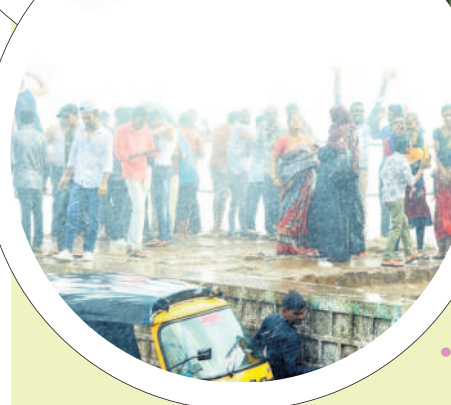
బళ్లంత.. బళ్లంత.. కావాలిలే..