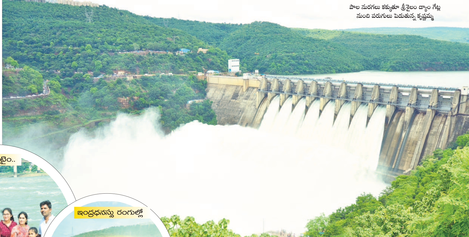
పాల నురగులు కక్కుతూ శ్రీశైలం డ్యాం గేట్ల నుంచి పరుగులు పెడుతున్న కృష్ణమ్మ