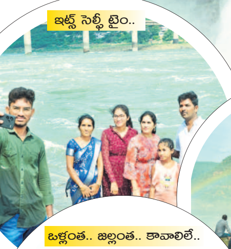
ఇట్ల సెట్టి టైం..

వనపర్తిలోనే అత్యధిక డబుల్ బెడ్రూం ఇండ్ల నిర్మాణాలు మాజీ మంత్రి సింగిరెడ్డి నిరంజన్ రెడ్డి పెళ్ళేరు, జూలై 31 : పేదలకు బీఆర్ఎస్ పనిచేయడంలో మంజూరు చేయించిన డబుల్ బెడ్రూం ఇండ్ల నిర్మాణాలను త్వరగా పూర్తి చేయించాలని మాజీ మంత్రి సింగిరెడ్డి నిరంజన్ రెడ్డి డిమాండ్ చేశారు. పెళ్ళేరు మండలంలోని పాతపల్లి, గుమ్మడం గ్రామాల్లో నిర్మిస్తున్న డబుల్ బెడ్రూం ఇండ్లను బుధవారం ఆయన పరిశీలించారు. ఈ సందర్భంగా మాట్లాడుతూ తాను మంత్రిగా ఉన్న సమయంలో అప్పటి సీఎం కేసీఆర్ ను ఒప్పించి గజెట్ తరహాలో చివరి నియోజకవర్గంలో అత్యధిక డబుల్ బెడ్రూం ఇండ్లను మంజూరు చేయించానన్నారు. ఈ నేపథ్యంలోనే గుమ్మడం గ్రామానికి వంద కేంద్ర మంజూరు కాగా పాటి పనులు చివరి దశ ఉన్నాయన్నారు. పాతపల్లి యాద్రే ఇండ్ల మంజూరు కాగా, అవి సాఫీ చరకు వచ్చి నిలిచిపోయాయని తెలిపారు. ప్రస్తుత కాంగ్రెస్ ప్రభుత్వం కొంట్రాక్టర్లకు బిల్లులు చెల్లించినందున ఎక్కడి పనులు అక్కడి