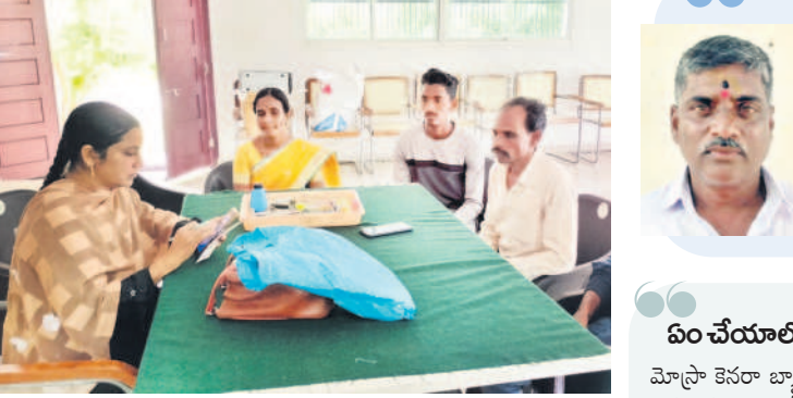
రుణమాఫీ కార్యక్రమం గురువారం కోటిగిరి రైతువేదికకు వచ్చి ఆరా తీస్తున్న రైతులు.. ఆన్లైన్లో వివరాలు చెక్ చేస్తున్న ఏకాంశ్

బోధన్ రూరల్ / నాగిరెడ్డిపేట, ఆగస్టు 1: రుణమాఫీ ప్రక్రియలో తీవ్ర గందరగోళం నెలకొన్నది. రెండో విడుదలలోనూ అర్హులైన వేలాది మందికి నిరాశ మిగిలింది. రెండు విడుదలల్లో కలిపి రూ.లక్షలకు లోపు పంట రుణాలు మాఫీ చేస్తున్నట్లు సర్కారు ప్రకటించింది. కానీ కొందరికే మాఫీ వర్తిండా, చాలా మందికి ఆశోకంపే ఎదురైంది. క్షేత్ర స్థాయిలో పరిశీలిస్తే లక్షలకు కాదు కదా.. రూ.30-40 వేల లోపు ఉన్న వారు మంచి రైతుల లోపు మాఫీ కాలేదు. పట్టా పాస్ బుక్, ఆదార్, రేషన్ కార్డు వివరాలన్నీ సరిగా ఉన్నప్పటికీ వారి పేరు జాబితాలో లేదు. దీంతో ఏం చేయాలో తోచక బ్యాంకులు, ఆఫీసుల చుట్టూ చక్కర్లు కొడుతున్నారు. అటు బ్యాంకుల్లో, ఇటు అధికారుల నుంచి సరైన సమాధానం దొరకక, కాంగ్రెస్ పాలనలో గిట్టిన ఉంటుందిని నిరాశగా వెనుదిరుగుతున్నారు.