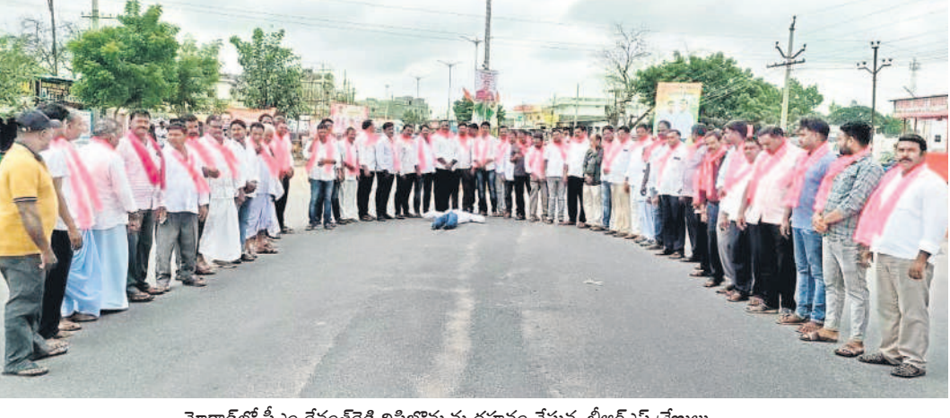
మార్కెట్లో సీఎం రేవంత్ రెడ్డి దిష్టిబొమ్మను దూసిన చోట, బీఆర్ఎస్ శ్రేణులు