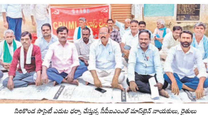
సిరికొండ సాస్టెట్ ఎదుట ధర్నా చేస్తున్న సీపీఐఎంఎల్ మాన్లైన్ నాయకులు, రైతులు