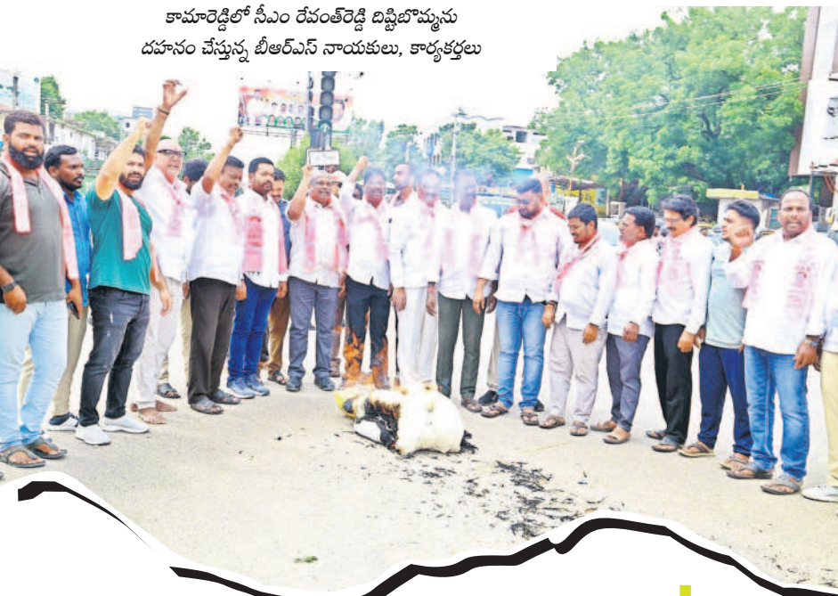
కామారెడ్డిలో సీఎం రేవంత్ రెడ్డి దిష్టిబొమ్మను దూసిన చోట, బీఆర్ఎస్ నాయకులు, కార్యకర్తలు