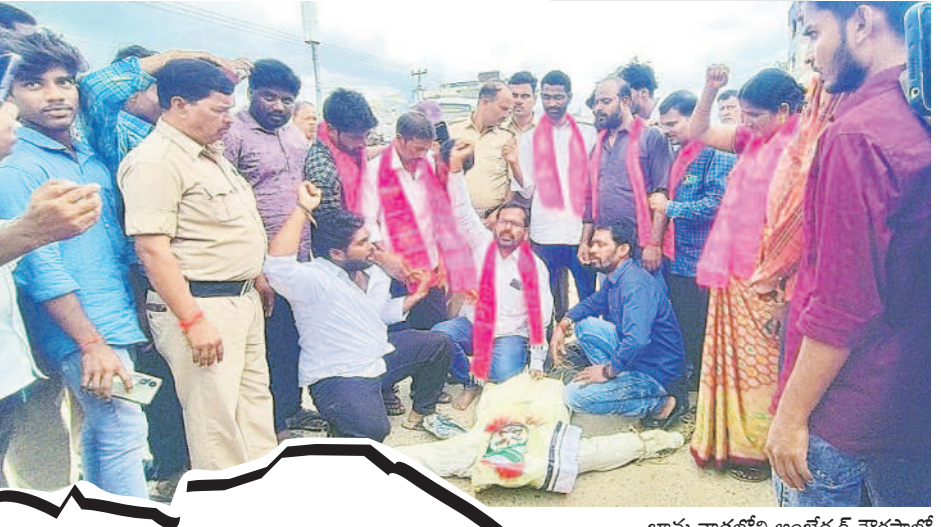
బాన్సువాడలోని అంబేద్కర్ వారసాలో సీఎం దిష్టిబొమ్మతో నిరసన తెలుపుతున్న బీఆర్ఎస్ నాయకులు

సీఎం రేవంత్ రెడ్డి, డిప్యూటీ సీఎం మల్లు భట్టి విక్రమార్క మహిళా ఎమ్మెల్యేల పట్ల చేసిన అసభిత వ్యూహాలపై గురువారం ఉమ్మడి జిల్లాలో నిరసనలు వెల్లువెత్తాయి. బీఆర్ఎస్ పేరుకు నిజామాబాద్, కామారెడ్డి జిల్లాల్లో ఆందోళన కార్యక్రమాలు నిర్వహించారు. మాజీ మంత్రులు సబితా ఇంద్రారెడ్డి, సుసీతా క్యారెడ్డి రేవంత్, భట్టి చేసిన వ్యూహాలను వెనక్కి తీసుకోవాలని డిమాండ్ చేస్తూ సీఎం దిష్టిబొమ్మలను దూసిన చోట. బోధన్లో రేవంత్ రెడ్డి దిష్టిబొమ్మను తయారు చేస్తుండగా, పోలీసులు వచ్చి దాన్ని లాక్కెళ్లిపోయారు. కామారెడ్డి, ఆర్కాట్, బాల్కొండ, బోధన్, బాన్సువాడ, నదాశివగర్, కమ్మరపల్లి, మార్కెట్, భీమగల్లో సీఎం దిష్టిబొమ్మలను దూసిన చోట. - కామారెడ్డి / బోధన్, ఆగస్టు 1