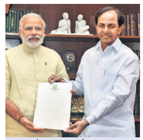
2016లో ప్రధానిని కలిసి ఎన్టీ వర్గీకరణ నమోదును పరిష్కరించాలని విన్నవించిన అప్పటి సీఎం కేసీఆర్

వర్గీకరణకు కేసీఆర్ బాసట • పోరాటానికి ఆది నుంచి బీఆర్ఎస్ అండ > 6 • రాష్ట్ర ఏర్పాటు వెంటనే అసెంబ్లీ ఏకకీ వ తీర్మానం • ఎన్టీ వర్గీకరణ కోరుతూ ప్రధానికి కేసీఆర్ వినతి