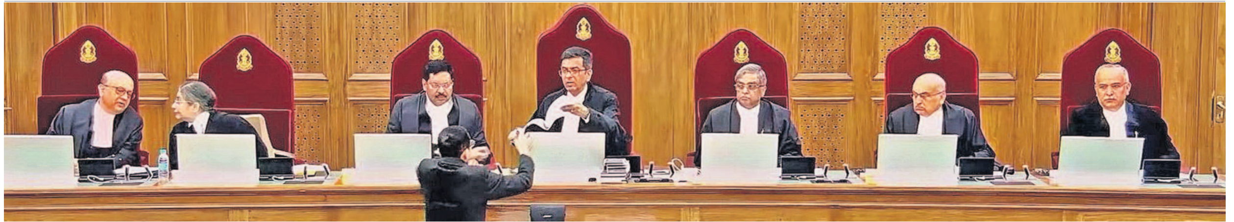
గురువారం ఎన్టీ వర్గీకరణపై తీర్పు వెలువరిస్తున్న సుప్రీం కోర్టు ధర్మాసనం సభ్యులు వరుసగా జస్టిస్ మనోజ్ మిశ్రా, జస్టిస్ బేలా ఎం త్రివేది, జస్టిస్ బీఆర్ గవాయ్, నీజేబ్ జస్టిస్ చంద్రచూడ్, జస్టిస్ విక్రమ్ నాథ్, జస్టిస్ పంచజీ మిశ్రా, జస్టిస్ సతీశ్ చంద్ర మిశ్రా

PUBLISHED FROM HYDERABAD • KARIMNAGAR • WARANGAL • KHAMMAM • NALGONDA • MAHABUBNAGAR • NIZAMABAD www.ntnews.com 00 /ntdailyonline