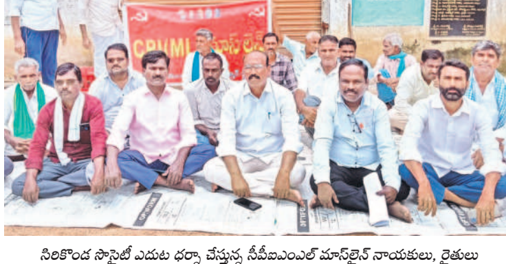
సిరికొండ సాస్టెట్ ఎదుట ధర్నా చేస్తున్న సీపీఐఎంఎల్ మాన్లైన్ నాయకులు, రైతులు