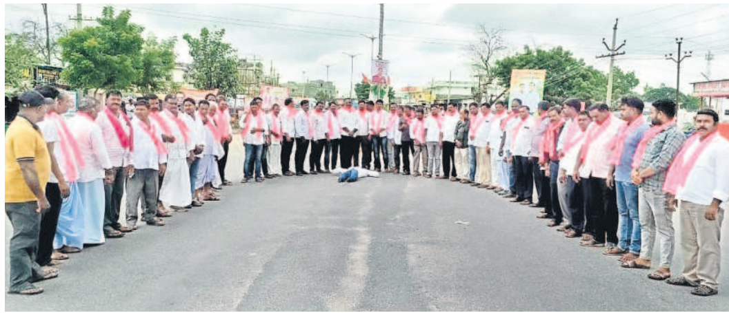
మార్కెట్లో సీఎం రేవంత్ రెడ్డి దిష్టిబొమ్మను దూసిన చోట, బీఆర్ఎస్ శ్రేణులు