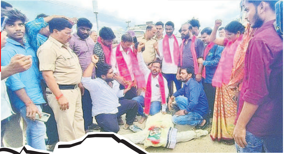
బాన్సువాడలోని అంబేద్కర్ చౌరస్తాలో సీఎం దిష్టిబొమ్మతో నిరసన తెలుపుతున్న బీఆర్ఎస్ నాయకులు

సీఎం రేవంత్ రెడ్డి, డిప్యూటీ సీఎం మల్లు భట్టివిక్రమార్క మహిళా ఎమ్మెల్యేల పట్ల చేసిన అసభిత వ్యూహాలపై గురువారం ఉమ్మడి జిల్లాలో నిరసనలు వెల్లువెత్తాయి. బీఆర్ఎస్ పేరుకు నిజామాబాద్, కామారెడ్డి జిల్లాల్లో ఆందోళన కార్యక్రమాలు నిర్వహించారు. మాజీ మంత్రులు సబితా ఇంద్రారెడ్డి, సుసీతా క్యారెడ్డి రేవంత్, భట్టి చేసిన వ్యూహాలను వెనక్కి తీసుకోవాలని డిమాండ్ చేస్తూ సీఎం దిష్టిబొమ్మలను దూసిన చోట. బోధన్లో రేవంత్ రెడ్డి దిష్టిబొమ్మను తయారు చేస్తుండగా, పోలీసులు వచ్చి దాన్ని లాక్కెళ్లిపోయారు. కామారెడ్డి, ఆర్కాట్, బాల్కొండ, బోధన్, బాన్సువాడ, నదాశివనగర్, కమ్మరపల్లి, మార్కెట్, భీమగల్లో సీఎం దిష్టిబొమ్మలను దూసిన చోట. - కామారెడ్డి / బోధన్, ఆగస్టు 1