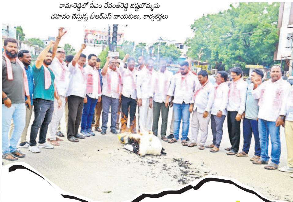
కామారెడ్డిలో సీఎం రేవంత్ రెడ్డి దిష్టిబొమ్మను దూసిన చోట, బీఆర్ఎస్ నాయకులు, కార్యకర్తలు