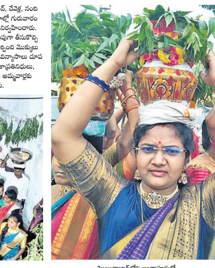
..మొయినాబాద్ లోని అండాపూరులో..