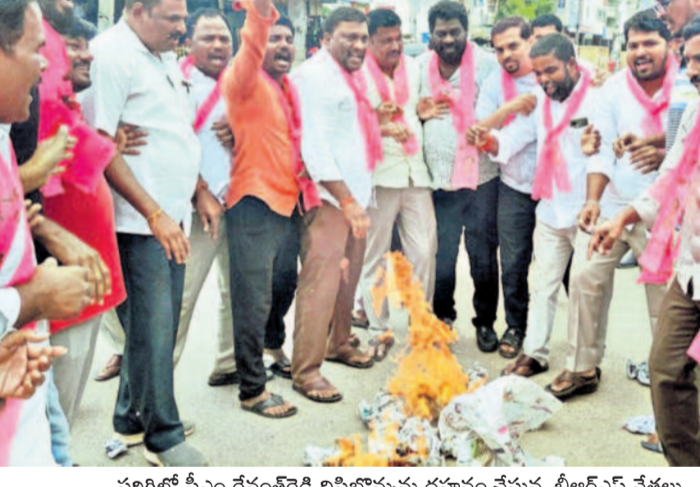
పరిగోలో సీఎం రేవంత్ రెడ్డి దిట్టబొమ్మను దహనం చేస్తున్న బీఆర్ఎస్ నేతలు

రంగారెడ్డి, ఆగస్టు 1 (నమస్తే తెలంగాణ) : అసెంబ్లీలో మాజీ మంత్రి సబితా ఇంద్రారెడ్డిపై ముఖ్యమంత్రి రేవంత్ రెడ్డి, ఉప ముఖ్యమంత్రి భట్టి విక్రమార్క చేసిన అసభ్య వ్యాఖ్యలపై ఉమ్మడి జిల్లా ప్రజాసేవకు భగ్గుమన్నది. ఈ మేరకు గురువారం బీఆర్ఎస్ శ్రేణులు, మహిళలు పెద్ద ఎత్తున ఆందోళనలు చేపట్టారు. ఉరూరా రాస్ట్రోకోలు, ధర్మాలు చేయడంతో ట్రాఫిక్కు తీవ్ర అంతరాయం ఏర్పడింది. సీఎం రేవంత్ రెడ్డి, భట్టి విక్రమార్క దిట్టబొమ్మల దహనం చేశారు. ఉమ్మడి జిల్లావ్యాప్తంగా జరిగిన నిరసన కార్యక్రమాల్లో బీఆర్ఎస్ నేతలు, కార్యకర్తలు, మహిళలు అధిక సంఖ్యలో పాల్గొని కాంగ్రెస్ ప్రభుత్వాని వ్యతిరేకంగా నినాదాలు చేశారు. రంగారెడ్డి జిల్లాలోని కేవెళ్ల, పాబాద్ గర్, మనగల్ తదితర మండలాలు, మున్సిపాలిటీల్లో బీఆర్ఎస్ పార్టీ శ్రేణులు ఆందోళనలు చేపట్టాయి. ఈ సందర్భంగా పలువురు నేతలు మాట్లాడుతూ ఉమ్మడి రాష్ట్రంలో తొలి