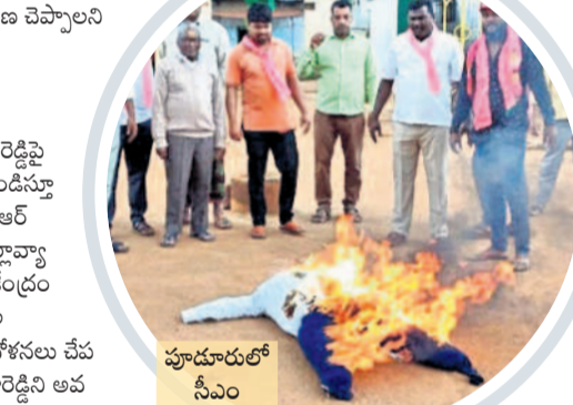
పూడూరులో సీఎం దిట్టబొమ్మ దహనం..

డిప్యూటీ సీఎం భట్టి బేషరతుగా క్షమాపణ చెప్పాలని డిమాండ్ చేశారు. వికారాబాద్ జిల్లావ్యాప్తంగా.. మహేశ్వరం ఎమ్మెల్యే సబితా ఇంద్రారెడ్డిపై సీఎం రేవంత్ రెడ్డి చేసిన వ్యాఖ్యలను ఖండిస్తూ బీఆర్ఎస్ పార్టీ వర్కింగ్ ప్రెసిడెంట్ కేటీఆర్ ఇద్దరం పిలుపు మేరకు వికారాబాద్ జిల్లావ్యాప్తంగా నిరసనలు వెల్లువెత్తాయి. జిల్లా కేంద్రం మొదలుకొని మున్సిపాలిటీలు, మండల కేంద్రాల్లో బీఆర్ఎస్ అధ్యక్షులతో ఆందోళనలు చేపట్టారు. అసెంబ్లీ నాకిగా ఎమ్మెల్యే సబితా ఇంద్రారెడ్డిని అవ