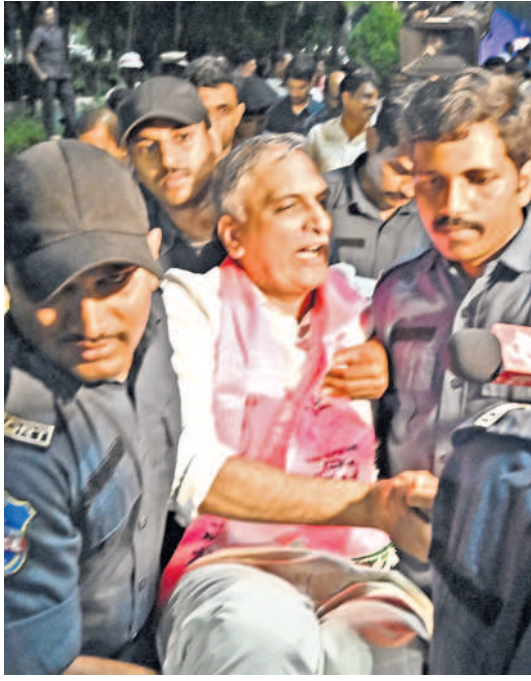
గనపార్వ వద్ద హాజీరావును ఎత్తుకెత్తుతున్న పోలీసులు