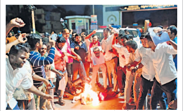
రాహుల్ గాంధీ దిద్దిబొమ్మ దహనం చేస్తున్న బీఆర్ఎస్ నాయకులు

స్కిల్స్ వర్కీ బిల్లుకు మందలి ఆమోదం. స్కిల్స్ వర్కీ బిల్లుకు మందలి ఆమోదం. స్కిల్స్ వర్కీ బిల్లుకు మందలి ఆమోదం.