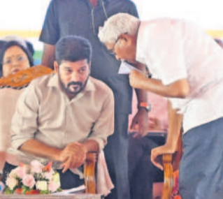
సీఎం రేవంకెరెడ్డితో మాట్లాడుతున్న టీచర్లందరూ

హైదరాబాద్, ఆగస్టు 2 (నమస్తే తెలంగాణ): ప్రైవేట్ స్కూల్లో ఇంటర్ పాస్ కేసు... డిగ్రీ ఫెయిల్యూన్ పాఠాలు చెప్పినారని సీఎం రేవంకెరెడ్డి అన్నారు. సర్కారు స్కూల్లో పని చేసే వారిలో పోటీలే సగం చదువుకున్నా ప్రైవేట్ పాఠశాలలో బోధిస్తున్నారని చెప్పారు. ప్రైవేట్ టీచర్లు సర్కారు టీచర్ల కంటే గొప్పవా రేమీ కాదని వ్యాఖ్యానించారు. శుక్రవారం హైదరాబాద్ ఎలెక్ట్రిసిటీయంతో సూతనంగా పదోన్నతి పొందిన టీచర్లతో ముఖ్యమంత్రి ముఖాముఖి కార్యక్రమాన్ని నిర్వహించారు. ఈ సభలో సీఎం మాట్లాడుతూ 'ఎంపి, బీకాడీ, డాక్టరేట్ వంటి ఉన్నత పదవులు చదువుకున్నా సర్కారు టీచర్లుగా పనిచేస్తున్నారు. ప్రైవేట్ పాఠశాలలో ఇంటర్ పాస్