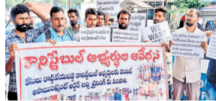
ప్రజా భవన వద్ద నిరసన వ్యక్తం చేస్తున్న కానిస్టేబుల్ అభ్యర్థులు