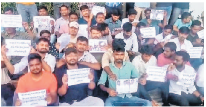
ప్రజాభవన ముందు బ్రాహ్మణుల ఆందోళనకు దిగిన జీవో నంబర్ 46 బాధితులు

ప్రజాభవన, ఆగస్టు 2: మర్దర్, పోక్సో కేసుల్లో ఉన్న వారికి నియామక ఆర్డర్ కాపీ లిచ్చి చిన్న కేసుల్లో క్లీన్ బిట్ పొందిన తమకు ఎందుకు ఇచ్చలేదని కానిస్టేబుల్ అభ్యర్థులు ఆవేదన వ్యక్తం చేశారు. పోలీస్ నియామక కాలం-2022లో ఎంపిజి పలు కేసుల కారణంగా నియామకాలు నిలిపివేయడంతో శుక్రవారం మిలిటరీ జిల్లా నుంచి ప్రజాభవనకు తరలివచ్చి నిరసన తెలిపారు. తాము ఇప్పటి వరకు కలిసిన వారి ఫోటోలతో ఉన్న బ్యాంకు రిస్ ప్రదర్శన ముఖ్యమంత్రి, మంత్రులు, ఎమ్మెల్యేల తీరుపై విరుచుకుపడ్డారు. తామే మైనా మర్దర్ కేసుల్లో ఉన్నామా? రేపే కేసుల్లో ఉన్నామా? చిన్న చిన్న పెట్టి కేసుల్లో ఉన్న తమపై పిచ్చుకపై బహుస్థూరా వ్యవహారాన్ని న్యాయ ఆవేదన వ్యక్తం చేశారు. కేసులు కొట్టి వేసిన కానిస్టేబుల్ అభ్యర్థులకు వెంటనే అపాయింట్ మెంట్ ఆర్డర్ ఇచ్చి శిక్షణకు పంపాలని డిమాండ్ చేశారు. కేసుల కారణంగా 326 మందిలో 158 మందికి ఆర్డర్ కాపీ లిచ్చి మిగతా వారికి ఇవ్వలేదని, ఇది అనుమానాలకు తావిస్తుందని అభ్యర్థులు నిరసన వ్యక్తం చేశారు. డిమాండ్ చేస్తూ 326 మంది అభ్యర్థులు జాబితాను ప్రకటించాలని, మిగతా 168 డిమాండ్ చేశారు. ఉద్యోగాల కోసం ఎదురుచూస్తున్న అభ్యర్థులందరికీ రోజూరోజూ ఆర్థిక ఇబ్బందులు తీవ్రమవుతున్నాయని ఆవేదన చెందారు. ఇకనైనా ప్రభుత్వం స్పందించాలని, లేకపోతే ఆత్మహత్యలకు సిద్ధమై ఆవేదన వ్యక్తం చేశారు.