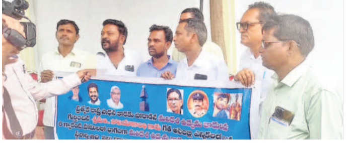
మీడియాతో మాట్లాడుతున్న కామారెడ్డి జిల్లా బాన్సువాడ మలిదశ ఉద్యమకారులు

కాంగ్రెస్ సర్కారు వైఖరిపై ప్రజల్లో నిరసన పెంబులుతుండడం దానిని శుక్రవారం ప్రజాభవనకు తరలివచ్చిన వందలాది మంది సాక్షులు. ఆరు గ్యాంగ్ వేల అభిమాని అధికారంలోకి వచ్చి 8 నెలలు కావచ్చున్నా వాటిని పూర్తిగా ఎందుకు అమలుచేయడం లేదంటూ ప్రశ్నిస్తున్నారు. హామీలను అమలుచేయాలని తెలంగాణ ఉద్యమకారులు, చిన్న కేసుల్లో క్లీన్ బిట్ పొందిన తమకు అపాయింట్ మెంట్ ఎందుకీవ్వడం లేదని పోలీస్ అభ్యర్థులు, గ్రామీణ అభ్యర్థులకు తీరని అన్యాయం జరుగుతుందని జీవో 46 బాధితులు ప్రజాభవన వద్ద నిరసన తెలిపారు. వివిధ వర్గాలకు చెందిన ప్రజలు వందలాది మంది తరలిరాగా, ఒక్కోచోటే 472 మినుతులు అందజేయడం గమనార్హం. రెవెన్యూ శాఖకు 107, సివిల్ సప్లయకు 64, విద్యుత్ కు 59, సోషల్ వెల్ఫేర్ కు 31, మైసూర్ వెల్ఫేర్ కు 26, ఇతర విభాగాలకు 165 చొప్పున అధికారులు దరఖాస్తులు స్వీకరించారు.