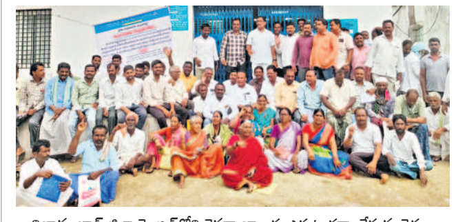
నిజామాబాద్ జిల్లా రెంజిల్లోని కెనరా బ్యాంకు ఎదుట ధర్మా చేస్తున్న రైతులు