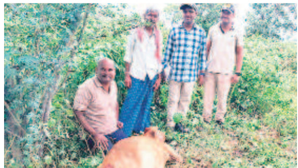
గోరంట్లలో చిరుత దాడిలో మృతి చెందిన ఆవు కోడూర్లు, పరిశీలిస్తున్న అధికారులు

గోరంట్లపట్టణ, ఆగస్టు 3 : గోరంట్లపట్టణ మండలం గోరంట్లలో చిరుత పులిదాడి చేసిన ఘటనలో రెండు ఆవులు మృతిచెందాయి. పూర్తి వివరాలిలా ఉన్నాయి. గోరంట్లలో ఉన్న కొంతమంది పట్టణం చెందిన రెండు పాడి ఆవులను వ్యక్తులకు రాత్రి చిరుత దాడి చేసింది. గ్రామ శివారులోని వ్యవసాయ పొలం వద్ద ఉన్న రెండు ఆవులను చిరుత గాయపరిచి చంపింది. పార్సెల్ అధికారులు ఘటనా స్థలాన్ని సందర్శించి చిరుత అడుగులను గుర్తించారు.