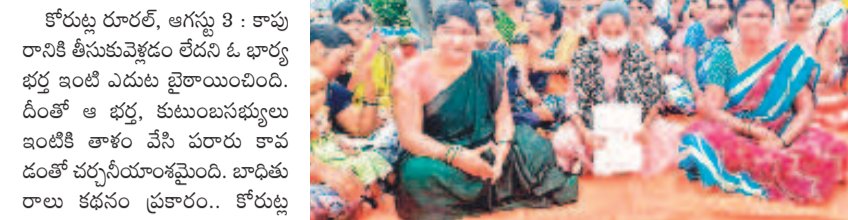
గుమ్మాపూర్లో భర్త రుణం ఇంటి ఎదుట బైరాంబులను భార్య, గ్రామస్థులు

కోరుట్ల రూరల్, ఆగస్టు 3 : కాపురానికి తీసుకువెళ్లడం లేదని ఓ భార్య భర్త ఇంటి ఎదుట బైరాంబులను పెట్టింది. దీంతో ఆ భర్త, కుటుంబసభ్యులు ఇంటికి తాళం వేసి చరచా కావడంతో చర్చలయ్యాంబెంది. బాధితుకు రుణ కడపం ప్రకారం.. కోరుట్ల మండలం గుమ్మాపూర్ కు చెందిన బోయిని రుణంకు మేకపల్లి మండలంలోని వేపేటికు చెందిన రుణంకో ఆరు నెలల క్రితం పెద్దల సమక్షంలో వివాహం జరిగింది. రుణం గర్భవతి కాగా, భర్త రుణం తన భార్యపై అనుమానం పెంచుకున్నాడు. కొన్ని రోజుల నుంచి గొడవ పడుతూనే ఆమెను పుట్టింటికి పంపించాడు. ఆ తర్వాత కాపురానికి తీసుకెళ్లకపోవడంతో పలుసార్లు పంచాయతీలు జరిగాయి. జూలై 21న భార్యను కాపురానికి తీసుకెళ్లాలని పెద్దమనుషుల సమక్షంలో ఒప్పందం రుణం, తన భార్య కాపురానికి రావడం లేదంటూ న్యాయవాదితో నోటీసు పంపించాడు. దీంతో రుణం కుటుంబ సభ్యులు, గ్రామస్థులు, మూలా నం ఘాట సభ్యులు గుమ్మాపూర్ కు చేరుకొని భర్త రుణం ఇంటి ఎదుట బైరాంబులను పెట్టారు. అప్పటి భర్త రుణం తో పాటు కుటుంబ సభ్యులు ఇంటికి తాళం వేసి పారిపోయారు. మహిళల ఆందోళన విషయం తెలుసుకున్న కోరుట్ల పోలీసులు ఘటనా స్థలానికి చేరుకొని వారిని సముదాయించి, మేకపల్లి పోలీస్ స్టేషన్లో గానీ, పెద్దమనుషుల సమక్షంలో గానీ సమస్యను పరిష్కరించుకోవాలని సూచించారు.